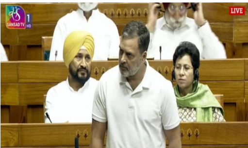
మాట్లాడారు. వాస్తవానికి ఈ సభ భారత ప్రజల ఆకాంక్షలకు ప్రతిరూపం. ఇది కేవలం ఒక పార్టీకి మాత్రమే ప్రాతినిధ్యం వహించదు. పార్లమెంట్ అనేది దేశం మొత్తానికి ప్రాతినిధ్యం వహిస్తుంది. కానీ మేము మాట్లాడడానికి ప్రయత్నించిన ప్రతిసారి మమ్మల్ని అడ్డుకున్నారు. ముఖ్యంగా యూఎస్ తో ట్రేడ్

లోకసభ స్పీకర్ ఓం బిర్లాపై వివక్షలు ప్రవేశపెట్టిన అవిశ్వాస తీర్మానంపై వాడివేడి చర్చ జరుగుతోంది. లోకసభలో ప్రతిపక్ష నేత రాహుల్ గాంధీ మాట్లాడుతూ స్పీకర్ పాత్రపై, ప్రధాని మోదీపై కీలక వ్యాఖ్యలు చేశారు. భారత్, అమెరికా మధ్య జరిగిన వాణిజ్య ఒప్పందం విషయంలో ప్రధాని మోదీ రాజీ పడ్డారని పేర్కొన్నారు. ఆ విషయంపై తాను మాట్లాడుతుంటే, స్పీకర్ ఓం బిర్లా తనను మాట్లాడనివ్వకుండా పదేపదే అడ్డుకున్నారు అన్నారు. భారత సైన్యం మాజీ అధిపతి జనరల్ మనోజ్ ముకంద్ నరవణ రచించిన 'ఫోర్ స్టార్స్ ఆఫ్ డెస్టిని' పుస్తకంపై కూడా చర్చ జరగకుండా చేశారని పేర్కొన్నారు. లద్దాఖ్ సంగ్రామ సమయంలో ప్రభుత్వ ప్రతిస్పందన గురించి నరవణ రసిన విషయాలు చెప్పనివ్వకుండా చేశారని, అందుకే ఆయనపై అవిశ్వాస తీర్మానం పెట్టాల్సి వచ్చిందని అన్నారు. "ఇక్కడ జరుగుతున్న చర్చ ప్రజాస్వామ్య ప్రక్రియ, స్పీకర్ పాత్ర గురించి, కానీ చాలా సార్లు నా పేరు ప్రస్తావనకు వచ్చింది. నా గురించి అడ్డగీలుగా