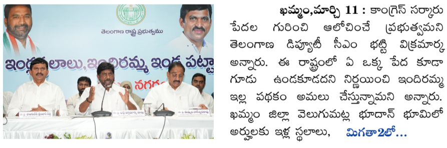
ఖమ్మం, మార్చి 11 : కాంగ్రెస్ సర్కారు పేదల గురించి ఆలోచించే ప్రభుత్వమని తెలంగాణ డిప్యూటీ సీఎం భట్టి విక్రమార్కు అన్నారు. ఈ రాష్ట్రంలో ఏ ఒక్క పేద కూడా గూడు ఉండకూడదని నిర్ణయించి ఇందిరమ్మ ఇల్ల పథకం అమలు చేస్తున్నామని అన్నారు. ఖమ్మం జిల్లా వెలుగుమట్ల భూదాన్ భూమిలో అర్హులకు ఇళ్ల పట్టాలు, మిగతా2లో...