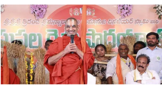
ఆరోగ్యం, భూ పరిరక్షణ, ఆరోగ్య పరిరక్షణ లక్ష్యంగా సేంద్రీయ వర్షతుల ద్వారా జన ఆరోగ్య పరిరక్షణ కార్యక్రమం గురించి వివరించారు. ఈ సందర్భంగా సేంద్రీయ వ్యవసాయ సాగుదారులతో వినజీయర్ స్వామి ప్రతిజ్ఞ చేయించారు. ఈ

కృష్ణా జిల్లా, ఫిబ్రవరి 12 : శ్వేతవిప్లవంలో కృష్ణా మిల్క్ యూనియన్ ఆదర్శంగా నిలిచిందని శ్రీ త్రీండ్రి తీమన్నారాయణ రామానుజ వినజీయర్ స్వామి వ్యాఖ్యానించారు. కృష్ణా మిల్క్ యూనియన్ చరిత్రలో ఓ సువర్ణ అధ్యాయమని పేర్కొన్నారు. కృష్ణా మిల్క్ యూనియన్ మరో హరిత విప్లవం తీసుకురా బోతోందని చెప్పుకొచ్చారు. డెయిరీ, ఆగ్రో కార్యక్రమాలని రెండింటినీ కృష్ణా మిల్క్ యూనియన్ సమీక్షితం చేయబోతోందని వివరించారు. మన ప్రాంతాల్లో పండిన పంటలకు సరైన ధర వచ్చేలా చేసే బాధ్యతను కృష్ణా మిల్క్ యూనియన్ తీసుకంటుందని తెలిపారు. ఇది ఇతరులకు ఆదర్శం కావాలని వినజీయర్ స్వామి మార్గనిర్దేశం చేశారు. కృష్ణాజిల్లాలోని వీరవల్లిలో వినజీయర్ స్వామి ఆధ్వర్యంలో గురువారం సుఫల రైతు యాత్ర కార్యక్రమం జరిగింది. వీరవల్లి కృష్ణా మిల్క్ యూనియన్ ఆధ్వర్యంలో ప్రకృతి వ్యవసాయం చేస్తున్న రైతులతో వినజీయర్ స్వామి ముఖాముఖీ నిర్వహించారు. మన నెల, మన