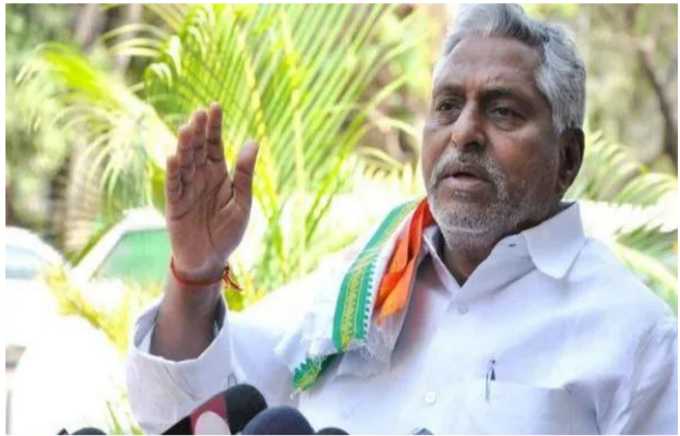
గణంకాలాతో సహా హైకమాండ్ కు వివరించారు. గెలుపు గుర్రాల లెక్కలతో ఆవేదన.. (స్ట్రైక్ రేట్: స్ట్రైక్ రేట్: తనకు కేటాయించిన 16 టి-ఫారమ్ లలో 9 మందిని గెలిపించుకున్నట్లు ఆయన గుర్తు