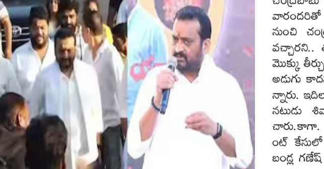
ఉండేవాడిని గుర్తుచేశారు. అక్కడ ఉన్నప్పుడే ఆయన ఎలాంటి మచ్చలేకుండా విడుదల కావాలని ఏడుకోవడం వాడికి మొక్కుకున్నానన్నారు. అనంతరం.. కేబీఆర్ పార్టీ వద్ద

హైదరాబాద్, జనవరి 19: ప్రముఖ తెలుగు సిని నిర్మాత, నటుడు బండ్ల గణేష్ 'సంకల్ప యాత్ర' పేరిట తిరుమలకు పారయాత్ర చేపట్టారు. రంగాండ్ల జిల్లా పాదినగల్లోని తన సినిమా థియేటర్ నుంచి సోపావారం ఉదయం ఈ యాత్ర ప్రారంభమైంది. సుమారు 460 - 500 కిలోమీటర్ల మేర గణేష్ యాత్ర సాగుచుంది. ఈ సందర్భంగా ఆయన మీడియాతో మాట్లాడుతూ, ఇది రాజకీయ యాత్ర కాదని.. దేవుడి మొక్కు మాత్రమే అని తెలిపారు. ముఖ్యమంత్రి చంద్రబాబుపై అభిమానంతో నడిచి వెళ్తున్నానని.. డిప్యూటీ సీఎం పవన్ కల్యాణ్ ఆశీస్సు లతో ముందుగు వేస్తున్నట్లు చెప్పారు. తాను మెగాస్టార్స్ చూడమని సినీ ఇండస్ట్రీకి వచ్చానని.. అలాంటి చిరంజీవి సినీమా తన థియేటర్లో ఆడుతుందగా సంకల్ప యాత్ర మొదలు పెట్టినట్లు బండ్ల గణేష్ చెప్పారు. నాడు చంద్రబాబు అరెస్ట్ తనను ఎంతో బాధించిందని తెలిపారు. ఆయనకు బెయిల్ వస్తుంది, కోర్టు విచారణ ఉన్న ప్రతిసారి సుప్రీంకోర్టులో