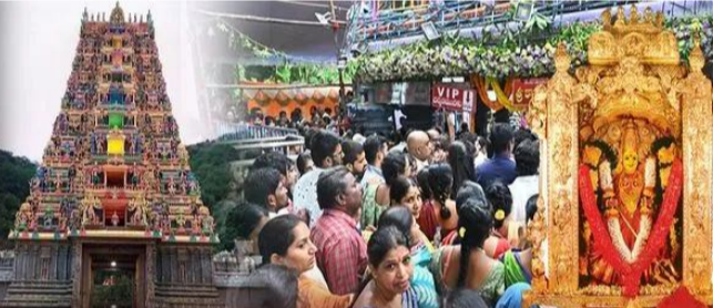
చేసుకునేందుకు ఏర్పాట్లు చేస్తున్నారు. అమ్మవారి దర్శనం అనంతరం విద్యార్థులకు పెన్ను, శక్తి కర్రకణం, అమ్మవారి ఫోటోతో పాటు 40 గ్రాముల లడ్డు ప్రసాదాన్ని ఉచితంగా అందజేస్తామని దేవస్థానం ఉన్నతాధికారులు వెల్లడించారు. ఈ

విజయవాడ, జనవరి 19: పర్వదినాల మాసం. మాఘమాసం. జనవరి 23న మాఘ శుద్ధ పంచమి. ఈ శ్రీ పంచమిని పురస్కరించుకుని ఇండ్రకీలాద్రిపై కాలాపుడిదీన శ్రీమద్ధామలైక్ష్యుర స్వామి వారి దేవస్థానంలో ప్రత్యేక ఏర్పాట్లు చేస్తున్నారు. ఆ రోజు భక్తులకు శ్రీ దుర్గమ్మవారు సరస్వతీ దేవి రూపంలో దర్శనం ఇవ్వనున్నారు. దీంతో ప్రధాన ఆలయంలో అమ్మవారి మూల స్వరూపానికి ప్రత్యేక అలంకరణతో పాటు, మహాపంచమం ఆరో అంత స్తుతి ఉభయమూర్తిని ప్రతిష్ఠించి ప్రత్యేక పూజలు నిర్వహించనున్నారు. ఇక.. ఆరో అంతస్తులో దాదాపు 500 మంది విద్యార్థులకు ఉచిత సామాజిక ఆక్షరాస్య కార్యక్రమం నిర్వహించనున్నారు. అలాగే, యాగశాలలో శ్రీ సరస్వతీ హోమం సహా పలు వైదిక కార్యక్రమాల నిర్వహించనున్నారు. శ్రీ పంచమి రోజు ఉదయం 6 గంటల నుంచి సాయంత్రం 7 గంటల వరకు సరస్వతీ దేవి రూపంలో అమ్మవారిని విద్యార్థులు ఉచిత దర్శనం