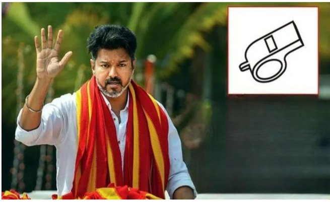
ఏప్రిల్ నుంచి మే మధ్య కాలంలో జరిగే అవకాశం కనిపిస్తోంది.

న్యూఢిల్లీ, జనవరి 22: తమిళ స్టార్ హీరో విజయ్?కు చెందిన తమిళగ వెల్లె కళగం పార్టీ(ఎఐకె) కేంద్ర ఎన్నికల సంఘం ఎన్నికల గుర్తును కేటాయించింది. గురువారం ఢిల్లీకి పాల్టికి 'విజయ్' గుర్తును కేటాయించి ఈసీ నిర్ణయం తీసుకుంది. 2026లో జరుగుతున్న తమిళనాడు అసెంబ్లీ ఎన్నికల్లో ఢిల్లీకి పార్టీ కల గుర్తు మీద పోటీ చేయనుంది. ఈసీ తమ పాల్టికి ఈల గుర్తు కేటాయించిన నేపథ్యంలో విజయ్ అభిమానులు, ఢిల్లీకి పార్టీ కార్యకర్తలు నంతోపాటు వ్యక్తం చేస్తున్నారు.జోరుగా పార్టీ కార్యకలాపాలు,రానున్న అసెంబ్లీ ఎన్నికల్లో విజయ్ మే లక్ష్యంగా విజయ్.. ఢిల్లీకి పార్టీని అన్ని రకాలుగా సిద్ధం చేస్తున్నారు. గత మంగళవారం చెన్నైలో ఎన్నికల ప్రచార కమిటీకి సంబంధించిన మొదటి మీటింగ్ జరిగింది. సామాజిక న్యాయం, పౌరదర్శకతలకు పెద్ద పీట వేస్తూ ఢిల్లీకి పార్టీ మేనిఫెస్టోను సిద్ధం చేస్తున్నట్లు తెలుస్తోంది. రాష్ట్రంలో అసెంబ్లీ ఎన్నికలు 2026