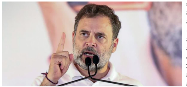
వంతు వచ్చింది. కార్మికులంతా ఏకమైతేనే ప్రభుత్వం దిగి వస్తుంది. కొత్తగా తెచ్చిన వీవీ-జీ రామ్ జీ చట్టాన్ని రద్దు చేసేదాకా పోరాడాలి" అని రాహుల్ పిలుపునిచ్చారు.దేశ సంపదను కార్యకర్తలకు దోచిపెడుతున్నారని రాహుల్ విమర్శించారు. "మోడీ కోరుకుంటున్న 'భారతదేశ మోడల్' చాలా ప్రమాదకరమైనది. దేశంలోని ఆస్తులన్నీ కొద్దిమంది చేతుల్లోనే ఉండాలి. పేద ప్రజలంతా అదానీ, అంటానీలపై ఆధారపడి బతకాలి. ఇదే

కేంద్రంలోని సరేంద్ర మోడీ ప్రభుత్వం పేదల పొట్టకొట్టేలా ఇవ్వడంపై గతంలో రైతులపై ప్రయోగించిన అప్రెంట్ ఇప్పుడు నిరుపేద కార్మికులపై ప్రయోగిస్తోందని లోక్?సభ ప్రతి పక్ష నేత రాహుల్ గాంధీ తీవ్రస్థాయిలో ధ్వజమెత్తారు. మహాత్మా గాంధీ జాతీయ గ్రామీణ ఉపాధి హామీ చట్టాన్ని రద్దు చేసి, దాని స్థానంలో కొత్త చట్టాన్ని తీసుకురావడం వెనుక పెద్ద కుట్ర దాగి ఉందని ఆయన ఆరోపించారు. గురువారం న్యూఢిల్లీలో జరిగిన 'జాతీయ ఉపాధి హామీ కార్మికుల సదస్సు'లో పాల్గొన్న రాహుల్, మోడీ సర్కార్ తీరును ఎండగట్టారు. గతంలో నల్ల వ్యవసాయ చట్టాలను తెచ్చి రైతులను ఇబ్బంది పెట్టినట్లే, ఇప్పుడు కొత్త చట్టంతో కార్మికులను ఇబ్బంది పెట్టాల్సింది ముందేపడ్డారు. రైతుల్లాగే పోరాడాలిన్న చట్టాలకు వ్యతిరేకంగా రైతులు పోరాడినట్లు కార్మికులు ఉద్ఘోషించాలని రాహుల్ గాంధీ పిలుపునిచ్చారు. "కొన్నట్లైతే మోడీ ప్రభుత్వం మూడు నల్ల వ్యవసాయ చట్టాలను తెచ్చింది. అప్పుడు దేశంలోని రైతులంతా ఏకమయ్యారు. ప్రభుత్వంపై ఉమ్మడిగా ఒత్తిడి తెచ్చారు. దీంతో కేంద్రం దిగిరాక తప్పలేదు. ఆ చట్టాలను వెనక్కి తీసుకుంది. ఇప్పుడు మీ