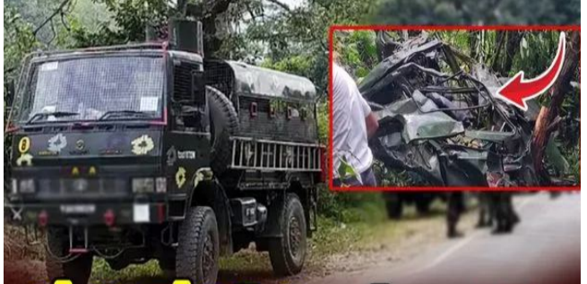
ఉన్నట్లు తెలుస్తోంది. ఇప్పటికే పది మంది సైనికుల మృత్యు చోటను స్వాధీనం చేసుకున్న అధికారులు.. ఘటనా స్థలిలో రెస్క్యూ ఆపరేషన్ కొనసాగిస్తున్నారు.లెక్స్?నెట్ గవర్నర్ సంతాపం.ఈ ప్రమాదాన్ని జమ్మూకశ్మీర్ లెక్స్?నెట్ గవర్నర్

జమ్మూ కశ్మీర్, జనవరి 22: జమ్మూకశ్మీర్ లోని దోడా సెక్టార్ లో ఘోర రోడ్డు ప్రమాదం జరిగింది. జవాన్లతో వెళ్తున్న ఓ ఆల్టి వాహనం అదుపుతప్పి 200 అడుగుల లోయలో పడింది. ఈ ప్రమాదంలో 10 మంది జవాన్లు మృత్యువెందింది. పలువురు తీవ్రంగా గాయపడ్డారు. సమాచారం అందిన వెంటనే సైన్యం, పోలీసులు ఘటనా స్థలికి చేరుకుని సహాయక చర్యలు చేపట్టారు. క్షతగాత్రులను హాటాహూడిన ఉద్దంఘర్ మిలటరీ ఆస్పత్రికి తరలించారు. గాయపడిన వారిలో పలువురు జవాన్ల పరిస్థితి విషమంగా ఉన్నట్లు తెలుస్తోంది.మొత్తం 17 మంది సైనికులతో కూడిన ఆల్టి వాహనం ఓ హై ఆల్టిట్యూడ్ పోస్టుకు వెళ్తుండగా ప్రమాదం జరిగింది. భద్రాచలం-చంబా అంతర్జాతీయ రహదారి వెంబడి ఖన్నీ టాప్ దగ్గర డ్రైవర్ నియంత్రణ కోల్పోవడంతో వాహనం 200 అడుగుల లోయలో పడినట్లు ఆల్టి వర్గాలు వెల్లడించాయి. గాయపడిన వారిలో పలువురు జవాన్ల పరిస్థితి విషమంగా ఉండటంతో మృతుల సంఖ్య పెరిగే అవకాశం