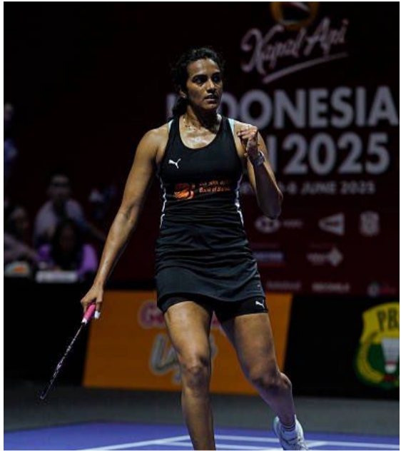
చేరాలని సింధు భావిస్తోంది. 2009లో సింధు బ్యాడ్మింటన్ లో అరంగేట్రం చేసింది. తన సుదీర్ఘ కెరీర్ లో ఆమె ఎన్నో ఘనతలు సాధించింది. ఇప్పటిదాకా కెరీర్ లో 732 మ్యాచ్ లు ఆడింది. ఇందులో 500 మ్యాచ్ లో నెగ్గింది. ఇందులో 456 విజయాలు దిట్ట టూర్ లో సాధించినవే. 2013లో బ్యాడ్మింటన్ పరల్ ఛాంపియన్ షిప్ లో బ్రాంజ్ మెడల్ నెగ్గింది. ఈ ఛాంపియన్ షిప్ లో బ్రాంజ్ నెగ్గిన భారత తొలి షట్లర్ గా రికార్డు కొట్టింది. అలాగే 2016 రియా ఒలింపిక్స్ లో పైనల్ చేరింది. అయితే పైనల్ లో రన్నరమ్ గా నిలిచి సిల్వర్ పట్టెసింది. దీంతో భారత్ నుంచి ఒలింపిక్స్ లో బ్యాడ్మింటన్ ఈవెంట్ లో పైనల్ చేరిన తొలి అథ్లెట్ గా రికార్డు సృష్టించింది.