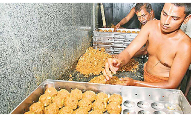
చెందిన భోలేబాబా డెయిరీ కీలక పాత్ర పోషించిందని సీబీఐ తన దర్యాప్తులో వెల్లడించింది. భోలేబాబా డెయిరీ యజమానులు అంశాలపై ఛార్జీషీట్లో సీబీఐ పేర్కొన్నట్లు సమాచారం.