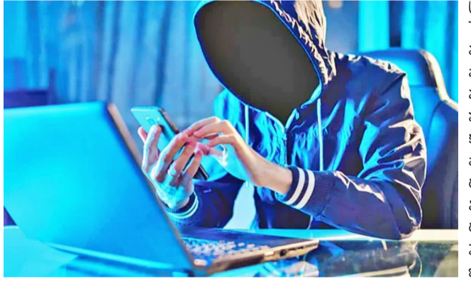
డిసెంబరు 12న తొలిసారి రూ.31.5 లక్షలు పెట్టుబడిపెట్టగా లాభాలు చూపించారు. మరిన్ని పెట్టుబడులు పెడితే లాభాలు ఎక్కువగా వస్తాయని చెప్పగా, అతను రెండోసారి రూ.42.27 లక్షలు బదిలీ చేశారు. డబ్బు విల్డ్రా చేసుకోవడానికి ప్రయత్నించగా, లాభంలో 30 శాతం వస్తు యూపీకే

హైదరాబాద్: ముందు పెట్టుబడి పెట్టమని చెప్పి ఒప్పిస్తారు. తర్వాత కొంత లాభాలు చూపించి నమ్మిస్తారు. మరింత పెట్టుబడులు పెడితే లాభాలు భారీగా వస్తాయంటూ మాయమాటలతో వంచిస్తారు. ఫోన్లో డిజిటల్ క్యాష్ కనిపిస్తున్నాయని నమ్మి, విల్డ్రా చేస్తే మాత్రం డబ్బులు బయటకు రావు. అప్పుడు గానీ అర్థం కాదు మనం మోసపోయామని. ఇలా వేర్వేరు ఉదంతాల్లో సైబర్ నేరగాళ్లు ఇద్దరి నుంచి రూ.కోట్లు కొల్లగొట్టారు. ఇందుకు సామాజిక మాధ్యమాలు వేదికగా మారాయి. రూ.2.14 కోట్లు కొట్టేశారు. హైదరాబాద్లోని గచ్చిబౌలి టీఎన్?జీవో కాలనీకి చెందిన ఓ సాఫ్ట్వేర్ ఇంజనీర్ (44) నుంచి రూ.2.14 కోట్లు కొట్టేశారు. బాధితుడి ఫిర్యాదుతో సైబరాబాద్ సైబర్క్రైమ్ పోలీసులు కేసు నమోదు చేశారు. అతనితో గత ఏడాది డిసెంబరులో సైబర్ నేరగాళ్లు సామాజిక మాధ్యమాల ద్వారా ఓ మహిళల పరిచయం పెంచుకున్నారు. తాను స్టాక్ ట్రేడింగ్ ద్వారా బాగా లాభాలు సంపాదిస్తున్నట్లు 'ఆ మహిళ' మాయమాటలతో నమ్మించింది. లాభాలు వస్తున్నాయని నమ్మి; అనంతరం సైబర్ నేరగాళ్లు ఓ యాప్ డౌన్లోడ్ చేయించి రిజిస్ట్రేషన్ చేయించారు.