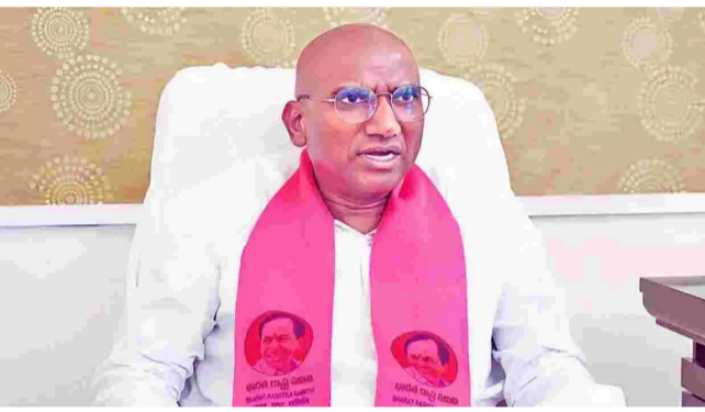
నికీ ఈ కేసును వాదుకుంటోందని ఆయన ఆరోపించారు. గత ప్రభుత్వ హయాంలో ప్రతిపక్ష నేతలు, వ్యాపారవేత్తలు.. ప్రజల ఫోన్లను అక్రమంగా ట్యాపింగ్ చేశారనే ఆరోపణలతో ఈ కేసు నమోదైంది. దీనిపై రాష్ట్ర ప్రభుత్వం ప్రత్యేక విచారణ బృందాన్ని (సీట్) ఏర్పాటు చేసింది. ఇప్పటికీ పలువురు అధికారులు ఉన్నతాధికారులను అరెస్ట్ చేయగా.. రాజకీయ నాయకుల