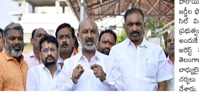
చేశారు. దేశ భద్రత కోసం చేసే ట్యాపింగ్ కు, తెలంగాణలో జరిగిన అక్రమ ట్యాపింగ్ కు అన్నలు సంబంధం లేదని ఆయన స్పష్టం చేశారు. గత ప్రభుత్వ హయాంలో మాఝంపల్లె పేరు చెప్పి

హైదరాబాద్: ఫోన్ ట్యాపింగ్ కేసు విచారణ సాగుతున్న తీరుపై కేంద్రమంత్రి బండీ సంజయ్ ఘాటూగా స్పందించారు. ఈ విచారణ అంతా ఒక ముగింపు లేని టీవీ సీరియల్ లా సాగుతోందని ఆయన ఎద్దేవా చేశారు. కరీంనగర్ లో ఏర్పాటు చేసిన మీడియా సమావేశంలో ఆయన మాట్లాడుతూ.. కాంగ్రెస్ ప్రభుత్వం ఈ కేసు విషయంలో కేవలం నాటకాలు ఆడుతోందని, అసలైన నిందితులను పట్టుకోవడంలో వెనుకాడుతోందని విమర్శించారు. తప్పు చేసిన వారిని శిక్షించాలనే పట్టుదల ప్రభుత్వానికి లేదని ఆయన ఆరోపించారు. ఈ ఫోన్ ట్యాపింగ్ వ్యవహారంలో మాజీ మంత్రి కేటీఆర్ పాత్రపై సంజయ్ తీవ్ర విమర్శలు చేశారు. సిరిసిల్ల కేంద్రంగా అక్రమంగా ఫోన్లు ట్యాపింగ్ చేయారని, ఆయన చేసిన పనుల వల్ల ఎన్నో కుటుంబాలు రోడ్డున పడ్డాయని మండిపడ్డారు. దొంగ దొంగ అన్నట్లుగా కేటీఆర్ వ్యవహారం అధిచా