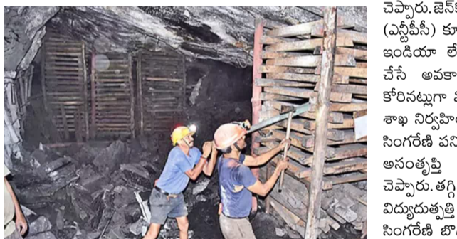
ఉత్పత్తి చేసి 44.17 ఎంబీల అమ్మకాలను సమోదించింది. గతేడాది ఇదే 9 నెలలలో పొందినట్లయితే ఉత్పత్తి 6.69 శాతం, అమ్మకాలు 4.35 శాతం తగ్గాయి. కోల్ ఇండియాతో పోలిస్తే సింగరేణి బియ్యం విక్రయ ధర కొన్ని గ్రేడ్లలో 100 శాతం వరకు అధికంగా ఉంటోంది. ఎక్కువ ధరలు చెల్లిస్తున్నా నాణ్యమైన బొగ్గును సరఫరా చేయడం లేదని సింగరేణికి జెన్కో? లేఖ రాసింది. నాణ్యత లేని బొగ్గు కారణంగా ప్లాంట్లలో విద్యుదుత్పత్తి తగ్గుతుందని, వాంతో పాటు కాలవ్యయం అధికంగా వెలుపడుతోందని జెన్కో? ఇంజనీర్లు ఈనాడు-ఈడీసీ భారత్కు

సింగరేణి: సింగరేణిలో బొగ్గు ఉత్పత్తి, అమ్మకాలు క్రమంగా తగ్గుతున్నాయి. కొత్త మైన్స్ (గనులు) రాకపోవడం, పాత గనుల్లో పురోగతి లేకపోవడంతో సంస్థ అడ్డంకులతో పడునిపోయింది. సింగరేణి బొగ్గు వికల్పాలకు సంబంధించిన ధరలు అధికంగా ఉన్నాయని ఇప్పటికే 20 పరిశ్రమలు ఈ సంస్థ నుంచి కొనుగోళ్లను మానేశాయి. ప్రస్తుతం పవర్ ప్లాంట్లకు బొగ్గు అమ్మకాలే సింగరేణికి కీలకంగా మారాయి. ఈ ప్లాంట్ల యాజమాన్యాల అధిక ధరల కారణంగా తప్పకొవాలని మాస్తున్నట్లుగా సమాచారం. సింగరేణి బొగ్గు విక్రయ ప్రక్రియ అధికంగా ఉన్నందువల్ల తమపై ఆదనపు భారం పడుతోందని జెన్కో? తాజాగా రాష్ట్ర ప్రభుత్వానికి నివేదించింది. ఈ కారణంగానే తమ ప్లాంట్లలో విద్యుదుత్పత్తి వ్యయం అధికంగా ఉందని తెలంగాణ రాష్ట్ర విద్యుత్? నియంత్రణ మండలి (ఆఐఆర్?సి)కి సమర్పించిన సేవీకరణ సర్దుబాటు కమిటీ. తగ్గిన అమ్మకాలు : 2021-22 సంవత్సరంలో 65.53 మిలియన్? బియ్యం (ఎంబీ) బొగ్గును సింగరేణి రవాణా చేయగా 2024-25లో అది 65.23 మిలియన్ బియ్యంలకు తగ్గింది. ప్రస్తుత అధిక సంవత్సరం (2025-26)లో ఈ ఏప్రిల్? నుంచి డిసెంబరు వరకు 9 నెలల్లో 51.47 ఎంబీల ఉత్పత్తి, అమ్మకాలు సాధించాలని సంస్థ లక్ష్యంగా పెట్టుకున్నప్పటికీ 4.73 ఎంబీల