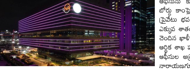
ప్రభుత్వ భవనాల్లోకి మారుస్తున్నారు. ఇదిలా ఉంటే.. బైరామల్ ాడ, బోపరంపేట, హయత్ నగర్ ప్రాంతాల్లోని విద్యుత్ శాఖ అభివృద్ధి పాటుగా.. రామచంద్రాపూర్ లోని పాల్యాషన్ కంట్రోల్ బోర్డు జోనల్ ఆఫీస్, ల్యాబ్ లను.. ఎర్రపంజిల్లోని పాత ఆరండ్ బి ఆఫీసు బిల్డింగ్, మొజాంజాహి మార్కెట్ లోని తల్లూ గూడా కాంప్లెక్స్ లోకి మారుస్తున్నారు. వీటితో పాటు బర్మింగ్ హిల్స్ లోని ఆఫీసు తెలంగాణ ఎంపీఎంబీఎస్ ట్రిబ్యునల్