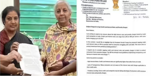
మన దేశంలోనూ క్రెడిట్ కార్డు వడ్డీ రేట్లపై పరిమితి ఉంచేలా చర్యలు తీసుకోవాలని సూచించారు. మన దేశంలో క్రెడిట్ కార్డ్

అమరావతి : క్రెడిట్ కార్డు అనేది నిత్యావసరంగా మారిపోయింది. గతంలో తక్కువే కానీ.. ఇప్పుడు చాలా మంది ఉపయోగిస్తున్నారు. క్యాష్ బ్యాక్, రివార్డు పాయింట్లు కారణం ఏదైతేనే.. క్రెడిట్ కార్డు వాడకమనేది గతంతో పోలిస్తే చాలా పెరిగిపోయింది. అయితే క్రెడిట్ కార్డు వాడేవారిని ఇబ్బందిపెట్టే సమస్య క్రెడిట్ కార్డు వడ్డీ రేటు. ఒక్కో బ్యాంక్ ఒక్కో రకంగా క్రెడిట్ కార్డు వడ్డీ రేట్లను వసూలు చేస్తోంది. ఈ నేపథ్యంలోనే క్రెడిట్ కార్డు వడ్డీ రేట్లపై నియంత్రణ ఉంచాలంటూ రాజమండ్రి ఎంపీ దగ్గుబాటి పురందేశ్వరి కేంద్రానికి జిల్లప్రతినిధులు చేశారు. ఈ మేరకు కేంద్ర ఆర్థిక మంత్రి నిర్మలా సీతారామన్ కు దగ్గుబాటి పురందేశ్వరి వినతిపత్రం సమర్పించారు. అమెరికా తరహాలోనే