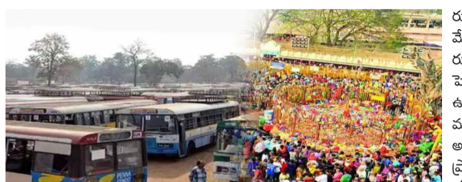
బస్సులు నడుపుతూనే ఆమె వివరించారు. చాల్వల వివరాలి.. భూపాలపల్లి నుంచి మేడారం వరకు పెద్దలకు

మహాదేవపూర్ (కరీంనగర్): మేడారం మహా జాతకు వెళ్లే భక్తుల సౌకర్యార్థం భూపాలపల్లి డిపో పరిధిలో మొత్తం నాలుగు క్యాంపులు ఏర్పాటు చేసినట్లు డిపో మేనేజింగ్ హిందూ తెలిపారు. భూపాలపల్లి పట్టణంలో భూపాలపల్లి బస్ స్టేషన్, కాలూరులో కాశీశ్వరం వెళ్లే మార్గంలో ఉన్న బస్ స్టేషన్, కాశీశ్వరం లో కాశీశ్వరం బస్టాండ్, మహాకాష్ఠలోని సిరోవం బస్ స్టేషన్? పక్కన ఉన్న పార్కింగ్ ప్రదేశం నుంచి మేడారం అమ్మవారి గద్దెల వరకు మొత్తం 80 ప్రత్యేక బస్సులు నడుపుతున్నట్లు ఆమె తెలిపారు. భూపాలపల్లి క్యాంపు ఈ నెల 25 నుంచి 31వ తేదీ వరకు కొనసాగుతుందని, మిగిలిన కాలూరు, కాశీశ్వరం, సిరోవం క్యాంపులు ఈ నెల 26 నుంచి 31వ తేదీ వరకు ప్రత్యేక