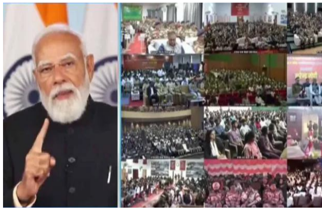
పరేడ్ లో సీఆర్పీఎఫ్ పురుష దళానికి మహిళా అసిస్టెంట్ కమాండ్ డెంట్ నాయకత్వం వహిస్తుందని ఆయన పేర్కొన్నారు. రోజుగారే మేళా కార్యక్రమం ద్వారా యువతకు ఉద్యోగ అవకాశాలు కల్పించడం, ప్రభుత్వ నిబద్ధతను చాటి చెబుతోందని మోదీ పేర్కొన్నారు. ఈ మేళా ద్వారా ఇప్పటివరకూ 11 లక్షలకు పైగా నియామక పత్రాలు విడుదల చేశారు. వివిధ మంత్రిత్వ శాఖలు.. హోం వ్యవహారాలు, ఆరోగ్యం, ఆర్థిక సేవలు, ఉన్నత విద్య విభాగాలతోపాటు ఇతర శాఖల్లో ఈ నియామకాలు జరిగాయి. దేశవ్యాప్తంగా ఉన్న యువత ఈ కార్యక్రమంలో పాల్గొని ఉద్యోగ నియామక పత్రాలు స్వీకరించారు.

న్యూఢిల్లీ, జనవరి 24: దేశవ్యాప్తంగా (శనివారం) జరిగిన 18వ రోజుగారే మేళా కార్యక్రమంలో ప్రధాని సరేంద్ర మోదీ 61,000 మందికి ఉద్యోగ నియామక పత్రాలు అందించారు. కొత్తగా వివిధ శాఖల్లో కేంద్ర ప్రభుత్వ ఉద్యోగాలు వచ్చిన వారికి నియామక పత్రాలను మోదీ వర్చువల్ గా అందజేశారు. ఈ కార్యక్రమాన్ని బీడియా కాన్ఫరెన్స్ ద్వారా దేశవ్యాప్తంగా 45 కేంద్రాల నుంచి నిర్వహించారు. ఈ సందర్భంగా ప్రధాని మోదీ మాట్లాడుతూ, మొత్తం నియామకాల్లో 49,200.. హోంమంత్రిత్వ శాఖ, పాఠామిలిటరీ దళాలకు సంబంధించినవని తెలిపారు. మహిళా కానిస్టేబుల్స్ భారీగా నియామకం చేయబడ్డారని, గత 11 నెలల తర్వాత ప్రభుత్వం అనేక సౌలభ్య చర్యలు తీసుకున్నందు వల్ల ఇది సాధ్యమైందని వివరించారు. బీఎన్ఎఫ్ మహిళా దళాలు సరిహద్దుల్లో జీరో లైన్ వద్ద ఉద్యోగాలు చేస్తున్నారని, రిపబ్లిక్ డే