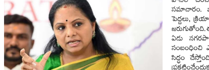
ఎలాగైనా గెలుపించుకోవాలని ప్రణాళికలు వేసుకుంటున్నాయి. స్థానిక ఎన్నికల్లో గెలుపొందిన విధంగానే పురపాలక పోరులో సత్తా చాటాలని కాంగ్రెస్ పార్టీ ఉద్దేశ్యాలతోంది. ఆ దిశగా తమ పార్టీ శ్రేణులను కడం తొక్కిస్తోంది. ఉపయోగం ప్రధాన రాజకీయ పార్టీల సంప్రదింపులు : మున్సిపల్ ఎన్నికల్లో పోటీ చేసేందుకు ఆసక్తి ఉన్న అశాపవాలతో పలు ప్రధాన రాజకీయ పార్టీలు సంప్రదింపులు చేస్తున్నాయి. ప్రధానంగా అధికారంలో ఉన్న కాంగ్రెస్? పార్టీ రిజిస్ట్రేషన్ ఆధారంగా పలుచోట్ల అశాపవాల జాబితాతో సంప్రదింపులు జరుపుతున్నట్లుగా సమాచారం. గెలుపు గుర్రాల వేటలో అన్ని రాజకీయ పార్టీలు ఉన్నాయి. తాజాగా పురపాలక రిజిస్ట్రేషన్ ప్రకటించడంతో అశాపవాల అప్పటి వరకు వేసుకున్న పూర్వోపా మార్చి, విజయం సాధించడం కోసం తీవ్రంగా ప్రయత్నాలు చేస్తున్నారు. వారు గెలువగలిగి, సమీప వార్డులపై దృష్టి సారస్తున్నారు. మహిళా రిజిస్ట్రేషన్ అధికంగా ఉండటంతో వారి భార్యలను

హైదరాబాద్, జనవరి 24 : రాష్ట్రంలో త్వరలో జరగబోయే పురపాలక సంఘ ఎన్నికల్లో పోటీ చేయాలని తెలంగాణ జాగృతి నిర్ణయించింది. మరోవైపు ఆ పార్టీ ముఖ్య నేతలు రాజకీయ పార్టీ రిజిస్ట్రేషన్ ప్రక్రియలో వేగం పెంచారు. పార్టీ రిజిస్ట్రేషన్ పూర్తి కావడానికి మూడు నెలల సమయం పట్టే అవకాశం కనిపిస్తోంది. దీంతో మున్సిపాలిటీ, ఎంపీ టీసీ, జడ్పీటీసీ ఎన్నికల్లో ఆల్ ఇండియా ఫార్వర్డ్ బ్లాక్?కు చెందిన సింహం గుర్తుతో పోటీ చేయాలని నిర్ణయించినట్లు సమాచారం. ఈ మేరకు ఏబిఎస్ డి రాష్ట్ర నాయకత్వంతో చర్చలు జరిపినట్లుగా తెలుస్తోంది. ఉమ్మడి గుర్తు కోసం ఆల్? ఇండియా ఫార్వర్డ్ బ్లాక్ బీఫారం తో పోటీ చేయనున్నట్లుగా సమాచారం. పురపాలక ఎన్నికలపై రాజకీయ పార్టీల గురి : పురపాలక ఎన్నికల నోటిఫికేషన్ 27వ ప్రకటన ఇప్పించుకున్న రాష్ట్ర ఎన్నికల సంఘం సమావేశాలు చేస్తోంది. ఈ తరుణంలో మున్సిపాలిటీల్లో విజయం సాధించాలని పలు పార్టీలు తీవ్రస్థాయిలో ప్రయత్నాలు చేస్తున్నాయి. రాష్ట్రంలో పలు పురపాలక పరిధిలో రాజకీయ సమీకరణలు జోరందుకున్నాయి. చైర్మన్ బీఆర్ఎస్ లక్ష్యంగా ప్రధాన రాజకీయ పార్టీలు గెలుపు గుర్రాల కోసం వేగంగా పావులు కదుపుతున్నాయి. పురపాలక ఎన్నికలకు ఇటీవలే తెలంగాణ రాష్ట్ర ప్రభుత్వం పచ్చజెండా ఊపిన విషయం తెలిసిందే. తుది ఓటరు జాబితాలు, వార్డుల వారీగా రిజిస్ట్రేషన్ ప్రకటించడంతో పలుచోట్ల ఎన్నికల హడావిడి మొదలైంది. త్వరలోనే షెడ్యూల్ వెలువడే అవకాశం ఉండటంతో రాజకీయ పార్టీలు పలు పూర్వోపా రచిస్తున్నాయి. తమ పార్టీ అభ్యర్థులను