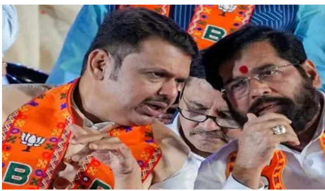
రిజిస్ట్రేషన్ ప్రక్రియను ఇప్పటికే పూర్తి చేశారు. బీజేపీ-షిండే కూటమి ఇంకా పేపర్ వర్క్ పూర్తి చేయకపోవడంతో ఫిబ్రవరి మొదటి వారానికి మేయర్ ఎన్నిక వాయిదా పడింది. దీంతో

ముంబై: బునోన్ ముంబై మున్సిపల్ కార్పొరేషన్ మేయర్ ఎన్నికకు చివరి నిమిషంలో అవాంతరం తలెత్తింది. దీంతో జనవరి 31న జరగాల్సిన మేయర్ ఎన్నిక ఫిబ్రవరి మొదటి వారానికి వాయిదా పడింది. బీజేపీ, షిండే సారథ్యంలోని శివసేన గ్రూప్ రిజిస్ట్రేషన్ల పూర్తి చేయకపోవడంతో ఈ పరిస్థితి తలెత్తింది. ముంబై మేయర్ పదవి కోసం బీజేపీ, షిండే శివసేన పోటీ పడుతున్న నేపథ్యంలో తాజా పరిణామం చోటుచేసుకుంది. బీఎంసీ మేయర్ పోస్టును లాటరీ వ్యవస్థలో మహిళకు కేటాయించారు. జనవరి 31న ఓటింగ్ జరగాల్సి ఉంది. అయితే, బీజేపీ, శివసేన కార్పొరేటర్లు గ్రూప్ రిజిస్ట్రేషన్లను పైసలైజ్ చేయకపోవడంతో మేయర్ ఎన్నికల ప్రక్రియలో అవాంతరం తలెత్తింది. పోటీలో ఉన్న కూటమిలన్నీ భాగస్వామ్యం ఒప్పంద పత్రాలను మున్సిపల్ సెక్రటరీ కార్యాలయంలో సమర్పించడం తప్పని సరి. అంతవరకూ ఎన్నికల ప్రక్రియను చేపట్టే వీలుండదు. ఉద్దవ్ శివసేన-ఎంఎన్ఎస్ కూటమికి చెందిన 65 మంది కార్పొరేటర్లు