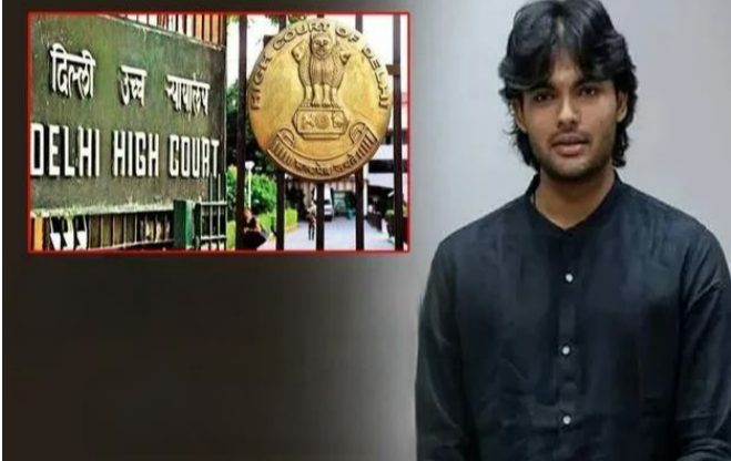
వ్యక్తిత్వాన్ని ఉపయోగించడం దోపిడీ చేయడమేనని హైకోర్టు