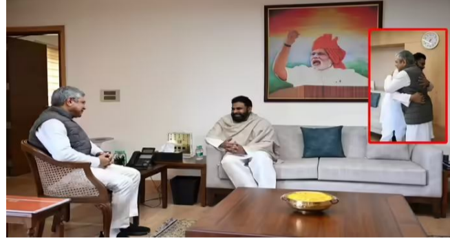
సౌకర్యాల కల్పించాలని కోరారు. విశాఖరం నుంచి కాకినాడు వేరుగా రైలు కనెక్టివిటీ ఏర్పాటు చేయాలన్నారు. ప్రస్తుతం సామర్లకోట మీదుగా వెళ్లాలి ఉండటంతో ప్రయాణికులు, త్వరగా పరిష్కరించాలని సందర్భంగా కేంద్ర మంత్రి అశ్వినీ వైష్ణవ్ తో పవన్ కళ్యాణ్ కోరనున్నట్లు తెలుస్తోంది.

న్యూఢిల్లీ, జనవరి 28: ఢిల్లీ పర్లుమెంట్ భాగంగా ఏపీ ఉపముఖ్యమంత్రి పవన్ కళ్యాణ్ బీజేపీతో కలసి భాగంగా కేంద్ర రైల్వే సమాచార, ప్రసార శాఖల మంత్రి అశ్వినీ వైష్ణవ్ తో పవన్ సమావేశమయ్యారు. విశాఖరం నియోజకవర్గ అభివృద్ధికి సంబంధించిన అనేక కీలక అంశాలపై ఈ సమావేశంలో విస్తృతంగా చర్చించారు పవన్. సీఎం గతీ కత్తి పథకం కింద విశాఖరం పరిధిలో సామర్లకోట - ఉప్పాడ రోడ్డుపై రైల్వే ఓవర్ బ్రిడ్జి నిర్మాణం త్వరగా చేపట్టాలని కోరిన పవన్.. ఇది ట్రాఫిక్ సమస్యలను తగ్గిస్తుందని అన్నారు. జాతీయ రైల్వే ప్రణాళిక - 2030లోని మాన్యువల్ లెవల్ క్రాసింగ్ లను తొలగించాలని లక్ష్యాలుగా అనుగుణంగా ఉంటుందని పవన్ వివరించారు. అధ్యాత్మిక ప్రాధాన్యత కలిగిన విశాఖరం రైల్వే స్టేషన్ ను మోడల్ రైల్వే స్టేషన్ అభివృద్ధి చేయాలని పవన్ విజ్ఞప్తి చేశారు. కత్తివీరం, పాదగయ, శ్రీపాద వల్లభస్వామి ఆలయాలు ఉన్న ఈ పట్టణానికి తగిన మౌలిక వసతులు, ఆధునిక