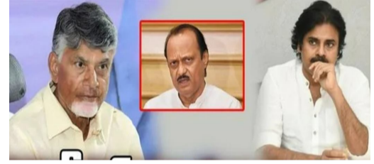
మహారాష్ట్ర రాజకీయాల్లో అజిత్ పవార్ మృతి తీరని లోటని సీఎం చంద్రబాబు వ్యాఖ్యానించారు. అజిత్ పవార్ మృతిపై పవన్ కళ్యాణ్ సంతాపం. మహారాష్ట్ర ఉప ముఖ్యమంత్రి, ఎన్టీసీ అధ్యక్షుడు, ఎన్టీసీ కూటమి నాయకులైన అజిత్ దాదా పవార్ ఈరోజు జరిగిన ఘోర విమాన ప్రమాదంలో మరణించారనే విషాద వార్త విని తాను తీవ్ర దిగ్భ్రాంతికి గురయ్యానని ఆంధ్రప్రదేశ్ సీఎం ఉప ముఖ్యమంత్రి పవన్ కళ్యాణ్ తెలిపారు. ఈ మేరకు పట్ల విచారం వ్యక్తం చేశారు. ఆయన చేసిన అంకితభావంతో కూడిన ప్రజాసేవ, మహారాష్ట్ర ప్రజల సంక్షేమం, అభివృద్ధికి అందించిన అపారమైన సేవలు ఎల్లప్పుడూ గుర్తుండిపోయాయి పేర్కొన్నారు. ప్రజల పట్ల అజిత్ పవార్ కున్న నిరంతర నిబద్ధతను గౌరవంతో స్మరించుకుంటారని తెలిపారు. ఆయన మరణంపట్ల నేను ప్రగాఢ సంతాపం వ్యక్తం చేస్తున్నానని అన్నారు. ఈ తీవ్ర దుఃఖ సమయంలో అజిత్ పవార్? కుటుంబ సభ్యులకు, అభిమానులకు, పార్టీ కార్యకర్తలకు తన ప్రగాఢ సానుభూతిని తెలియజేస్తున్నానని పవన్ కళ్యాణ్ పేర్కొన్నారు. అజిత్ పవార్

అమరావతి, జనవరి 28 : మహారాష్ట్ర ఉప ముఖ్యమంత్రి అజిత్ పవార్ (66) విమాన ప్రమాదంలో దుర్మరణం చెందడం దేశ రాజకీయాల్లో తీవ్ర విషాదాన్ని నింపింది. మహారాష్ట్ర రాజకీయంలో కీలక నేతగా ఉన్న అజిత్ పవార్ ప్రయాణిస్తున్న విమానం బుధవారం ఉదయం ప్రమాదానికి గురైంది. ఈ ఘటనలో అజిత్ పవార్ సహా మొత్తం ఐదుగురు ప్రాణాలు కోల్పోయారు. ఈ ఘోర ప్రమాదంపై ఆంధ్రప్రదేశ్ సీఎం నారా చంద్రబాబు నాయుడు (తీవ్ర దిగ్భ్రాంతి వ్యక్తం చేశారు. ఈ మేరకు ఆయన సోషల్ మీడియా వేదికగా అజిత్ పవార్ మృతి పట్ల విచారం వ్యక్తం చేశారు. అజిత్ పవార్ మృతిపై సీఎం చంద్రబాబు సంతాపం. ఉదయం విమాన ప్రమాదంలో మహారాష్ట్ర ఉప ముఖ్య మంత్రి అజిత్ పవార్ హఠాత్తుగా మరణించడం సన్ను దిగ్భ్రాంతికి గురిచేసింది. తీవ్ర బాధకు గురిచేసింది. ఆయన కుటుంబ సభ్యులు, స్నేహితులు, అనుచరులకు నా హృదయపూర్వక సానుభూతిని తెలియజేస్తున్నాను" అని సీఎం చంద్రబాబు అందులో పేర్కొన్నారు. అజిత్ పవార్ మృతిపై కేబినెట్ సంతాపం. విమాన ప్రమాదంలో మహారాష్ట్ర ఉప ముఖ్యమంత్రి అజిత్ పవార్ మృతిపై ఏపీ కేబినెట్ సంతాపం వ్యక్తం చేసింది. మంత్రి మండలి సమావేశం ప్రాంతం సమయంలో అజిత్ పవార్ విమాన ప్రమాద ఘటనను ముఖ్యమంత్రి చంద్రబాబు ప్రస్తావించారు. ప్రమాదంలో అజిత్ పవార్ మహారాష్ట్ర ఉప ముఖ్యమంత్రి అజిత్ పవార్ విచారం వ్యక్తం చేశారు. అజిత్ పవార్?తో తనకు ఉన్న పరిచయాన్ని సీఎం గుర్తు చేసుకున్నారు. ముంబై నుంచి బారామతి వెళ్తుండగా జరిగిన విమాన ప్రమాదంలో అజిత్ పవార్ మరణంతో దిగ్భ్రాంతికి లోనయ్యానని తెలిపారు.