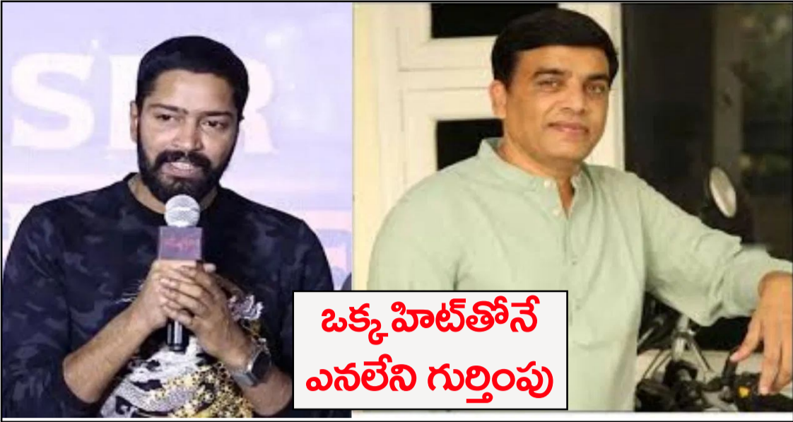
ఒక్క హిట్ తోనే ఎనలేని గుర్తింపు