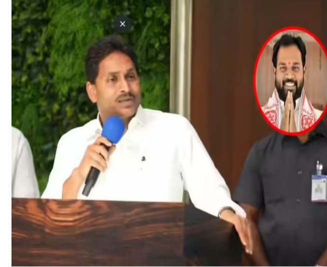
వచ్చి సుమారుగా రెండేళ్లు అవుతోందన్న జగన్. ఈ రెండేళ్లలో ప్రజలకు ఒక్క మంచైనా జరిగిందా అని ప్రశ్నించారు. తమ హయాంలో ఎన్నికల మేనిఫెస్టోను పవిత్ర గ్రంథంగా భావించామని.. ప్రతి సెలా ప్రజలను అడుకున్నామన్నారు. ప్రతి హామీని నిలబెట్టుకున్నామని.. ప్రభుత్వ సమస్యలన్నీ ప్రజల సమస్యలకే