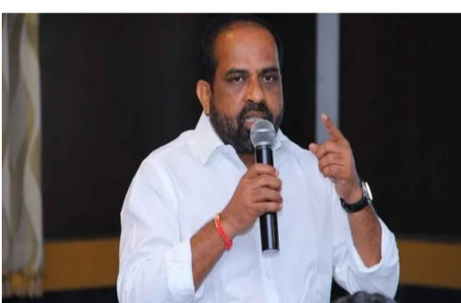
జగన్ రెడ్డి ఓ వ్యక్తిగత విషయాన్ని వైసీపీ భూతద్దంలో చూపిస్తోందని మంత్రి సత్యకుమార్ దుయ్యబట్టారు. 'వ్యక్తిగత విషయాలను కూటమి ప్రభుత్వానికి రుద్దే ప్రయత్నం వైసీపీ చేస్తోంది. జగన్ మాటలు చూసి ఆయన అవగాహన రాహిత్యంపై నమ్మకంలేదు. సొంత బాబాయ్ గొడవల పోటు వేసి గుండెపోటుగా నమ్మించాలని జగన్ చూశారు. సొంత చెల్లెలి మీదే తగ్గిన చంపిన కేసు మోపాలని చూశారు. ల్యాండ్ ట్రైలింగ్ యాక్ట్

ప్రకాశం, జనవరి 29: వైసీపీ అధినేత వైఎస్ జగన్ మోహన్ రెడ్డిపై పవీ మంత్రి సత్యకుమార్ తీవ్ర ఆగ్రహం వ్యక్తం చేశారు. జగన్ హయాంలో తిరుపతి లద్దాను కల్లీ చేశారని.. ఆ పాపం జగన్ అండ్ కోచేసిన ద్వజమెత్తారు. కోట్లాదిమంది భక్తులు ఆరాధించే తిరుపతి లద్దా తయారీకి కల్లీ నెయ్యి వాడారని సీట్ నివేదిక ఇచ్చిందని ప్రస్తావించారు. కెమికల్స్ ఉపయోగించి లద్దా తయారు చేశారని ఆగ్రహించారు. రూ. 250 కోట్ల అవినీతి చేసిన వాళ్లని జైలుకు పంపితే దాన్ని రెడ్ డెంట్ రాజ్యాంగం అని ఎలా మాట్లాడుతున్నారని ప్రశ్నించారు. రప్పా రప్పా అన్న వాళ్లని వదిలేయాలి. ప్రకాశం జిల్లాలో మంత్రి సత్యకుమార్ గురువారం పర్యటించి, పలు కార్యక్రమాల్లో పాల్గొన్నారు. ఈ సందర్భంగా మంత్రి సత్యకుమార్ మీడియాతో మాట్లాడారు. తప్పు చేసిన వాళ్లని వదిలేయండి, రప్పా రప్పా అన్న వాళ్లని వదిలేయండి, తలలు ఎగరేసిన నరుకుతామనే వాళ్లని ఉపేక్షించాలనేలా జగన్ మాట్లాడుతున్నారని ఫైర్ అయ్యారు. సీఎం చంద్రబాబు, డిప్యూటీ సీఎం పవన్ కల్యాణ్, ప్రధానమంత్రి నరేంద్రమోదీ పలన ప్రజలకు అభివృద్ధి సంక్షేమ ఫలాలు అందుతున్నాయని స్పష్టం చేశారు. జగన్ మాటలు నమ్మకంలేవని.. ఇద్దరు వ్యక్తుల మధ్య