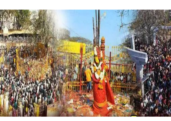
లు చెల్లిస్తారు. అలాగే కేంద్ర బౌద్ధ గురుల శాఖ మంత్రి జి.కిషన్ ఉన్నతాధికారులతో సమీక్ష నిర్వహించారు.

ములుగు, జనవరి 29 : ఆసియాలోనే అతి పెద్ద జాతరైన మేడారంలో వరుసగా కీలక ఘట్టాలు చోటు చేసుకుంటున్నాయి. సారాంశం బుధవారం గద్దెపైకి చేరుకోగా.. నేడు సమృద్ధి గద్దెపైకి రానున్నారు. ఇందుకోసం చిలకలగుట్ట నుంచి సమృద్ధి గద్దెపైకి రానున్నారు. ఈ నేపథ్యంలో భక్తజనం పులకించడం.. సమృద్ధి రాకతో ఈ జాతర పరిపూర్ణం కానుంది. గురువారం ఆర్రాత్రి నుంచి వనదేవతలకు భక్తులు మొక్కులు చెల్లించుకోనున్నారు. మరోవైపు ఇప్పటికే ఈ జాతర సందర్భంగా మేడారం భక్తులతో కిక్కిరిసిపోయింది. పలువురు ప్రముఖులు.. జాతర సందర్భంగా రాష్ట్ర డిప్యూటీ సీఎం మల్లు భట్టి విక్రమార్కు.. గురువారం మేడారం విచ్చేయనున్నారు. మధ్యాహ్నం 2:00 గంటలకు ఆయన హెలికాప్టర్ ద్వారా అక్కడికి చేరుకోనున్నారు. ఈ జాతర ఏర్పాట్లు, భక్తుల కోసం సౌకర్యాలను ఆయన పరిశీలిస్తారు. ఆనంతరం వనదేవతలను డిప్యూటీ సీఎం భట్టి దర్శించుకుని.. మొక్కు