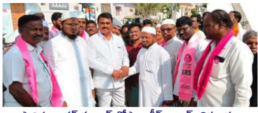
సాధుమూబారక్, రంజాన్ తోఫా, బిల్లీన్ ఇనామ్ విన్నూక్తి వధకాలు.