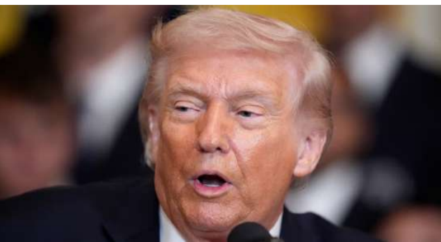
ఇదిలా ఉండగా, ఎఫ్ టీఎన్ కేసుకు సంబంధించిన పైక్షను డొనాల్డ్ ట్రంప్ ప్రభుత్వం ఎలా నిర్వహిస్తోందన్న అంశంపై అమెరికాలో రాజకీయంగా తీవ్ర చర్చ జరుగుతోంది.

కూడా పేర్కొన్నట్లు పత్రాల్లో సమాచారం ఉంది. ఆ ఘటన తర్వాత ఈ విషయాన్ని ఎవరికి చెప్పాడని తనకు మరెవరినూ తన కుటుంబ సభ్యులకు తెలియించాడని ఆమె చెప్పినట్లు వెల్లడైంది.