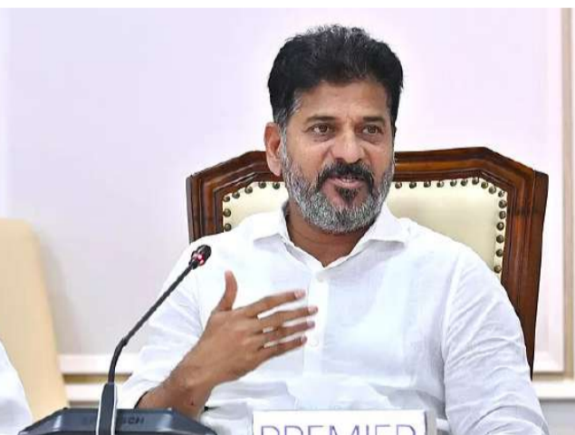
సుప్రీం కోర్టు ఆరోపణలు తర్వాత.. వర్గీకరణ కోసం ప్రకటన చేసిన తొలి రాష్ట్రం తెలంగాణను ఈ సందర్భంగా గుర్తు చేశారు. తమ ప్రభుత్వానికి ట్రాన్స్ అంబాసిడర్లు ప్రభుత్వ ఉద్యోగులైన పేర్కొన్నారు. ప్రజా ప్రభుత్వం వచ్చిన తర్వాత అనేక

వివరించారు. తమది పేదల పక్షపాత ప్రభుత్వమని సీఎం రేవంత్ రెడ్డి అభివృద్ధించారు. గత పాలకులు ఎన్నో అక్రమాల చేశారని సీఎం రేవంత్ విమర్శించారు.