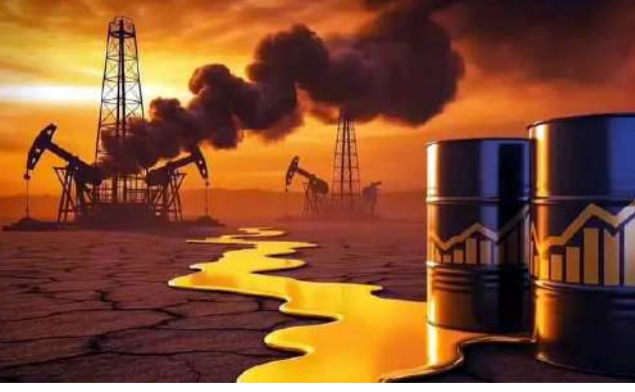
సరఫరాదారు అయిన ఖతార్ పరిస్థితి మరింత ఆందోళనకరంగా మారింది. ఖతార్ లోని అతిపెద్దైన రాన్ లిఫ్టాన్ ఎల్ఎన్జీ ప్లాంట్ పై ఇరాన్ ద్రోహ్ దాడి చేసింది. ఈ దాడి కారణంగా జరిగిన పశ్చిమ ఖతార్ ఎన్ఎన్ఐ ఇంకా అంచనా వేస్తోంది. మరమ్మతులు పూర్తి కావడానికి

మధ్యప్రాచ్యంలో కొనసాగుతున్న యుద్ధం ప్రపంచ ఆర్థిక వ్యవస్థను కోలుకోలేని దెబ్బ తీసేలా కనిపిస్తోంది. గల్ఫ్ దేశాల నుండి చమురు సరఫరా నిలిచిపోతే, అంతర్జాతీయ మార్కెట్లో ముడి చమురు ధర బ్యాంకెట్ 150 డాలర్లు(భారతీయ కరెన్సీలో సుమారు రూ.13783)కు చేరుకోవచ్చని ఖతార్ ఇంధన శాఖ మంత్రి సాద్ అల్-కాబీ హెచ్చరించారు.