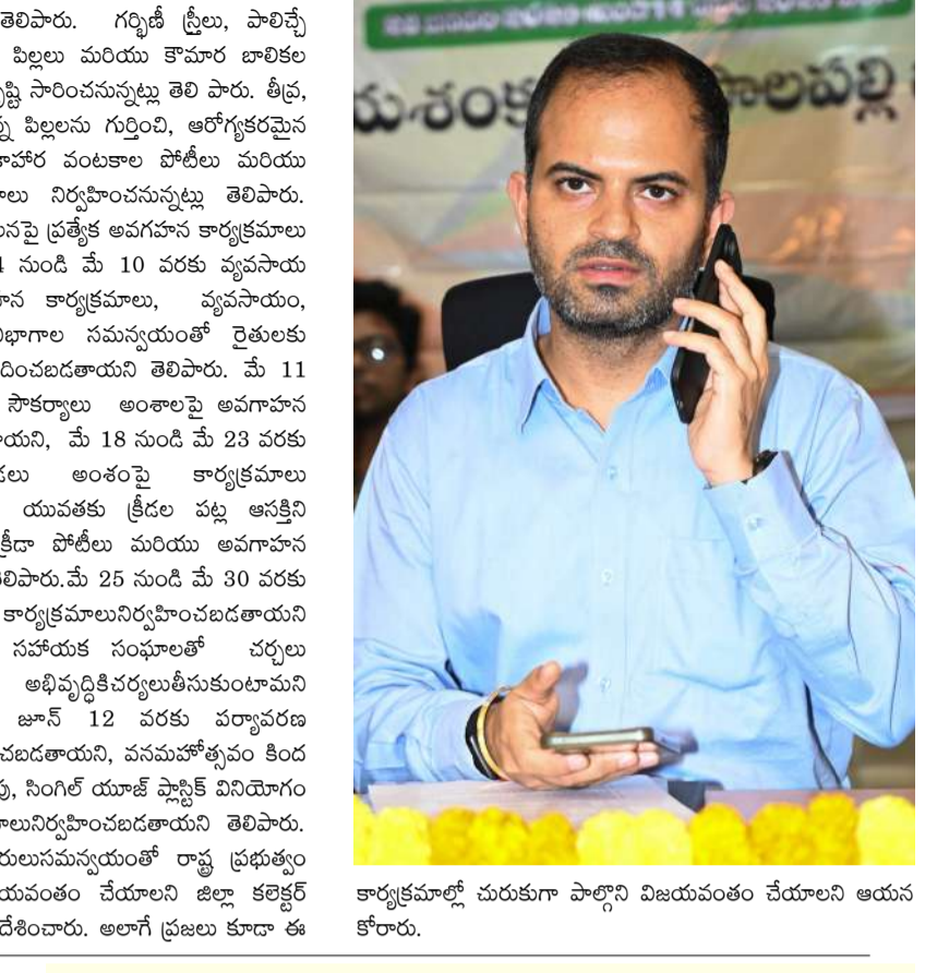
కార్యక్రమాల్లో చురుకూ పాల్గొని విజయవంతం చేయాలని ఆయన కోరారు.

జిల్లా కలెక్టర్ రాహుల్ శర్మ : వివేక, జయశంకర్ భూపాలపల్లి ప్రతినధి : జిల్లాలో సమగ్ర అభివృద్ధి మరియు ప్రజల భాగస్వామ్యాన్ని పెంపొందించేందుకు ప్రభుత్వం చేపట్టిన 99 రోజుల ప్రజాపాలన-ప్రగతి ప్రణాళిక కార్యక్రమాలు నిర్వహించిన షెడ్యూల్ ప్రకారం నిర్వహించాలని జిల్లా కలెక్టర్ రాహుల్ శర్మ అధికారులను ఆదేశించారు. ఈ కార్యక్రమాలు వివిధ విభాగాల సమన్వయంతో నిర్వహించబడతాయని ఆయన తెలిపారు. ఈ కార్యక్రమాలలో భాగంగా ప్రతి శాఖకు సంబంధించి నోడల్ విభాగాలు, నోడల్ అధికారులు నియమించబడినట్లు ఆయన పేర్కొన్నారు. మార్చి 6 నుండి మార్చి 15, 2026 వరకు శుభ్రత మరియు క్షేత్ర క్షయనెస్స్ కార్యక్రమాలు నిర్వహించబడతాయని తెలిపారు. ఈ కార్యక్రమానికి మున్సిపల్, పంచాయతీ రాజ్, ఇతర ప్రభుత్వ విభాగాలు నోడల్ విభాగాలుగా పనిచేస్తాయని అన్నారు. ఏప్రిల్ 6 నుండి ఏప్రిల్ 11 వరకు రోడ్డు భద్రత అనే ధీమీ తో రోడ్డు భద్రతపై అవగాహన కార్యక్రమాలు నిర్వహించబడతాయని తెలిపారు. రక్షణాత్మక డ్రైవింగ్ ప్రచారాలు, రోడ్డు భద్రత ప్రతిజ్ఞ డ్రైవ్లు, గ్రామ రోడ్డు భద్రత కమిటీల ఏర్పాటు, సమావేశంపై కార్యక్రమాలు చేపట్టబడతాయని తెలిపారు. అలాగే ఓ.ఆర్.ఆర్., హైవేలపై భారీ వాహనాల అసభికార పార్కింగు నిబంధన చర్యలు తీసుకోవాలని తెలిపారు. ఏప్రిల్ 13 నుండి ఏప్రిల్ 18 వరకు మహిళలు మరియు పిల్లల భద్రతపై ప్రత్యేక అవగాహన కార్యక్రమాలు నిర్వహించబడతాయని తెలిపారు. మహిళలు, పిల్లలపై జరిగే నేరాలను నివారించేందుకు చర్యలు, అవగాహన సదస్సులు నిర్వహించున్నట్లు తెలిపారు. ఏప్రిల్ 20 నుండి ఏప్రిల్ 26 వరకు సంక్షేమ కార్యక్రమాలు నిర్వహించబడతాయని, ఈ కార్యక్రమాల్లో ఎస్సీ, ఎస్టీ, బిసి, మైనారిటీ, గృహనిర్మాణ శాఖలు భాగస్వామ్యం అవుతాయన్నారు. ఏప్రిల్ 27 నుండి మే 2 వరకు మహిళలు మరియు పిల్లల పోషణ అంశంపై