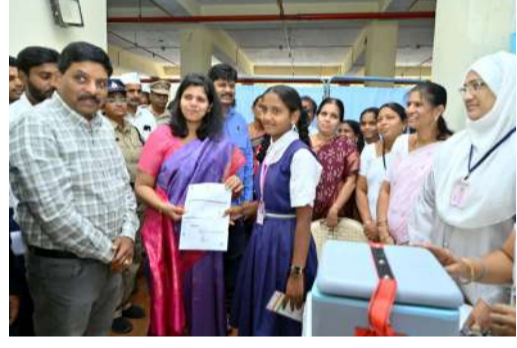
ప్రభుత్వం ప్రస్తుతం ఉచితంగా ఈ వ్యాక్సిన్ ను అందిస్తోందని తెలిపారు. జీజీహెచ్ తో పాటు జిల్లాలోని డిప్యూటీ, ధర్మలి, నవీపేట్, వర్ని, మోర్రాట్, బాల్కొండ, అర్రూర్ కమ్యూనిటీ హెల్త్ సెంటర్లలో కూడా ఈ వ్యాక్సిన్ ఇవ్వడం జరుగుతుందని సూచించారు. వ్యాక్సిన్ వేయించుకున్న వారు సర్టిఫికేట్ తీసుకోవాలని, తెలంగాణ ప్రభుత్వం త్వరలోనే అందుబాటులోకి తేసుస్తూ హెల్త్ ప్రొఫైల్ కోసం ఈ సర్టిఫికేట్ ఉపయోగపడుతుందని అన్నారు. కాగా, వ్యాక్సిన్ తీసుకున్న వారిలో శారీరక బలహీనత వల్ల కొంతమందికి అలసట, జ్వరం వంటి లక్షణాలు కనిపించవచ్చని, అంతమౌత్రాన భయపడకుండా