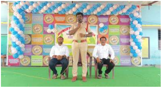
విశేష ఇబ్రంతకుంట్ల : మహిళలు మనోధైర్యంతో ముందుకు సాగాలని ఎన్నెన్ని సినిమాలతో ఆకాశం సర్వం మామిడి రాజులు పేర్కొన్నారు. మండల కేంద్రంలోని వాణి నికేట్ హై స్కూల్ లో

అధికారం అంతర్జాతీయ మహిళా దినోత్సవ వేడుకలు జరిగాయి. ఈ సందర్భంగా వారు మాట్లాడుతూ మహిళలు విద్యావంతులు అయినప్పుడే కుటుంబాలు అభివృద్ధి చెందుతాయి అన్నారు. ఆకాశంలో, అవనిలో సగభాగమైన మహిళలను ప్రతి ఒక్కరూ గౌరవించాలన్నారు. ప్రభుత్వాల కల్పిస్తున్న సౌకర్యాలను మహిళలు సద్వినియోగ పరుచుకోవాలన్నారు. జిల్లా కలెక్టర్ మొదలుకొని రాష్ట్రపతి వరకు నేడు దేశంలో మహిళలు ఉన్నత స్థానంలో ఉన్నారు. అందరూ రెండు చేతులతో పని చేస్తే నేడు మహిళలు అరు చేతులతో పనిచేస్తూ ఆదిపరాశక్తిగా గుర్తింపు పొందారన్నారు. మహిళలపై ప్రభుత్వాలకు నమ్మకం బాగా ఏర్పడడం వల్లే ఎంత కావాలన్నా మహిళా సంఘాలకు రుణాలు ఇస్తున్నాయన్నారు. శాస్త్ర సాంకేతిక రంగాలలో పాటు క్రిడలలోను