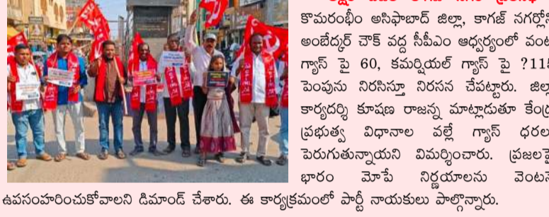
అక్షర విశేష కాగళ్ల నగర్ ప్రతినిధి : కొమరంభీం అసిఫాబాద్ జిల్లా, కాగళ్ల నగర్లోని అంజెయిర్ల చౌకీ వద్ద సీపీఎం ఆధ్వర్యంలో వంట గ్యాస్ పై 60, కమర్షియల్ గ్యాస్ పై 115 పెంపును నిరసిస్తూ నిరసన చేపట్టారు. జిల్లా కార్యదర్శి కూడా రాజుల రాజుల మాట్లాడుతూ ఆంద్ర ప్రభుత్వ విధానాల వల్లే గ్యాస్ ధరలు పెరుగుతున్నాయని విమర్శించారు. ప్రజలపై భారం మోపే నిర్ణయాలను వెంటనే ఉపసంహరించుకోవాలని డిమాండ్ చేశారు. ఈ కార్యక్రమంలో పాల్గొన్న నాయకులు పాల్గొన్నారు.