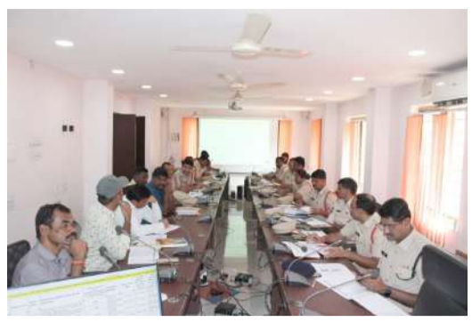
, అంతరి జిల్లా సరిహద్దు చెక్ పోస్ట్ లను పక్కనుండిగా నిర్వహించాలని సూచించారు. సంబంధిత పోలీసు సిబ్బంది ఆయా ప్రదేశాలపై నిఘా ఉంచి, ముందస్తు సమాచారాన్ని సేకరించి, ప్రశాంత వాతావరణంలో ఎన్నికలు నిర్వహించేందుకు కృషి చేయాలని అధికారులకు తెలియజేశారు. ఎన్నికల రోజు నిబంధనలను నిజామాబాద్ కమిషనర్ తమకు కేటాయింబి నిఘావలది పోలింగ్ బాతు లో సక్రమమైన విధులు నిర్వహించాలని, ఎన్నికల తర్వాత ఓట్ల లెక్కింపు కార్యక్రమం మొత్తం పూర్తి అయ్యే వరకు ఎవరూ ఎలాంటి ప్రలోభాలకు గురి కావద్దని, అన్ని రకాల జాగ్రత్తలు తీసుకోవాలని విధినిర్వహణలో ఎలాంటి లోపాలు