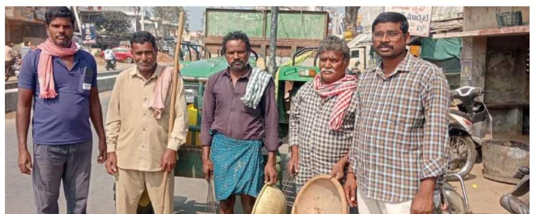
గ్రామపంచాయతీ కార్మికులకు ఇచ్చిన హామీలను వెంటనే అమలు చేయాలని డిమాండ్ చేశారు. కార్మికులకు ప్రతిబింబ మొదటి వారంలో వేతనాలు చెల్లించకపోతే సమైక్యంగా పదతామని ఈ సందర్భంలో బెసిఫిట్ కల్పించాలని డిమాండ్ చేశారు. రాష్ట్ర ప్రభుత్వం కార్మికుల జీతాలు పెంచకుండా నిర్ణయం వైఖరి వహిస్తుందని కార్మికులు కుటుంబాలు పెరిగిన ధరలకు అప్పుల పాలవుతున్నారని ఆవేదన వ్యక్తం చేశారు. గ్రామపంచాయతీ కార్మికులను ప్రభుత్వ ఉద్యోగులుగా