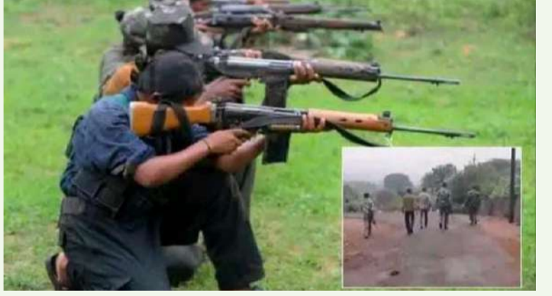
విశేష అదిలాబాద్ ప్రతినిధి:- కొమరంట్లం అసిఫాబాద్ జిల్లా అటవీ ప్రాంతాల్లో మావోయిస్టుల కదలికలు కలకలం రేపుతున్నాయి మహారాష్ట్రలోని గద్చిరోలి నుంచి ఓ మావోయిస్టు దళం జిల్లాలోకి ప్రవేశించినట్లు నిఘా వర్గాల సమాచారం దీంతో పోలీసులు గ్రేవార్డ్స్ బలగాలు అసిఫాబాద్ తిర్రాణి వండలాల సరిహద్దు అటవీ ప్రాంతాల్లో గాలింపు చేపట్టాయి డోర్-సంగడిమాదారం అటవీ ప్రాంతంలో మావోయిస్టులకు సంబంధించిన కిట్ బ్యాగులు సామాగ్రిని గుర్తించారు అనుమతులకు కనిపిస్తే సమాచారం ఇవ్వాలని సహకరించవద్దని పోలీసులు ప్రజలను కోరుతున్నారు