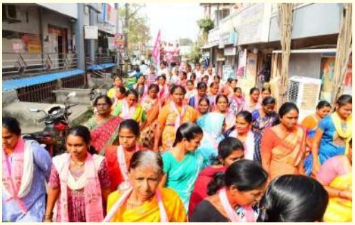
ఇచ్చిన హామీలు నెరవేర్చి మధిర ప్రజలను భద్ర పట్టు అడగాలి. కాంగ్రెస్ ఇచ్చిన గ్యారంటీ కార్యకర్తలకు రెండున్నర ఏళ్లు అయినా అమలు కాలేదు.