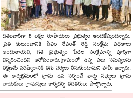
దశలవారిగా 5 లక్ష రూపాయలు ప్రభుత్వం అందజేస్తుందన్నారు. ప్రతి కుటుంబానికి సీఎం రేషన్ కార్డు సక్రమ వధకాలు అందుతాయని, గత ప్రభుత్వం పేదల సంక్షేమాన్ని పూర్తిగా విస్మరించిందని ఆరోపించారు. గ్రామంలో ఉన్న పలు సమస్యలను తక్షణమే పరిష్కారానికి తగిన చర్యలు తీసుకుంటామని హామీ ఇచ్చారు. ఈ కార్యక్రమంలో గ్రామ ఉప సర్పంచ్ వార్షి సభ్యులు గ్రామ నాయకులు గ్రామస్తులు కార్యదర్శి తదితరులు పాల్గొన్నారు.

అంతయు గూడెం అధునాతన భవనాన్ని నిర్మిస్తున్నట్లు తెలిపారు. గ్రామానికి కావాల్సిన కనీస అవసరాలైన రోడ్లు డ్రైనేజీలు ప్రభుత్వ కార్యాలయాల నిర్మాణానికి ప్రభుత్వం కట్టుబడి ఉందని వారు పేర్కొన్నారు. ప్రభుత్వ వధకాలు ప్రజలకు అందేలా చూడటంలో గ్రామ పంచాయతీల పాత్ర కీలకమని, కొత్త భవనం అందుబాటులోకి వస్తే పాలన మరింత సులభతరం అవుతుందని ఆశాభావం వ్యక్తం చేశారు. ప్రతి పేద కుటుంబానికి రేషన్ షాపుల ద్వారా సన్న బియ్యం పంపిణీ చేస్తున్న ఘనత కాంగ్రెస్ ప్రభుత్వానికి దక్కుతుందన్నారు. గ్రామంలో మౌలిక వసతులు ఇండ్లు లేని ప్రతి నిరుపేద కుటుంబానికి ఇందిరమ్మ ఇండ్లను మంజూరు చేస్తుందన్నారు. మంజూరైన లబ్ధిదారులు ఎంతో ఇంటి నిర్మాణం చేపడతే