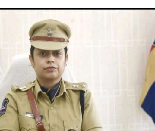
వ్యక్తులను ఇప్పటికే బెండింగ్ చేసినట్లు సమాప్తాత్మక పోలింగ్ కేంద్రాలపై ప్రత్యేక నిఘా ఉంటుందని అన్నారు ఎన్నికల ప్రశాంత శాసనసభలోని నిఘావ్యవస్థలకు జరిగేందుకు ప్రజలు పోలీసులకు సహకారం అందించాలని ఏవైనా అసమానాస్పద వ్యక్తులు లేదా సంఘటనలు కనిపించిన వెంటనే పోలీసులకు సమాచారం ఇవ్వాలని ఎస్పీ కోరారు

కట్టుదిట్టమైన భద్రత చర్యలు తీసుకుంటున్నట్లు తెలిపారు ఈ ఎన్నికల కోసం పోలీస్ ఇతర శాఖల నుండి మొత్తం 712 మందిని నియమించి పటిష్ట బందోబస్తు ఏర్పాటు చేసినట్లు ఎస్పీ తెలిపారు సోమవారం సాయంత్రం 5 గంటల నుండి ఎన్నికలు పూర్తయ్యే వరకు జిల్లాలో 163 బి.ఎన్.ఎస్.ఎస్ 144 సెక్షన్ అమల్లో ఉంటుందని పోలింగ్ కేంద్రాల పరిసరాల్లో 100 మీటర్ల పరిధిలో బదుగురు లేదా ఆ పైగా వ్యక్తులు గుంపులు గుమికూడదని తెలిపారు పోలింగ్ కు 48 గంటల ముందు నుండి ఏ విధమైన ప్రచార కార్యక్రమాలూ ర్యాలీలు సమావేశాలు నిర్వహించడం పూర్తిగా నిషేధం ఎన్నికల ఫలితాలు అనంతరం ఎలాంటి విజయోత్సవ ర్యాలీలకు లైట్ ర్యాలీలకు అనుమతి లేదని ఎన్నికల పూర్తయిన అనంతరం సంబంధిత అధికారులు నిర్దేశించిన తేదీలలో మాత్రమే విజయోత్సవ సంబంధాలు నిర్వహించుకోవచ్చు అని తెలిపారు రెండు మున్సిపాలిటీ పరిధిలో 2 స్టాటిక్ సర్ప్రైజ్స్ ఎస్ ఎస్ టి టీములు 2 ఫ్లయింగ్ స్క్వాడ్ టీములు ఎఫ్ ఎస్ టి లు నిరంతరం పనిచేస్తున్నాయని అన్నారు గత ఎన్నికల్లో శాంతిభద్రతలకు విఘాతం కలిగించిన