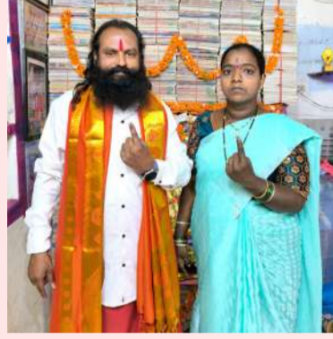
వజ్రాయుధం అన్నారు. అమీనీ పరులను ఓటుకోనే కొట్టాలన్నారు.