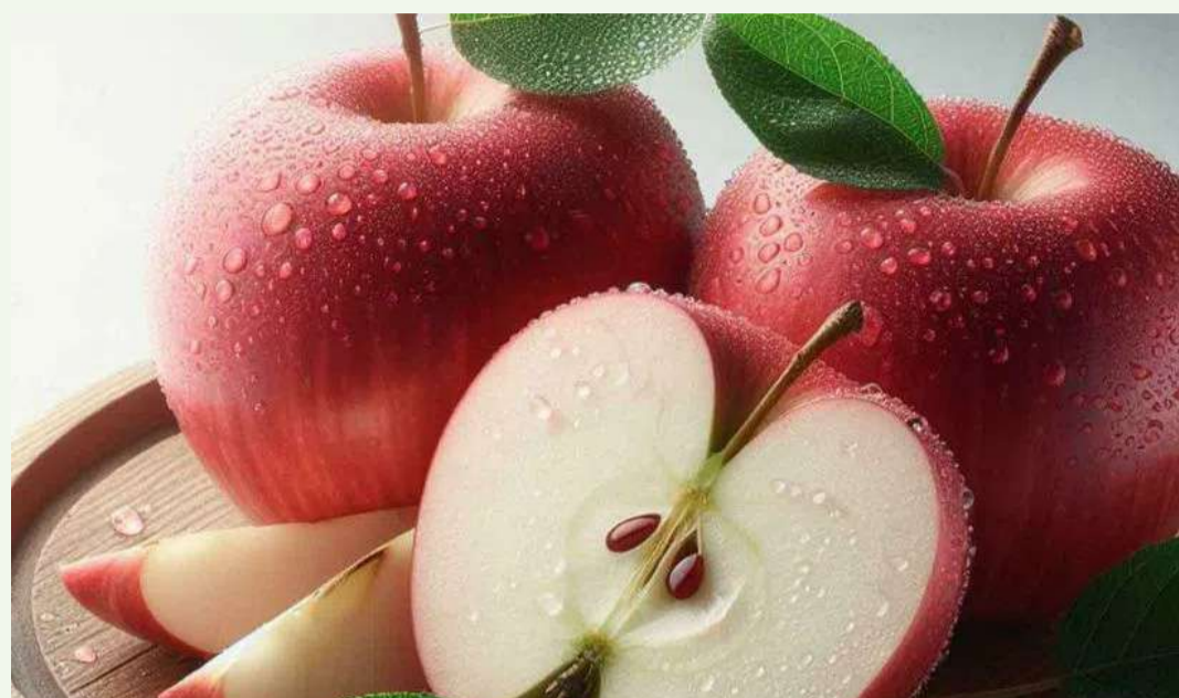
తక్కువగా తింటారు. ఇది బరువు తగ్గడంకు సహాయం చేస్తుంది.

యాపిల్ పండ్ల మనకు ఏదాది పొడవునా అన్ని సీజన్లలోనూ అందుబాటులో ఉంటాయి. యాపిల్ పండ్లలోనూ అనేక రకాలు ఉంటాయి. మనకు మన దేశంలో పండే యాపిల్స్ పాటు విదేశీ యాపిల్స్ కూడా అందుబాటులో ఉంటున్నాయి. అయితే యాపిల్ పండ్లను రోజు తినడం వల్ల ఎన్నో అద్భుతమైన లాభాలు కలుగుతాయని పోషకాహార నిపుణులు, వైద్యులు చెబుతుంటారు. రోజుకు యాపిల్ పండ్లను తింటే డాక్టర్ వద్దకు వెళ్ళాల్సిన అవసరమే ఉండదని అంటుంటారు. అయితే యాపిల్ పండ్లను నిజంగా రోజుకు ఒక్కటే తినాలా..? ఎక్కువ తినకూడదా..? యాపిల్ పండ్లలో ఉండే పోషకాలు ఏమిటి..? వీటి వల్ల మనకు ఎలాంటి లాభాలు కలుగుతాయి..? అని చాలా మందికి సందేహాలు వస్తుంటాయి. ఈ క్రమంలోనే వీటికి నిపుణులు ఏమని సమాధానాలు చెబుతున్నారో ఇప్పుడు తెలుసుకుందాం.