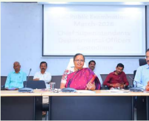
విజేత, సిబ్బంది ప్రతినిధి : సిబ్బంది మంగళవారం సమీకృత జిల్లా కార్యాలయ సముదాయంలోని సమావేశ మందిరంలో పదవ తరగతి పరీక్షలు - 2026 నిర్వహణ గురించి చీఫ్ సూపరిండెంట్లు, డిప్యూటీ సూపరిండెంట్లు, కన్స్టేబుల్స్ అధికారులతో జిల్లా కలెక్టర్ సమావేశం నిర్వహించారు.

జిల్లాలో మార్చి 14 వ తేదీ నుండి ఏప్రిల్ 16 వ తేదీ వరకు 82 సెంటర్ లో పదవ తరగతి పరీక్షలు నిర్వహిస్తున్నట్లు జిల్లాలో మొత్తం 15358 విద్యార్థులు అందులో బాలురు 7700, బాలికలు 7637, తో పాటు ప్రవేశ విద్యార్థులు 21 పరీక్ష రాయనున్నారు. నిర్వహణ కోసం చీఫ్ సూపరిండెంట్ 82, డిప్యూటీ ఆఫీసర్ లు 82, కన్స్టేబుల్స్ ఆఫీసర్ లు 9 నియమించినట్లు తెలిపారు. 82 కేంద్రాల్లో వాచ్ రూమ్స్ క్లీనింగ్, డ్రింకింగ్ వాటర్ సౌకర్యం, సెంటర్ లో ఏఎస్ఎం మెడికల్ శిబిరం ఏర్పాటు చేస్తున్నట్లు తెలిపారు. చీఫ్ సూపరిండెంట్లు మీరు విధులు నిర్వహించే సెంటర్ లో అన్ని వసతులు ఉన్నాయని చెక్ చేసుకోవాలని సీసీ కెమెరాలు తప్పనిసరి, అన్ని గదుల్లో వెలుతురు వచ్చేలా ట్యూబ్ లైట్లు అమర్చుకోవాలని, పర్సనల్ కొరత లేకుండా చూసుకోవాలని తెలిపారు. గ్రామీణ ప్రాంతాల్లో నుండి సెంటర్ వచ్చేందుకు బస్సు సౌకర్యం కల్పించి పరీక్ష సమయానికి గంట ముందే సెంటర్ కి చేర్చేలా చర్యలు తీసుకోవాలని ఆఫీస్ అధికారులను ఆదేశించారు. ఏ సెంటర్ లో సైతం మాలే ప్రాక్టీస్ జరగకుండా పగళ్ళుంటే ఏర్పాటు చెయ్యాలని తెలిపారు. సెంటర్ పరీక్ష నిర్వహించే పూర్తి బాధ్యత చీఫ్ సూపరిండెంట్ మాత్రమే