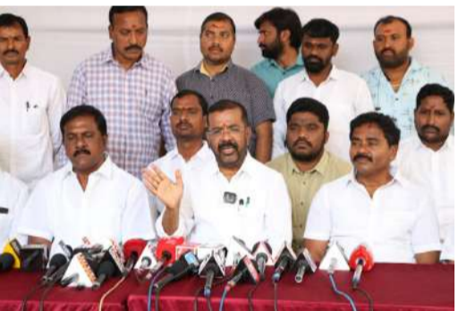
అభివృద్ధి పనుల్లో తూర్పు..