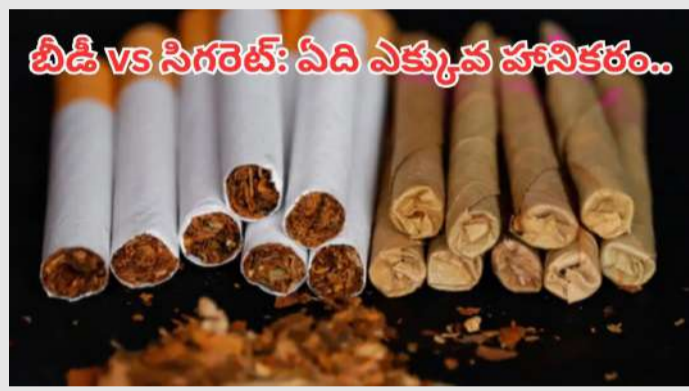
బీడీ vs సిగరెట్: ఏది ఎక్కువ హానికరం..

బీడీ సిగరెట్ల మధ్య తేడా సిగరెట్లలో పాగాకుతో పాటు వివిధ రసాయనాలు, ఫిల్టర్లు ఉంటాయి, అయితే బీడీలలో బెండు అత్యులే చుట్టడిన పాగాకు ఉంటుంది. సిగరెట్లలో ఫిల్టర్లు ఉంటాయి, కానీ బీడీలలో ఉండవు. బీడీలోని బెండు అత్యు కాలినప్పుడు, పాగు మందంగా మారుతుంది. అందుకే ధూమపానం చేసే వ్యక్తి ఎక్కువ పాగును పీల్చుకుంటాడు.. ఇది మరింత ప్రమాదకరం..