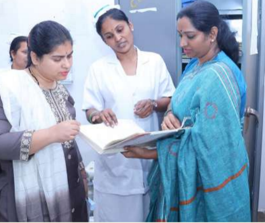
పరిష్కార దిశగా కృషి చేస్తామని ఎంపీ హామీ ఇచ్చారు. ఆసుపత్రి వీరనరాల్లో పరిశుభ్రతను మెరుగుపరచడంలో పాటు జంగల్ కిరీంరెస్ట్ చేపట్టే అక్షరమే శుభ్రపరిచే చర్యలు చేపట్టాలని ఆధికారులను ఆదేశించారు. ప్రజలకు మెరుగైన వైద్య సేవలు అందేలా అన్ని విభాగాలు సమన్వయంతో పనిచేయాలని ఎంపీ డాక్టర్ కడియం కావ్య సూచించారు.