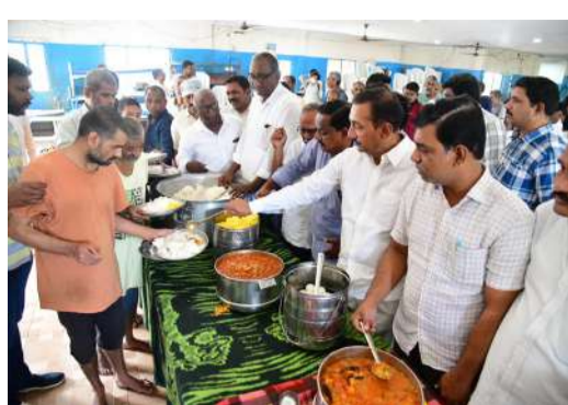
ప్రజల పక్షాన పనిచేసే వాళ్ళు ఎప్పుడీకీ బిరస్టరసీయర్లే

వర్ధంతి సభలో సీపీఐ ఎంఎల్ మాన్ లైన్ రాష్ట్ర కార్యదర్శి పోటు రంగారావు