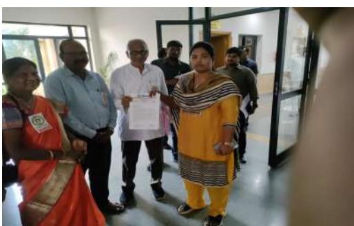
పెన్ననర్ల మరణాలను నిలువరించండి