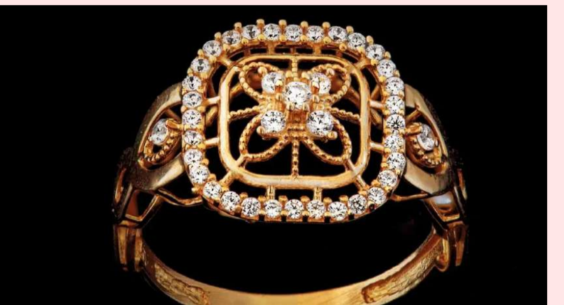
చట్టం 2016 ప్రకారం హాల్మార్కింగ్ ఉద్దేశ్యం వినియోగదారులకు స్పష్టతను హామీ ఇస్తుంది. ఇప్పుడు 9 క్యారెట్ల బంగారాన్ని చేర్చడంలో చౌకైన అభరణాలను కొనుగోలు చేసే వారికి కూడా నాణ్యతకు హామీ లభిస్తుంది

9 క్యారెట్ల హాల్మార్కింగ్ నిర్ణయం వినియోగదారులకు చౌకగా, అధునాతన డిజైన్లను అందుబాటులోకి తీసుకురావడానికి సహాయపడుతుందని మార్కెట్ నిపుణులు అంటున్నారు. ఇది వజ్రం, రత్నాల అభరణాలను మరింత సరసమైనదిగా చేస్తుంది. భారతదేశ ఎగుమతులను కూడా పెంచుతుంది. బంగారు గడియారాలు, పెన్నులు.. బంగారానికి మన దేశంలో మహిళలు అత్యంత ప్రాధాన్యత ఇస్తుంటారు. అయితే బంగారు అభరణాలు కొనుగోలు చేసే ముందు హాల్ మార్క్లను గమనించడం తప్పనిసరి. ఇప్పుడు 9 క్యారెట్ల బంగారం కూడా హాల్మార్కింగ్ పరిధిలోకి వచ్చింది. బ్యూరో ఆఫ్ ఇండియన్ స్టాండర్డ్స్ జూలై 2025 నుండి తప్పనిసరి హాల్మార్కింగ్ జారీతో 9 క్యారెట్ల అంటే 375 పాయింట్ల చక్కని బంగారాన్ని చేర్చింది. ఇది వినియోగదారులకు మరింత పారదర్శకతను ఇస్తుంది. చౌకైన ఎంపికలలో కూడా నాణ్యతకు హామీ ఇస్తుంది. ఇప్పటివరకు 24% గ్రేడ్ల వరకు బంగారంపై హాల్మార్కింగ్ వర్తింపేది. %డిమా% సవరణ తర్వాత ఈ జారీతో 9% కూడా చేర్చింది. 9 క్యారెట్ల హాల్మార్కింగ్ నిర్ణయం వినియోగదారులకు చౌకగా, అధునాతన డిజైన్లను అందుబాటులోకి తీసుకురావడానికి సహాయపడుతుందని మార్కెట్ నిపుణులు అంటున్నారు. ఇది వజ్రం, రత్నాల అభరణాలను మరింత సరసమైనదిగా చేస్తుంది. భారతదేశ ఎగుమతులను కూడా పెంచుతుంది. బంగారు గడియారాలు, పెన్నులు ఇకపై 'కళాఖండాల' వర్గంలోకి రావని %డిమా% సవరణ స్పష్టం చేస్తుంది. అదే సమయంలో 24% లేదా 24% బంగారు నాణ్యతను మింట్ లేదా రిఫైనరీ నుండి మాత్రమే జారీ చేయవచ్చు. అయితే వాటికి చట్టబద్ధమైన కర్ఫీ విలువ లేదు.