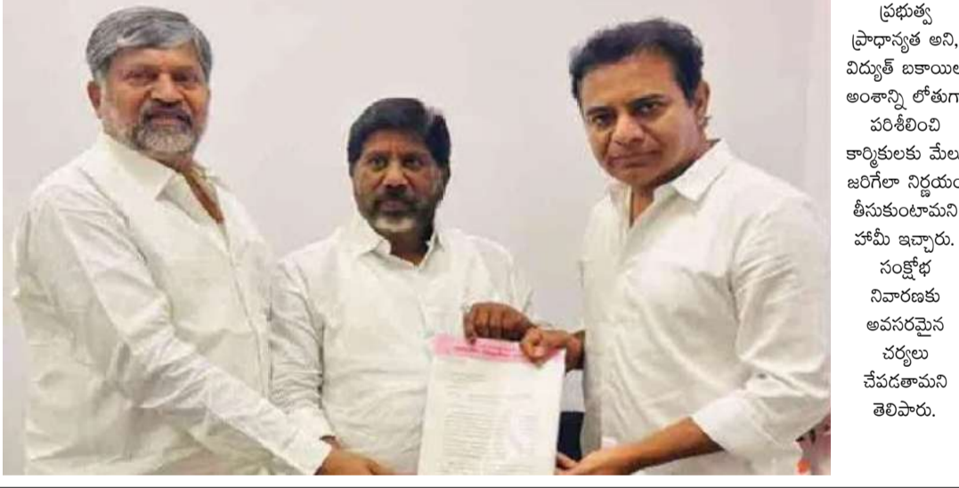
ప్రభుత్వ ప్రాధాన్యత అని, విద్యుత్ బకాయిలు అంశాన్ని లోతుగా పరిశీలించి కార్యకలకు మేలు జరిగేలా నిర్ణయం తీసుకుంటామని హామీ ఇచ్చారు. సంక్షోభ నివారణకు అవసరమైన చర్యలు చేపడతామని తెలిపారు.

నిరిసిల్ల వల్ల పరిశ్రమను పట్టిపీడిస్తున్న సంక్షోభం నుంచి నేతస్థులను గట్టిపెట్టేందుకు బీఆర్ఎస్ వర్గం ప్రసిడెంట్ కేటీఆర్ చొరవ తీసుకున్నారు. ఈరోజు సచివాలయంలో డిప్యూటీ సీఎం భట్టి విక్రమార్కును కలిసిన ఆయన, నిరిసిల్ల నియోజకవర్గంలోని పవర్ లూమ్ పరిశ్రమ ఎదుర్కొంటున్న ఆర్థిక ఇబ్బందులను వివరించారు. రాజకీయాలకు అతీతంగా జరిగిన ఈ భేటీ అందరినీ ఆకట్టుకుంటోంది. నిరిసిల్ల వల్ల పరిశ్రమపై ఉన్న సుమారు రూ. 38 కోట్ల విద్యుత్ బకాయిలు, పేరుకుపోయిన బ్యాంక్ బిల్లింగ్, సర్వీసలను తక్షణమే మాఫీ చేయాలని కేటీఆర్ ఈ సందర్భంగా డిప్యూటీ సీఎంను కోరారు. గత ప్రభుత్వ హయాంలో ఉన్న విధంగానే పరిశ్రమకు నిరంతర విద్యుత్ సప్లీ ప్రయోజనాలు అందేలా చూడాలని, పాత బకాయిలతో సంబంధం లేకుండా నేతస్థులకు వెలుగుబాటు కల్పించాలని విన్నవించారు. పరిశ్రమ సంక్షోభంలో ఉండటంతో నేతస్థులు మాఫీ అత్యున్నతల బాట పట్టే ప్రమాదం ఉందని, వారికి తక్షణమే భరోసా ఇవ్వాలని అవసరం ఉందని కేటీఆర్ తెలిపారు. కేటీఆర్ వివరించిన సమస్యలపై డిప్యూటీ సీఎం భట్టి విక్రమార్కు సానుకూలంగా స్పందించారు. నేతస్థుల సంక్షేమం