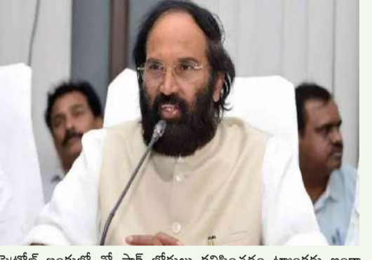
పెట్రోల్ బంకుల్లో నో స్టాక్ బోర్డులు కనిపించడం ట్యాంకర్లు ఇంకా చేరుకోవడంవల్లనే, నిజమైన కొరత కారణంగా కాదని ఉత్తమ కుమార్ రెడ్డి స్పష్టం చేశారు. చాలాచోట్ల ప్రజలు భయంతో ముందు జాగ్రత్త కోసమని క్యాన్సల్, కంటెయిన్మెంట్ పెట్రోల్, డీజిల్ తీసుకొచ్చేందుకు మంత్రి స్పందించారు. ఇలా క్యాన్సల్ తీసుకొచ్చడం చట్టవిరుద్ధమని, అలా చేసినవారిపై చర్యలు తీసుకుంటామని హెచ్చరించారు. హైదరాబాద్ పరిధిలో 596 పెట్రోల్ బంకులు

హైదరాబాద్ లో మంగళవారం క్యాన్సల్ బంకులు పెట్రోల్ లేక మూసివేయడంతో జనం ఆందోళనకు గురయ్యారు. దీంతో సాయంత్రం నుంచి బంకుల ముందు క్యూ కట్టారు. ఉదయం నుంచి ఇదే పరిస్థితి కనిపించడం, డీనికీ తోడు పలు బంకులు మూతపడటంతో ఉత్తమ స్పందించారు. 60 రోజులకు సరిహద్దు పెట్రోలు నిల్వలు ఉన్నాయి : తెలంగాణలో పెట్రోల్, డీజిల్, ఎల్పీజి కోరత లేదని ఉత్తమ కుమార్ రెడ్డి స్పష్టం చేశారు. రాష్ట్రంలో వచ్చే 2 నెలలకు సరిహద్దు ఇంధన నిల్వలు అందుబాటులో ఉన్నాయని అన్నారు. ఈరోజు డిమాండ్ 17,246 కిలోలీటర్లు కాగా, 17,898 కిలోలీటర్లు సరఫరా చేయడం జరిగిందని తెలిపారు. సోషల్ మీడియాలో జరిగిన ప్రచారం కారణంగా డిమాండ్ 25 శాతం పెరిగినప్పటికీ, సరఫరా సగటుగా 22 శాతం అధికంగా కొనసాగుతోందని, అదనంగా 16,000 కిలోలీటర్ల బస్టర్ స్టాక్ సిద్ధం చేశామని, 1,200 అదనపు ట్యాంకర్లను రంగంలోకి దించామని పేర్కొన్నారు. ఏ బంకునూ మూసివేయడానికి అనుమతించం : క్యాన్సల్