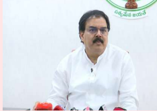
ఎక్కడా పెట్రోల్, డీజిల్ కొరత లేదని మంత్రి స్పష్టం చేశారు 'సిలిండర్ల ట్యాక్ మార్కెటింగ్ నివారణకు ప్రత్యేక తనిఖీలు నిర్వహిస్తున్నాం. ఇప్పటికే సిలిండర్ల అక్రమాలపై 800 కేసులు

5 లక్షల టన్నుల అవుతున్నాయని, సోషల్ మీడియాలో వచ్చే తప్పుడు వార్తలు నమ్ముద్దని ప్రజలకు సూచించారు. పైప్లైన్ గ్యాస్ కనెక్టివిటీ: వాణిజ్య అవసరాలకు ఇచ్చే గ్యాస్ సరఫరాను కేంద్రం 10 నుంచి 20 శాతం పెంచినదని మంత్రి వెల్లడించారు. వాణిజ్య సిలిండర్లు వాడేవారు అందోళన చెందాల్సిన అవసరం లేదన్నారు. రెస్టారెంట్లు, విద్యాసంస్థలకు సరఫరా పెంచేలా చర్యలు తీసుకుంటామని హామీ ఇచ్చారు. పట్టణాల్లోని ప్రజలు పైప్లైన్ గ్యాస్ కోసం సమాచార చేసుకోవచ్చని తెలిపారు. రాష్ట్రంలో ఇప్పటికే 2.34 లక్షల మంది పైప్లైన్ గ్యాస్ వినియోగించుకుంటున్నారన్న మంత్రి, పట్టణ ప్రాంతాలకు దీని కనెక్టివిటీ అందుబాటులో ఉందని పునరుద్ఘాటించారు. పట్టణాల్లో పైప్లైన్ గ్యాస్ ఇంటింటికీ తరలింపునకు మద్దిచ్చి పులులు చేయాలి ఉండవచ్చు. సోలార్, ఇండక్షన్ కుకింగ్ స్టావెలను వినియోగించేలా చర్యలు తీసుకుంటామన్నారు. రాష్ట్రంలో