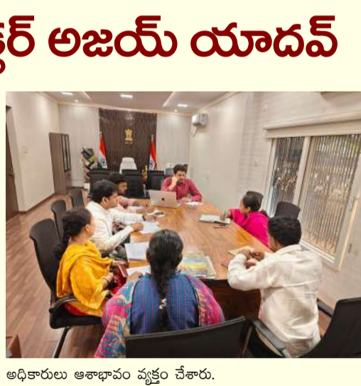
అధికారులు ఆశాభావం వ్యక్తం చేశారు.