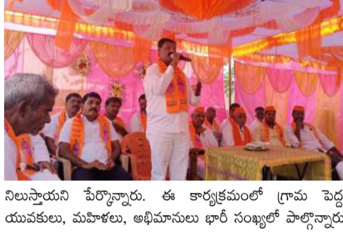
ప్రతి ఒక్కరూ జీవితంలో ఆచరించాల్సినవి సూచించారు. ఇటువంటి విగ్రహ ప్రతిష్ఠాపన కార్యక్రమాలు భవిష్యత్ తరాలకు మార్గదర్శకంగా