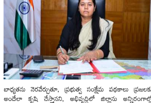
ముందుంచేందుకు కృషి చేస్తానన్నారు. ఇంటర్, పదో తరగతి పరీక్షల గురించి డీఈఓ, ఇంటర్ డిఓఓ ను పూర్తి వివరాలు అడిగి తెలుసుకున్నారు.