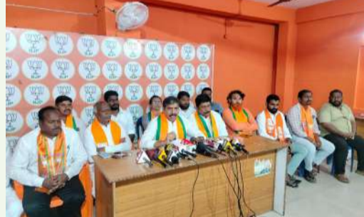
ప్రభుత్వాల వరకు ఏ ఒక్కరూ పేదలకు పంచాలనే కనీస ఆలోచన చేయలేదని విమర్శించారు. దాతల ఆశయాలకు గండికొడుతూ, ఇప్పుడు ఆ భూములను అక్రమించి, పేదలను గెంధివేసి, బదా బాబుల విలాసాల కోసం ఖమ్మంలో 'జూబ్లీహిల్స్' తరహా కాలనీలను నిర్మించాలని మంత్రులు కలలు కంటున్నారని ఎద్దేవా చేశారు.