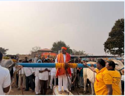
ఎర్ర బండ పోటీలను ప్రారంభించిన శ్రీరాములు