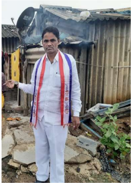
జాతీయ జనీ సంక్షేమ సంఘం షేడ్ నికరటర్ డాక్టర్.