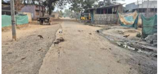
కోనేళ్లు గా కనీస నిర్వహణ లేక, బీటి రోడ్డు మరమ్మతులకు నోచుకోలేదు.