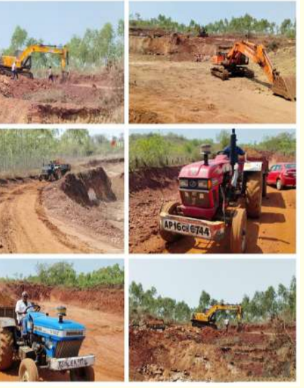
ఇమిటి అనే ప్రశ్నలు తలెత్తుతున్నాయి. ప్రభుత్వ అధికారులు ఇప్పటికైనా మట్టి మాఫియాను నియంత్రించడానికి చర్యలు తీసుకోవాలని, ప్రకృతి సహజ సిద్ధమైన సంపదను కాపాడాలని ప్రజలు డిమాండ్ చేస్తున్నారు.

ఇంత జరుగుతున్నా మట్టి మాఫియా మట్టి అక్రమ త్రవ్వకాలు జరిపి సొమ్ము చేసుకుంటుంటే పోలీసులు కానీ రెవెన్యూ అధికారులు కానీ అటువైపు కన్నెత్తి చూడటం లేదు. వేంసూరు మండల పరిధిలో మట్టి త్రవ్వకాలు జరిపి అక్రమార్కులు పట్టపగలే సొమ్ము చేసుకుంటున్నారని అనే విషయం రెవెన్యూ అధికారులకు తెలుసా? తెలియదా? లేక తెలిసి మౌనంగా ఉంటున్నారా? ముందుపట్టి భారీ స్థాయిలో పుచ్చుకుని అక్రమార్కుల ఆగదాలను చూసేచూడనట్లు ఉంటున్నారని అని గునగునలాడుకుంటున్నారు. సహజ వనరుల దోపిడీ ప్రకృతి సహజ సిద్ధమైన గుట్టలను మట్టి మాఫియా మింగేస్తుంటే ప్రభుత్వ యంత్రాంగం చోద్యం చూడడం ప్రజల్లో పలు అసహనాలకు తావిస్తుంది. ఇదంతా అధికారుల కనుసన్నల్లోనే జరుగుతుందని లేకపోతే మట్టి మాఫియా ఇలా పట్టపగలే మట్టి త్రవ్వకాలు జరిపి సొమ్ము చేసుకోవడం చర్చించుకుంటున్నారు. మట్టి అధికంగా పడి వరదలు వచ్చినప్పుడు పంట పొలాలు చేలకు అందగా ఉండే గుట్టలను మట్టి మాఫియా త్రవ్వకుని సొమ్ము చేసుకుంటున్నారు. అక్రమార్కులు కాసులకు కక్కుర్తిపడి ఎవరి ఇష్టం వచ్చినట్లు వాళ్ళు సహజ సిద్ధమైన సంపదను కొల్లగొడుతూ సొమ్ము చేసుకుంటుంటే ప్రభుత్వ యంత్రాంగం చోద్యం చూస్తూ కూర్చోవడం