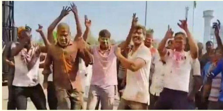
విజేత, జయశంకర్ భూపాలపల్లి ప్రతినిధి : జయశంకర్ భూపాలపల్లి జిల్లా కేంద్రంలో మంగళవారం జరిగిన హోలీ పండుగ సందర్భంగా జరిగిన వేడుకలలో పోలీస్ సిబ్బందితో పాటు భూపాలపల్లి ఎస్సీ సిరికెల్ల సంకీర్త పాల్గొని హోలీ ఆడుతూ నిబ్బంది చేస్తున్న నృత్యాలతో సంతోషించి తాను కూడా నృత్యాలు చేస్తూ అందరినీ ఆశ్చర్యం పరిచే విధంగా నృత్యం చేయడం నృత్యంతో మంతవృద్ధులు అయ్యారు. అనంతరం నిబ్బందిని ఎంత గానో మైమరిపించే విధంగా హోలీ శుభాకాంక్షలు తెలియజేశారు.