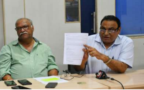
హెచ్.సీఎస్ అధ్యక్షుడు అమర్త్యాద్రి విజేత, హైదరాబాద్ బ్యూరో : హైదరాబాద్ క్రికెట్ అసోసియేషన్ (హెచ్.సీఎస్) లో రూ.70 కోట్ల అవినీతి జరిగిందన్న ఆరోపణలను తీవ్రంగా ఖండిస్తూ హెచ్.సీఎస్ అధ్యక్షుడు అమర్త్యాద్రి