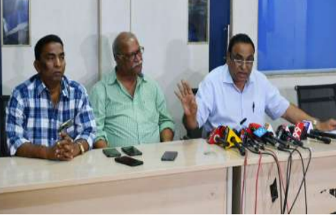
కోట్లు లేదా రూ.70 కోట్లు చెల్లించడంలో నా ప్రయోజనం లేదు, నేను ఛార్జ్ తీసుకునే ముందే ఆ ప్రక్రియ ప్రారంభమైందని స్పష్టం చేశారు. విశాఖ ఇండస్ట్రీస్ కు చెల్లింపులు కోర్టు ఆదేశాల మేరకే జరిగాయని ఆయన పేర్కొన్నారు. ఇదిలా ఉండగా, మంత్రి వివేక్ కు చెందిన విశాఖ ఇండస్ట్రీస్ కు రూ.70 కోట్లు అక్రమంగా విడుదల చేశారంటూ క్రికెట్ సంఘాలు ఆరోపించాయి. మంత్రి ఆదేశాల మేరకు హెచ్.సీఎస్ లో ఉన్న పెద్దలు ఈ మొత్తాన్ని విడుదల చేశారని వారు పేర్కొన్నారు. అయితే ఈ ఆరోపణలు అమర్త్యాద్రి కోట్టివేడేశారు.