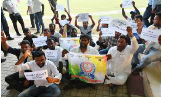
స్పందించారు. జింఖానా గ్రౌండ్ లో నిర్వహించిన ప్రెస్ మీట్ లో ఆయన మాట్లాడుతూ, నా పై వస్తున్న ఆరోపణలు పూర్తిగా అవాస్తవం, నేను బాధ్యులు స్వీకరించిన తర్వాత ఎలాంటి చెక్కులపై సంతకాలు చేయలేదు, హెచ్.సీఎస్ నుంచి విశాఖ కంపెనీకి రూ.69