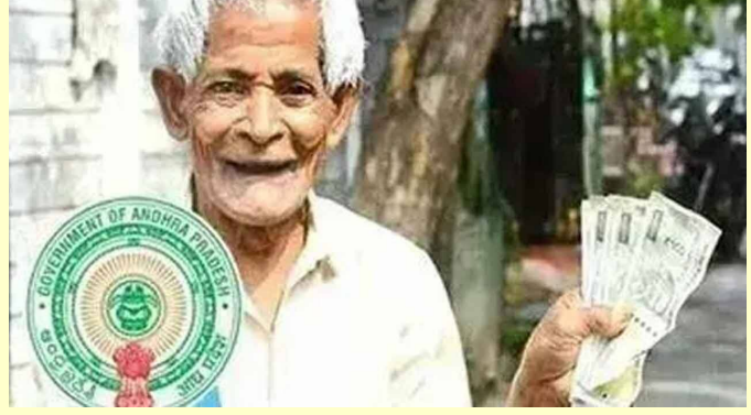
అమరావతి, ఫిబ్రవరి 28 (తెలుగురేఖ):

- విజయనగరంలో సిఎం చంద్రబాబు హాజరు - పాలకొల్లులో మంత్రి నిమ్మల పంపిణీ