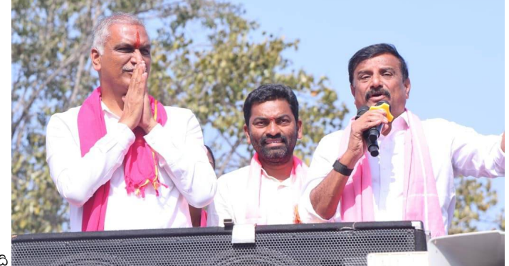
సిద్దిపేట, ఫిబ్రవరి 9 (తెలుగురేఖ):