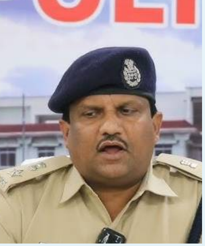
మెదక్, ఫిబ్రవరి 9 (తెలుగురేఖ):