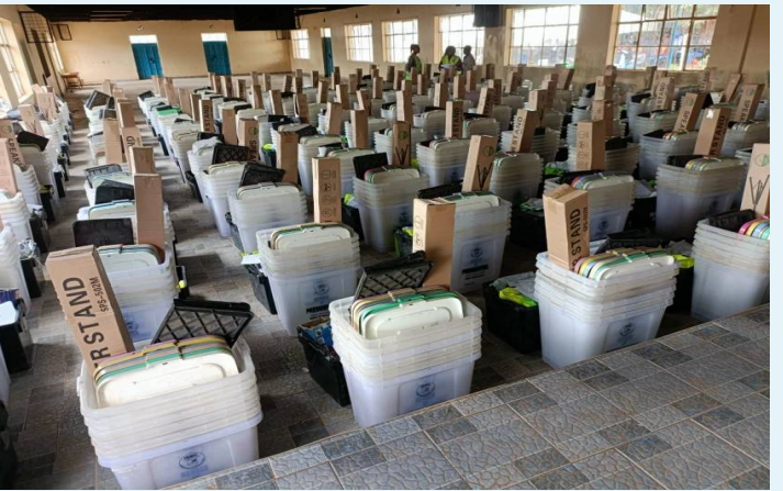
సిద్దిపేట, ఫిబ్రవరి 9 (తెలుగురేఖ):

- ఎన్నికల పక్కా నిర్వహించాలని కలెక్టర్ ఆదేశం