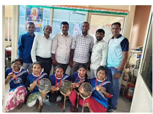
హనుమకొండ జిల్లా, ఫిబ్రవరి 9, తెలుగు రేఖ : హనుమకొండ జిల్లా లోని జే.ఎన్.ఎస్ గ్రాండ్ లో సీఎం కమ్ హనుమకొండ జిల్లా స్థాయి క్రీడోత్సవాలు సోమవారం రోజు ఉదయం ప్రారంభమయ్యాయి. ఈ క్రీడోత్సవాలలో బాల బ్యాడ్మింటన్ హనుమకొండ జిల్లా బాలికల ఛాంపియన్ విభాగంలో జాగృతి ఉమెన్స్ డిగ్రీ కాలేజ్ ఛీమర్లం