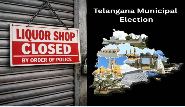
హైదరాబాద్, ఫిబ్రవరి 9 (తెలుగురేఖ):

మద్యం దుకాణాలకు మున్సిపల్ ఎన్నికల పోలింగ్ కాలం వచ్చే కొద్ది కాలం క్రితం ప్రకటన చేసింది. రెండు రోజుల వైస్ బండ్ కానున్నాయి. మున్సిపల్ ఎన్నికల సేవల్లో ఈ నిర్ణయం తీసుకున్నారు. మున్సిపల్ పోలింగ్ కు సమయం ఆసన్నమవుతోంది. ఫిబ్రవరి 11న పోలింగ్ జరగనుంది. 13 ఫలితాలు విడుదల కానున్నాయి. ఈ ఆయా మున్సిపాలిటీల పరిధిలోని మద్యం దుకాణాలు బండ్ కానున్నాయి. ఈనెల 9వ తేదీ నుంచి సాయంత్రం 5 గంటల నుంచి 11 వ తేదీ సాయంత్రం 5 గంటల వరకు మద్యం దుకాణాలను మూసివేయాలని ఎన్నికల, ఆటోమోటార్ శాఖ అధికారులు ఆదేశాలు జారీ చేశారు. అదే విధంగా 13వ తేదీ వరకు ఫలితాల సేవల్లో వైస్, బార్లు మూసివేయనున్నారు. మరోవైపు.. సోమవారంతో మున్సిపల్ ఎన్నికల ప్రచారానికి తెరపడింది. సాయంత్రానికి మైకులు మూగబోయాయి. గతానికి భిన్నంగా ఈసారి జరుగుతున్న మున్సిపల్ ఎన్నికల అధికార, ప్రతిపక్షాల మధ్య యుద్ధ వాతావరణాన్ని తలపించాయి. పూర్వోప, ప్రతి పూర్వోపతో రంగంలోకి దిగిన కాంగ్రెస్, బీఆర్ఎస్ పార్టీల నేతలు ఒకరిపై మరొకరు పై చేయి సాధించాలన్న పట్టుతో ప్రజాక్షేత్రంలో అడుగు పెట్టారు. కాంగ్రెస్, బీఆర్ఎస్, బీజేపీ నేతలతో పాటు ఆయా పార్టీల నుంచి రెబల్స్ గా పోటీ చేస్తున్న అభ్యర్థులు, ఇండిపెండెంట్ అభ్యర్థులు ప్రచారంలో మునిగి తేలారు. ర్యాలీలు, దర్శన చప్పుళ్లు, డీజే పాటల మోతలతో ప్రచారాన్ని హోరెత్తించారు. చివరి రోజు సుడిగాలి పర్వటనలకు నేతలు సిద్ధం అయ్యారు.