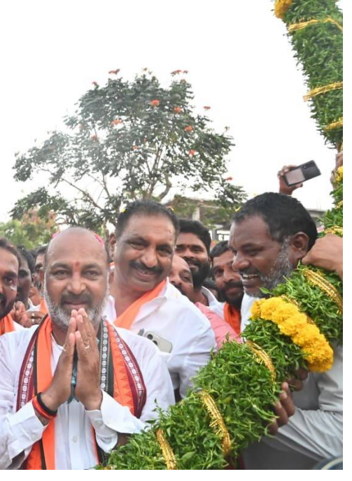
నుండి అంజన్ అశీర్వాద యాత్రను ప్రారంభిస్తున్న మీడియాతో మాట్లాడారు. అక్కడికి చేరుకున్న నూతనంగా ఎన్నికైన బీజేపీ సర్పంచులు 108 మంది, 450 మంది వార్డు సభ్యులు, 54 మంది కార్పొరేటర్లు, కౌన్సిలర్లతోపాటు వేలాది మంది కాషాయ శ్రేణులతో కలిసి కాలినడకన బయలుదేరారు.

రాజకీయాలకు అతీతంగా చేపట్టిన ఆధ్యాత్మిక యాత్ర కావడం... బండి సంజయ్ పాదయాత్రలో బూట్లు వేసుకోలేదు. సన్నిహితులు ఎంత ఒత్తిడి చేసినా బూట్లు వేసుకునేందుకు ససీమా అన్నారు. కేవలం సాకులతోనే నడక ఆరంభించారు. మంచుపెండలో తారు రోడ్డుపై చెప్పులు లేకుండా కొద్దిదూరం