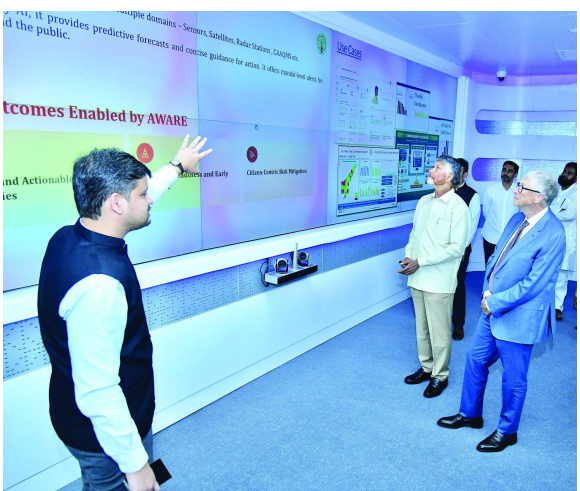
అంటూ బిల్ గేట్స్ కితాబిచ్చారు. ఆంధ్రప్రదేశ్ పర్యటనలో గవర్నెన్స్ ద్వారా పౌర సేవల్ని సులభతరం చేయడం ఉన్న బిల్ గేట్స్ ముఖ్యమంత్రి చంద్రబాబుతో కలిసి బాగుందని ఈ సందర్భంగా బిల్ గేట్స్

అమరావతి, ఫిబ్రవరి 16 తెలుగురేఖ: డేటా లేక్, వాట్సప్ గవర్నెన్స్ ద్వారా పౌర సేవల్ని సులభతరం చేయడం బాగుందని ఫౌండేషన్ వ్యవస్థాపక చైర్మన్ బిల్ గేట్స్ అభినందించారు. ఆంధ్రప్రదేశ్ అనుసరిస్తున్న విధానాలను పరిశీలించిన గేట్స్ చంద్రబాబును ప్రశంసించారు. రాజధానిలో 30 శాతం గ్రీన్ అండ్ బ్లూ ప్రణాళిక బాగుందంటూ బిల్ గేట్స్ వ్యాఖ్యానించారు. రాజధాని నిర్మాణ తీరును ముఖ్యమంత్రి చంద్రబాబు వివరించగా.. 'గ్రేట్ వర్క్