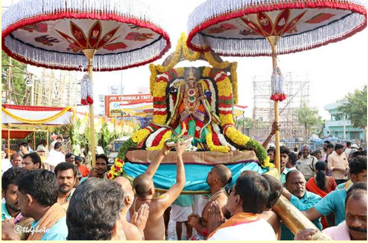
ఒంటిమిట్ట, ఏప్రిల్ 1 (తెలుగురేఖ):