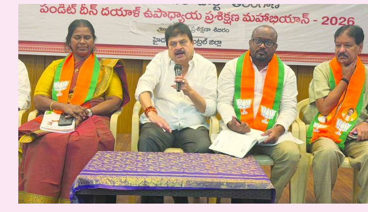
హైదరాబాద్, ఏప్రిల్ 1 తెలుగురేఖ: