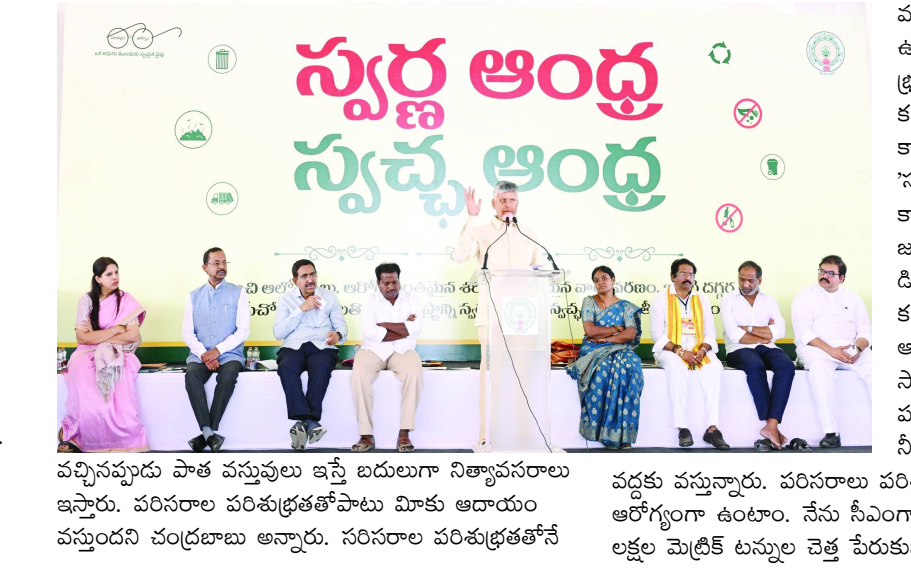
వచ్చినప్పుడు పాత వస్తువులు ఇస్తే బదులుగా నిత్యాసవరాలు ఇస్తారు. పరిసరాల పరిశుభ్రతతోపాటు మిక్సెడ్ వస్తువులను చంద్రబాబు అన్నారు. పరిసరాల పరిశుభ్రతతోనే వద్దకు వస్తున్నారు. పరిసరాల పరిశుభ్రంగా ఉంటే ఆరోగ్యంగా ఉంటాం. నేను సిఎంగా వచ్చేనాటికి 108 లక్షల మెట్రిక్ టన్నుల చెత్త పేరుకుపోయింది.

పల్నాడు, ఫిబ్రవరి 21 తెలుగురేఖ: గ్రామీణ ప్రాంతాల్లో మార్చి 31 నాటికి చెత్త సేకరించే బాధ్యత ప్రభుత్వానిదని సిఎం చంద్రబాబు అన్నారు. మండలానికి ఒక స్వచ్ఛరథం ఏర్పాటు చేస్తున్నామని, వారానికి ఒకసారి గ్రామానికి స్వచ్ఛరథం వస్తుందని చెప్పారు. పల్నాడు జిల్లా వినుకొండలో నిర్వహించిన 'స్వచ్ఛాంధ్ర-స్వచ్ఛాంధ్ర' కార్యక్రమానికి సిఎం హాజరయ్యారు. స్వచ్ఛరథాన్ని ప్రారంభించారు. ఈ సందర్భంగా దివ్యాంగులకు మూడు చక్రాల వాహనాలను అందజేశారు. ప్రజావేదిక వద్ద స్టాళ్లను పరిశీలించారు. స్వచ్ఛ రథం