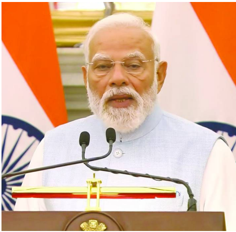
మెట్రోలో ప్రయాణించారు. తాజా ప్రారంభోత్సవంతో ధిల్లీలోని సారాయి కాలే భాస్ నుంచి మీరట్ లోని మోదీపురం వరకు ప్రయాణ సమయం కేవలం

న్యూఢిల్లీ, ఫిబ్రవరి 21 తెలుగురేఖ: ధిల్లీ, పశ్చిమ ఉత్తరప్రదేశ్ మధ్య ప్రయాణాన్ని సులభతరం చేస్తూ కేంద్ర ప్రభుత్వం మరో కీలక ముందడుగు వేసింది. ప్రధానమంత్రి నరేంద్ర మోదీ శనివారం మీరట్ లో పర్యటించి సుమారు రూ. 12,930 కోట్ల విలువైన అభివృద్ధి పనులకు శ్రీకారం చుట్టారు. ఈ పర్యటనలో భాగంగా 82 కిలోమీటర్ల పొడవైన ధిల్లీ-ఘజియాబాద్-మీరట్ 'నమో భారత్' రీజనల్ రాపిడ్ ట్రాన్సిట్ సిస్టమ్ యొక్క పూర్తిస్థాయిలో జాతికి అంకితం చేశారు. ఈ కార్యక్రమంలో భాగంగా ప్రధాని మోదీ 'మీరట్ మెట్రో' సేవలను కూడా జెండా ఊపి ప్రారంభించారు. అనంతరం శతాబ్ది నగర్ స్టేషన్ నుంచి మీరట్ సౌత్ స్టేషన్ వరకు