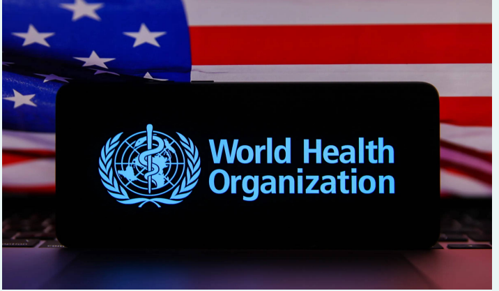
వాషింగ్టన్, జనవరి 23 (తెలుగురేఖ):

- డబ్ల్యూహెచ్ఎస్ఎంఐ వైద్యులను తప్పింపు ప్రకటన