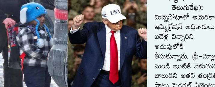
వాషింగ్టన్, జనవరి 23 (తెలుగురేఖ):

- ఐదేళ్ల చిన్నారుల అదుపులోకి తీసుకుని తరలింపు