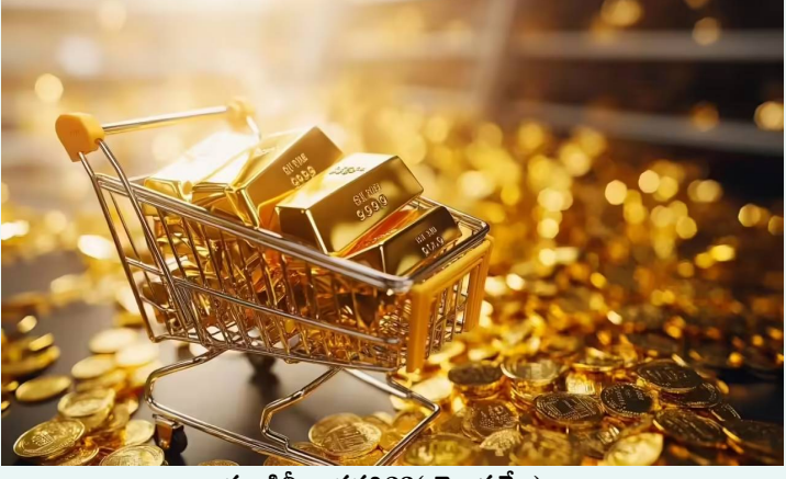
హ్యూస్టన్, జనవరి 23 (తెలుగురేఖ):

తగ్గినట్లే తగ్గిన బంగారం ధర మళ్ళీ పెరిగింది. రోజురోజుకూ కొత్త గరిష్టాలకు ధరలు ఎగబాకుతున్నాయి. గ్రీన్ లాండ్ పై అమెరికా అధ్యక్షుడు డొనాల్డ్ ట్రంప్ స్వయం ప్రకటన చేశ తర్వాత మళ్ళీ పనిని పనిని ధర మళ్ళీ పెరిగింది. డెన్వర్లో అధీనంలోని డివైసన్ బలప్రయోగం ద్వారా స్వాధీనం చేసుకోబోమని ట్రంప్ ప్రకటించడంతో.. గురువారం బంగారంలో లాభాల స్వీకరణ కనిపించింది. అయితే, అది ఒక్క రోజుకే పరిమితమైంది. ఇదానీ చుట్టూ అమెరికా బంగారు మోహరించడంతో మరోసారి అంతర్జాతీయంగా ఉద్రిక్త పరిస్థితులు నెలకొన్నాయి. దీంతో సురక్షిత పెట్టుబడి సాధనంగా భావించి మదుపర్లు బంగారం వైపు పెట్టుబడులను మళ్ళిస్తున్నారు. బంగారానికి పెరిగిన డిమాండ్ కారణంగా మళ్ళీ దీని ధర పెరిగింది. అంతర్జాతీయ వివేచిలో బంగారం ధర ఔస్టు 5 వేల డాలర్లకు చేరువైంది. ప్రస్తుతం 4,945 డాలర్ల వద్ద కొనసాగుతోంది. దీన్ని అనుసరించి దేశీయంగా బంగారం ధరలు మళ్ళీ పెరిగాయి. మధ్యాహ్నం ఒంటి గంట సమయంలో హైదరాబాద్ బయిరున్ మార్కెట్లో 10 గ్రాముల మెటెరియా పనిని రూ.1,59,954 పలుకుతోంది. గురువారంతో పోలిస్తే ఒక్క రోజులోనే పనిని రూ.5వేలు పెరిగింది. 22 క్యారెట్ల బంగారం ధర రూ.1.41 లక్షలు ఉంది. మరోవైపు అంతర్జాతీయ మార్కెట్లో వెండి ఔస్టు 98 డాలర్ల వద్ద కొనసాగుతుండగా.. హైదరాబాద్ కిలో వెండి రూ.3.25 లక్షలుగా ఉందని బయిరున్ వర్గాలు పేర్కొంటున్నాయి.