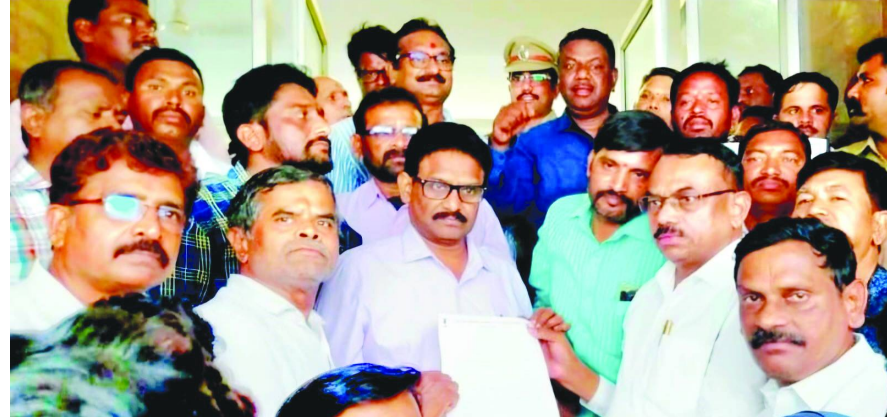
సందర్భంగా ప్రభుత్వ వివక్షకు వ్యతిరేకంగా జర్నలిస్టులు చేసిన నినాదాలతో సమాచార భవన్ దద్దరిల్లింది. ఈ సందర్భంగా తెలంగాణ వర్సింగ్ జర్నలిస్ట్స్ ఫెడరేషన్ వ్యవస్థాపక

రాష్ట్రవ్యాప్త జర్నలిస్టుల "ఫలో హైదరాబాద్" కార్యక్రమం పిలుపు మేరకు వివిధ జిల్లాల నుంచి పెద్ద సంఖ్యలో తరలి వచ్చిన జర్నలిస్టులు ప్రధాన రహదారిపై ర్యాలీ నిర్వహించారు. ఆనంతరం ఐఅండ్ పీఆర్ కార్యాలయం ఎదుట పెద్ద ఎత్తున నినాదాలు చేస్తూ నిరసన ప్రదర్శన జరిపారు. ఆనంతరం జర్నలిస్టులు ప్రధాన ప్రవేశ ద్వారం ముందు ఔరాయిన్నారు. ఈ