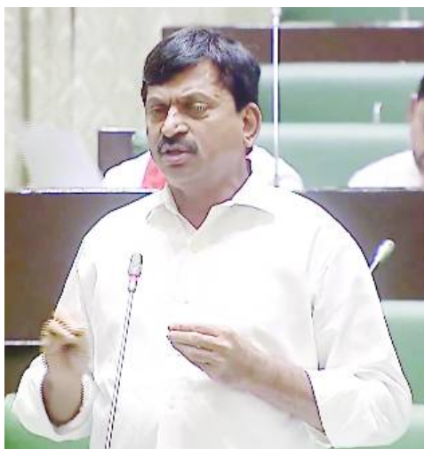
సమావేశాల్లో బుధవారం నాడు సుమారు 22 మంది శాసనసభ్యులు ఇందిరమ్మ ఇండ్లు, డబుల్ బెడ్ రూం ఇళ్ల తదితర అంశాలపై అడిగిన