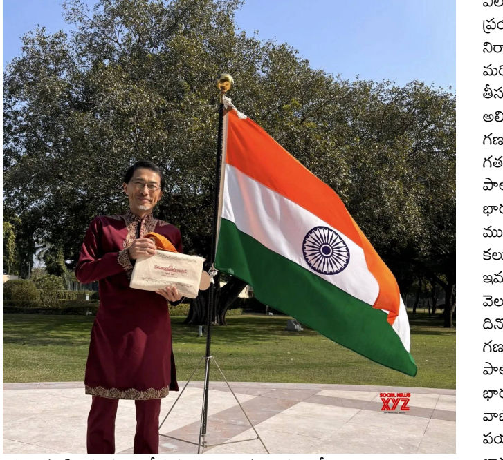
ప్రజలకు స్వాతంత్ర్య దినోత్సవ శుభాకాంక్షలు. న్యూఢిల్లీ

భారత్ 77వ గణతంత్ర దినోత్సవం సందర్భంగా ప్రపంచ దేశాల నుంచి శుభాకాంక్షల సందేశాలు వెల్లడవుతున్నాయి. చైనా, రష్యా, అమెరికా, ఫ్రాన్స్, ఈయూ, ఇరాన్, నేపాల్, ఆస్ట్రేలియా, భూటాన్ మొదలైన దేశాల నుంచి సందేశాలు అందాయి. భారత్ తో బంధాన్ని మరింత బలోపేతం చేసుకోవాలని ఈ సందర్భంగా అయో దేశాధినేతలు, మంత్రులు పేర్కొన్నారు. 'భారత్ ప్రజలకు గణతంత్ర దినోత్సవ శుభాకాంక్షలు. చైనా, భారత్ ఎప్పటికీ మంచి పొరుగువారిగా, స్నేహితులుగా ఉంటాయి. ఇందుకే మధ్య దౌత్య సంబంధాలను, సహకారాన్ని బలోపేతం చేసుకోవాలని ఎదురుచూస్తున్నట్లు చైనా అధ్యక్షుడు జిన్ పింగ్ సందేశమిచ్చారు. భారత్ ప్రజలకు గణతంత్ర దినోత్సవ శుభాకాంక్షలు. ప్రపంచంలో అతిపెద్ద ప్రజాస్వామ్య దేశం భారత్, ప్రపంచంలో పూతన ప్రజాస్వామ్య దేశం యూఎస్ఎల మధ్య చరిత్రాత్మక సంబంధం కొనసాగుతోంది. రక్షణ, ఇంధనం వంటి అభివృద్ధి చెందుతున్న రంగాల్లో భారత్ అమెరికా మధ్య సహకారం మంచి ఫలితాలను ఇస్తుందని ఆశిస్తున్నాం. రాఖోయే రోజుల్లో ఉమ్మడి లక్ష్యాలు ముందుకుతీసుకోవడంకు ఎదురుచూస్తున్నాం అమెరికా విదేశాంగ మంత్రి మార్కో రూబియో పేర్కొన్నారు. భారత్