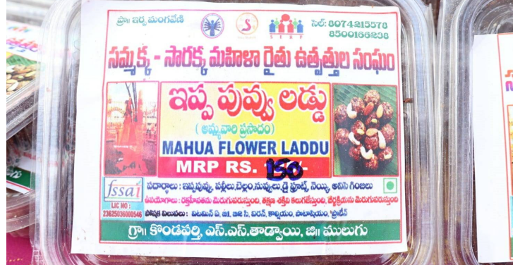
లడ్డు తినడం ద్వారా ఎంతో మేలు జరుగుతుందని కూడా చెప్పన్నారు. ఇందులో ఉండే ఫైబర్ విలువను ఖనిజాలు పోషకాలు గొట్టి స్త్రీలకు ఎంతగానో మేలు చేస్తుందని పుట్టబోయే బిడ్డ ఆరోగ్యకరంగా జన్మించారని చెప్పన్నారు. గిరిజన మహిళలకు ఆర్థిక భరోసా అందించడమే ప్రజా ప్రభుత్వ లక్ష్యంగా ప్రభుత్వం ముందుకు సాగుతుంది దానిలో భాగంగానే ఇప్పపువ్వు లడ్డు తయారీ ద్వారా గిరిజన మహిళలకు ఆర్థిక భరోసా లభిస్తుంది. తెలంగాణ సమగ్ర జీవోపాధి కార్యక్రమం ద్వారా గ్రామీణ పేదరిక నిర్మూలన సంఘం ద్వారా 12 మంది గిరిజన మహిళలతో ప్రత్యేకంగా సమృద్ధి సారలమ్మ మహిళా రైతు ఉత్పత్తుల సంఘం ఏర్పాటుచేసి వీరికి రాష్ట్ర గవర్నర్ దత్తత గ్రామం కొండపల్లి గ్రామంలో ఉట్టారీ ఐటిడిఎ సంచి వచ్చిన ప్రత్యేక బృందం ఇప్పపువ్వు లడ్డు తయారీ మరియు క్రయ విక్రయాల గురించి ప్రత్యేక శిక్షణ కార్యక్రమాన్ని ఏర్పాటు చేసి శిక్షణ అందించారు. ములుగు జిల్లా తాడూరు మండలం కొండపల్లి గ్రామంలో ఇప్పపువ్వు లడ్డు తయారీ యూనిట్ ను ప్రారంభించడం జరిగింది. ఉత్తం మంగవేటి, ఇర్లు మంజుల, ఇర్లు మౌనిక,ఈసం సాంబలక్ష్మి, ఈసం వరలక్ష్మి వీరి అధ్యక్షులతో సమృద్ధి సారలమ్మ మహిళా రైతు ఉత్పత్తుల

ఆసియాలోనే అతి పెద్ద గిరిజన జాతర తెలంగాణ ఉంభమేళా గా పేరు ప్రఖ్యాతిని కీర్తి ప్రతిష్ఠ పొందిన మేడారం మహా జాతరలో మొట్టమొదటిసారిగా ప్రత్యేకంగా గిరిజన మహిళ సంఘం నేతృత్వంలో అధ్యయనం తయారుచేసిన అత్యంత పోషకాలు కలిగిన ఇప్పపువ్వు లడ్డు మేడారం వచ్చే భక్తులకు అందుబాటులో ఉంది. ఇప్పపువ్వు లడ్డు తినడం ద్వారా అధిక ప్రయోజనాలు చేకూరుతాయని నిపుణులు చెప్పన్నారు. జీర్ణ క్రియ పెరుగుదల, రక్తం నిరోధక శక్తిని పెంచడం గుండె కొరెక్టర్ తగ్గించడం అధిక శక్తిని పొందడం బరువు నియంత్రణ తో పాటు దయాభివృద్ధి తగ్గించడంలో ఎంతగానో ఉపయోగపడుతుందని చెప్పన్నారు. పూర్వకాలంలో అడివాసీ గిరిజనులు ఇప్పపువ్వు అనేక వ్యాధులకు ముందుగా ఉపయోగించేవారు అని ఇప్పటికీ గుట్టె కోయ గూడలలో వారి పిల్లలకు ఇప్పపువ్వు కుడుములు లడ్డులు తినిపించడం ద్వారా పిల్లలు పౌష్టికంగా బలంగా ఉంటారని గిరిజనులు చెప్పన్నారు. గొట్టి స్త్రీలు ఇప్పపు