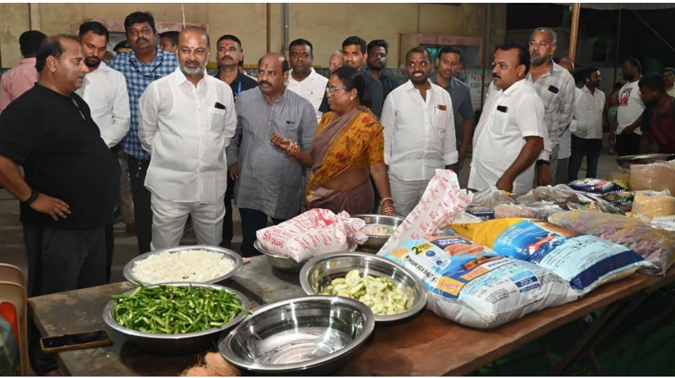
కరీంనగర్ శ్రీ మహా శక్తి దేవాలయం నేను జరగబోయే శ్రీ రామ నవమి వేడుకల ఏర్పాట్లను పరిశీలిస్తున్న కేంద్ర హోమ్ శాఖ సహాయ మంత్రి బండి సంజయ్ కుమార్

25 వేల మందికి సరిపడా ఘనముఖాలతో పంటకాలు రడీ శ్రీ మహాశక్తి ఆలయంలో సీతమ్మ-రామయ్యు పెళ్లి వేడుకలకు హాజరయ్యే భక్తులకు భోజన, ప్రసాదాలు సైతం అందజేసేందుకు అన్ని ఏర్పాట్లు చేస్తున్నారు. దాదాపు 25 వేల మంది భక్తులు నవమి వేడుకలకు హాజరవుతారని అంచనా వేస్తున్న ఆలయ నిర్వాహకులు అందరికీ సరిపడా భోజనాలు, ప్రసాదాలను సిద్ధం చేస్తున్నారు. పెళ్లి సమయంలో ఏ విధంగా భోజనాలను సిద్ధం చేస్తారో... అదే తరహాలో మూడు రకాల కూరలు, సాంబార్, పెరుగు, స్వీట్, ఫులితో సహా ప్రత్యేక పంటకాలను వడ్డించేందుకు సిద్ధమయ్యారు. భక్తులకు భోజన సమయంలో క్యూ కట్టే పనిలేకుండా 9 స్టాల్స్ ను ఏర్పాటు చేస్తున్నారు. ప్రత్యేక పంటకాలను ఏర్పాటు చేసే కార్యక్రమం నుండి పంటలు ప్రారంభించనున్నారు. సీతారామచంద్రస్వామి పెళ్లి వేడుకలకు తరలివచ్చే కరీంనగర్ లోని శ్రీమహాశక్తి ఆలయంలో నిర్వహించే సీతారామచంద్రస్వామి పెళ్లి వేడుకలకు ప్రతి ఒక్కరూ తరలివాలని కేంద్ర మంత్రి బండి సంజయ్ పిలుపునిచ్చారు. శ్రీరామ నవమి వేడుకలకు హాజరయ్యే భక్తులందరికీ ఇబ్బందులేకుండా అన్ని రకాల ఏర్పాట్లు చేసినట్లు తెలిపారు. భక్తులందరికీ వేదపండితుల ఆశీర్వాదంతోపాటు తలంబ్రాలను అందజేసేందుకు ఏర్పాట్లు చేసినట్లు పేర్కొన్నారు.