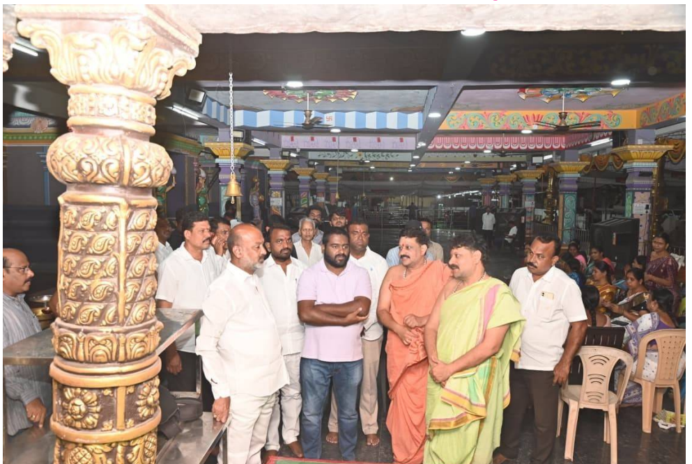
చలువ పందిళ్లు, తప్పట్లు, తాళాలు, తలంబ్రాలు రడీ వివరించనున్నారు. మధ్య మధ్యలో స్వామి వారికి గాన సేవ చేస్తారు.

పెళ్లంటే పందిళ్లు, తప్పట్లు, తాళాలు, తలంబ్రాలు అనే నానుడిని నిజం చేస్తూ అమ్మవారి ఆలయంలో పెద్ద ఎత్తున చలువ పందిళ్లను ఏర్పాటు చేశారు. ఇక తప్పట్లు, తాళాలు సరేనని. ఒకేసారి 25 వేల మంది భక్తులు ప్రత్యక్షంగా వీక్షించేలా ఎల్ ఈడీ స్కీన్లను అమర్చారు. సీతారామచంద్రస్వామి పెళ్లి వేడుకలకు హాజరయ్యే భక్తులందరికీ వేద పండితుల ఆశీర్వాదంతోపాటు తలంబ్రాలను అందజేయనున్నారు. ఉదయం 9 గంటలకు సీతారామచంద్రుడి పెళ్లి వేడుకలు ప్రారంభం కానున్నాయి. వేడుకలు నిర్వహించే అర్చకులు సామాన్యులకు సైతం అర్చమయ్యేలా ఒక్కో ఘట్టాన్ని