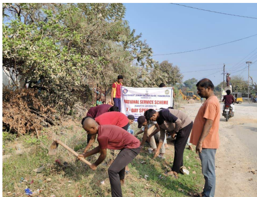
హనుమకొండ జిల్లా, ధర్మసాగర్ మండలం. జనవరి 27 తెలుగు రేఖ.

ధర్మసాగర్ మండలంలోని ఎలుకర్తి గ్రామంలో పచ్చదనం పరిశుభ్రత ప్రతి ఒక్కరి బాధ్యత అని గ్రామ సర్పంచ్ నరిశెట్టి