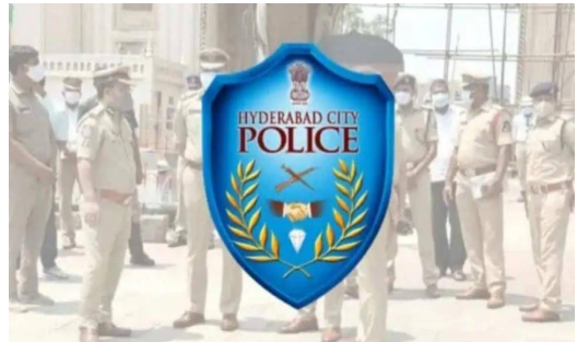
ములుగు, జనవరి 27 ( తెలుగు రేఖ):

మేడారం జాతరలో అత్యంత కీలకమైనది పోలీస్ శాఖనే. ట్రాఫిక్ తో పాటు శాంతిభద్రతల భారం ఆ శాఖపైనే ఉండటంతో పోలీసులు అత్యధునిక టెక్నాలజీని వినియోగించారు. జాతరలో 13వేల మంది పోలీసు సిబ్బంది విధులు నిర్వహిస్తున్నారు. ఉమ్మడి జిల్లాలోని ఎస్.పి.లు, ఎస్.ఐ.లు, డీ.ఎస్.ఐ.లు కూడా విద్యుత్ చేరుతున్నారు. బుధవారం నుంచి నాలుగు రోజులపాటు మేడారం మహాజాతర ఘనంగా జరగనుంది. లక్షలాదిగా వచ్చే భక్తులకు ఇబ్బందులు కలగకుండా ప్రభుత్వం 8 జోన్లు, 42 సెక్షన్లుగా జాతరను విభజించి విస్తృతంగా ఏర్పాట్లు చేసింది. 21 శాఖలకు చెందిన 42,027 మందికి పైగా ఉద్యోగులు, సిబ్బంది మేడారంలో విధులు నిర్వహిస్తున్నారు. ప్రధానంగా జాతరలో ఎలాంటి శాంతిభద్రతల సమస్యలు తలెత్తకుండా పోలీసులు వివిధ సహకారంతో అత్యధునిక డ్రోన్లు, సీసీ కెమెరాలను జాతరను విభజించి అవుతున్నారు. అలాగే 20 లక్షల మంది భక్తులను సురక్షితంగా జాతరకు చేర్చేందుకు ఆర్టీసీ కార్యాలయ రూపొందించింది. భక్తులకు మెరుగైన వైద్యసేవలు అందించేందుకు వైద్య, ఆరోగ్యశాఖతో పాటు