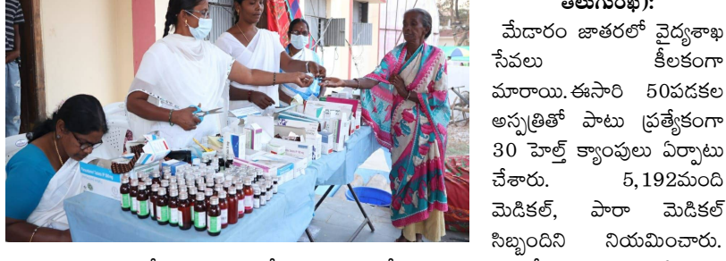
ములుగు, జనవరి 27 ( తెలుగు రేఖ):

మేడారం జాతరలో వైద్యశాఖ కీలకంగా మారాయి. ఈసారి 50వదకల అన్నత్రీతో పాటు ప్రత్యేకంగా 30 హెల్త్ క్యాంపులు ఏర్పాటు చేశారు. 5,192మంది మెడికల్, పారా మెడికల్ సిబ్బందిని నియమించారు. జాతర సమయంలో 24గంటలు సేవలు అందించేందుకు వైద్య, ఆరోగ్యశాఖ విస్తృత ఏర్పాట్లు చేసింది. 649మంది వైద్యాధికారులు, 154మంది ఆయుర్వేద వైద్యాధికారులు, 673మంది నర్సింగ్ అధికారులు, 1,905మంది ఆశ వర్కర్లు, 1,111మంది పారా మెడికల్ సిబ్బంది, 331మంది సూపర్వైజర్లు, 700మంది ఇతర సిబ్బందిని నియమించారు. జాతర అనంతరం కూడా వ్యాధులు ప్రబలకుండా 10మెడికల్ క్యాంపులు నిర్వహించేందుకు ఏర్పాట్లు చేస్తున్నారు. వీటిలో పాటు ములు గు జిల్లా ఆస్పత్రి, ఏలూరునగరంలో ఏరియాల అన్నత్రీలో వైద్య సేవలు అందేలా ఏర్పాట్లు చేస్తున్నారు. 108 వాహనాలను 15 అందుబాటులో ఉంచుతున్నారు. మరో 15 మొబైల్ అంబులెన్స్ లను కూడా జాతరకు తరలిస్తున్నారు.