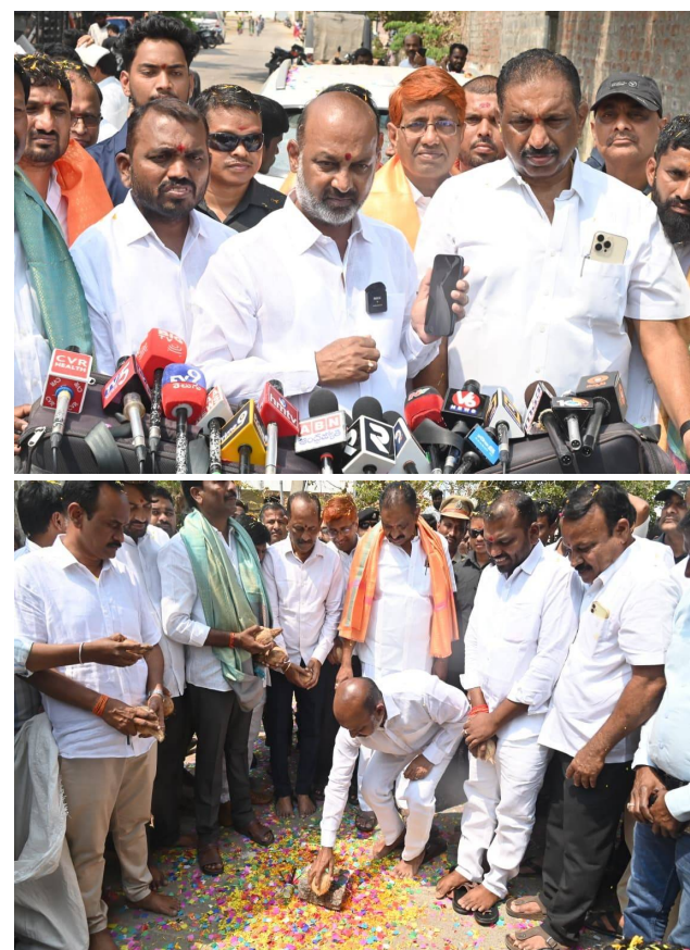
కరీంనగర్ ఫిబ్రవరి 27 తెలుగురేఖ: