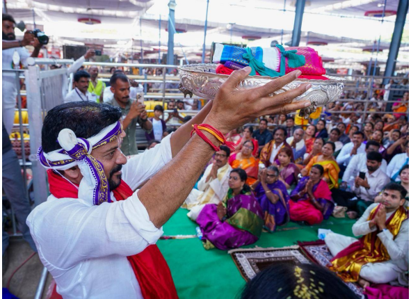
సంవే కాకుండా వివిధ రాష్ట్రాల నుంచి శ్రీరాముని భక్తులు భారీగా తరలివచ్చారు. శ్రీరామ నామస్మరణతో మిథిలా స్టేడియం ప్రాంగణం మార్యోగింది. సీతారాముల కల్యాణం సందర్భంగా మిథిలా స్టేడియంలో పాటు రామయ్య దేవాలయాన్ని సర్వంగ సుందరంగా ముస్తాబు చేశారు.