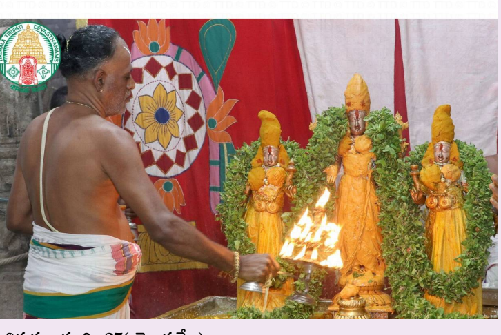
తిరుమల, మార్చి 27 (తెలుగురేఖ):