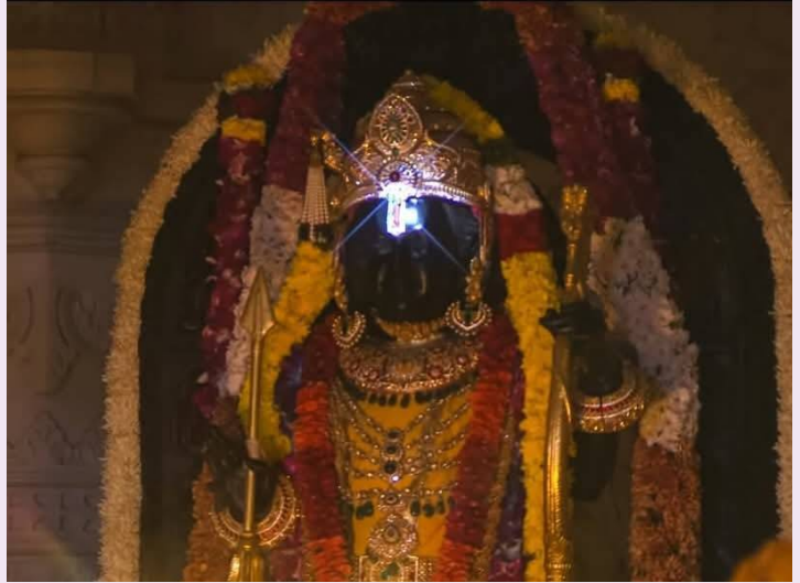
అయోధ్య, మార్చి 27 (తెలుగురేఖ):

- బాలరాముడిపై సూర్యకీరణాలతో తిలకం - తిలకించి, పులకించిన భక్తజనం