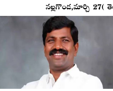
నల్లగొండ, మార్చి 27 (తెలుగురేఖ):

- ఎమ్మెల్యే వేములకు తృటిలో తప్పిన ప్రమాదం