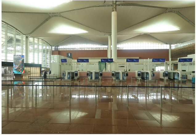
కేంద్ర విమానయాన మంత్రి రామ్మోహన్ నాయుడు తెలిపారు. ప్రతిష్ఠాత్మకమైన హేయం ఇంటర్నేషనల్ ఎయిర్పోర్టును ప్రధాన మంత్రి నరేంద్ర మోడీ, ఉత్తరప్రదేశ్ ముఖ్యమంత్రి యోగి ఆదిత్యనాథ్ ప్రారంభించనున్నారని ఆయన వెల్లడించారు. ఈ విషయాన్ని తెలియజేస్తున్నందుకు తనకు

కానుంది. ప్రధాని మోడీ చేతుల మీదుగా ప్రారంభం కానుంది. అనంతరం టెర్మినల్ ను మోడీ పరిశీలించనున్నారు. ఇక ఈ ఎయిర్పోర్టు ప్రారంభం కాగానే ఢిల్లీ విమానాశ్రయంలో ప్రయాణికుల రద్దీ తగ్గి.. విమానాల సామర్థ్యం పెరుగుతుంది. మొదటి దశలో విమానాశ్రయం సంపూర్ణంగా 12 మిలియన్ల (2 కోట్లు) మంది ప్రయాణికులు ప్రయాణం చేయవచ్చు. తదుపరి దశలలో ఈ సామర్థ్యాన్ని 70 మిలియన్ల (7 కోట్లు) మంది ప్రయాణికులకు విస్తరింపజేస్తారు. ఆధునిక నావిగేషన్ వ్యవస్థలు, ఇన్ స్ట్రుమెంట్ ల్యాండ్ లింగ్ సిస్టమ్, ఆధునిక లైటింగ్ వ్యవస్థలను ఏర్పాటు చేశారు.ఈ విమానాశ్రయం యమునా ఎక్స్ ప్రెస్ వే సమావంత్ ఉంది. మల్టీ-మోడల్ ట్రాన్స్ పోర్ట్ హాజీగా రూపొందించారు. ఇది రోడ్డు, రైలు, మెట్రో, ఇతర ప్రాంతీయ రవాణా మార్గాల ద్వారా అద్భుతమైన కనెక్టివిటీని అందిస్తుంది. విమానాశ్రయం డిజైన్, ఘాట్లు, భవనాలు భారతీయ సంస్కృతిని ప్రతిబింబిస్తుంది. అన్ని వాతావరణ పరిస్థితుల్లో 24 గంటల విమాన సర్వీసులను అందించనుంది. నేటి నుంచి రెండో అంతర్జాతీయ విమానాశ్రయం అందుబాటులోకి రానుందని