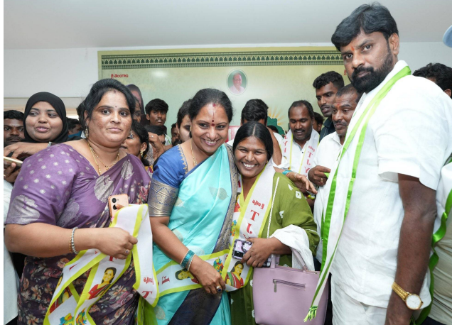
చూస్తున్నామని కవిత వ్యాఖ్యానించారు. కచ్చితంగా ఒక కొత్త రాజకీయ పార్టీ రావాల్సిన అవసరం ఉందన్నారు. అందరూ

తెలిపారు. మేధుల్లోని మునిరాబాద్ వద్ద అర్ధయ ఫంక్షన్ హోల్ లో జెండా ఆవిష్కరణ చేస్తామని ప్రకటించారు. ఆ సమయంలోనే పార్టీ పేరును కూడా ప్రకటించనున్నట్లు తెలిపారు. కార్యక్రమాలకా సమయానికి చేరుకోవాలని, ప్రతి గ్రామం నుంచి తరలి రావాలని కవిత పిలుపునిచ్చారు. జయశంకర్ పేరు పెట్టుకుంటామని చెప్పారు. యువతకు, మహిళలకు ప్రాధాన్యం ఇస్తామని వెల్లడించారు. ఆడబిడ్డల్లో మార్పు తేవడానికి ఒక ఆడబిడ్డా ఈ పార్టీని పెడుతున్నానని తెలిపారు. బీసీ బిల్లు సాధించడం తమ వల్లనే సాధ్యమవుతుందని అన్నారు. బీసీలు, దళితులు, గిరిజనులు, మైనార్టీలు తరలిరావాలని కవిత పిలుపునిచ్చారు. తెలంగాణ రాజకీయాలను శ్రీరాముడి స్ఫూర్తితో గమనించాలని కవిత అన్నారు. 'నేను నిజామాబాద్ బిడ్డను.. నిజామాబాద్ మట్టి మంచి.. ఇక్కడ తీసుకునే ఏ నిర్ణయమైనా సక్సెస్ అయింది' అని తెలిపారు. నీళ్లు, నిర్దులు, నియామకాలు సంపూర్ణంగా సాధించలేకపోయామన్నారు. రోజూ ప్రజల అవస్థలు