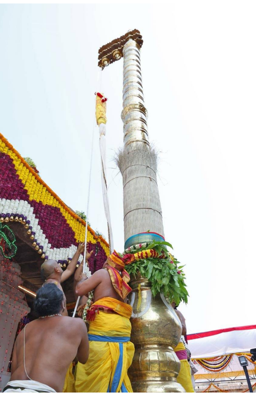
ఒంటిమిట్ట, మార్చి 27 (తెలుగురేఖ):

ఒంటిమిట్ట శ్రీ కోదండరామస్వామి ఆలయంలో శుక్రవారం ఉదయం ధ్వజారోహణతో శ్రీరామనవమి బ్రహ్మాత్మవాలకు