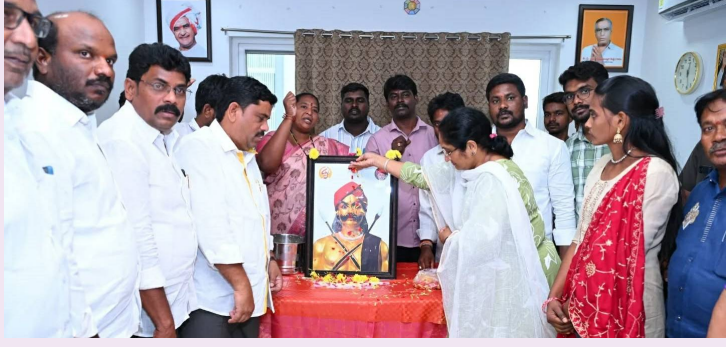
అమరావతి, మార్చి 27 (తెలుగురేఖ):

- ఇచ్చిన మాట నిలబెట్టుకున్నాం - మీడియాతో మంత్రి సవిత వెల్లడి