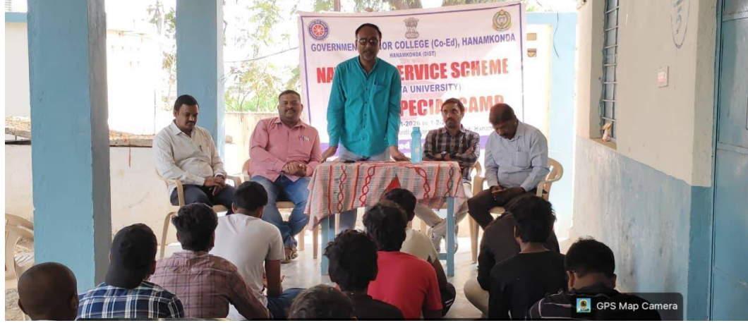
హనుమకొండ జిల్లా, భర్తసాగర్ మండలం, జనవరి 28, తెలుగు రేఖ