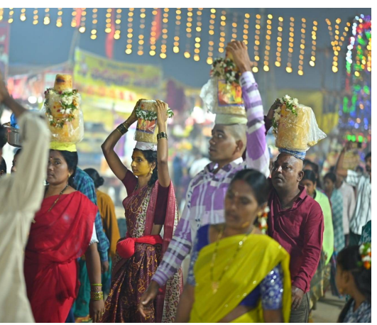
నిద్దంపూతారు. ముఖ్యంగా అమ్మవారికి ఎంతో ప్రీతిపాత్రమైన వెదురు లంకలను (ఎదురు కర్రలు) పట్టుకుని భక్తిపాటలు పాడుతూ భక్తులు చేసే సందడి జాతరలో ప్రత్యేక ఆకర్షణగా నిలుస్తోంది.

అవకాశం వస్తోంది. ఇక్కడ పుణ్యస్థానం ఆచరించిన తర్వాత అమ్మవార్ల గద్దెల దర్శనానికి వెళ్లడం సంప్రదాయం. భక్తులు తమ వెంట తెచ్చుకున్న అమ్మవారి ప్రతిమలను వారులో పవిత్రంగా కడిగి, పూజలు నిర్వహిస్తారు. ఈ సందర్భంగా భక్తులు తమ ఇళ్ల వద్ద ప్రతిష్ఠించుకున్న గద్దెలను మేడారం తీసుకువచ్చి, ఇక్కడ జంపన్నకు మొక్కులు అప్పగిస్తారు. తాము కోరుకున్న కోరికలు నెరవేరుతుందని కృతజ్ఞతగా 'ఎత్తు బంగారం' అంటే తమ బరువుకు సమానమైన బెల్లన్నీ అమ్మవార్లకు సమర్పించేందుకు