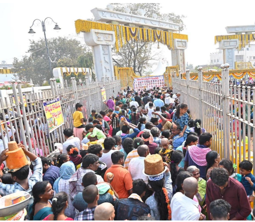
పునర్నిర్మాణం చేసింది. అలాగే భక్తులకు

ములుగు, జనవరి 28 (తెలుగురేఖ): ఆసియా ఇండోనేసి అతిపెద్ద గిరిజన జాతరగా, తెలంగాణ కుంభమేళాగా పేరుంచిన మేడారం సమృత్త - సారలమ్మ మహా జాతర మొదలయ్యింది. లక్షలాది మంది భక్తులు తరలివస్తున్నారు. జాతరలో కీలక ఘట్టం అవిష్కృతం కానుంది. సాయంత్రం కన్నెపల్లి నుంచి సారలమ్మ అమ్మవారు మేడారం గద్దెపైకి రానున్నారు. కన్నెపల్లిలోని సారలమ్మ మందిరంలో కోయి పూజారలు ప్రత్యేక పూజలు నిర్వహిస్తారు. అనంతరం భారీ భద్రత మధ్య సారలమ్మ గద్దెకు చేరుకుంటారు. గోవింద రాజు, పగిడిద్ద రాజులు కూడా గద్దెలకు చేరుకుంటారు. అలాగే గురువారం సాయంత్రం చిలకలగుట్ట నుంచి సమృత్త అమ్మవారు గద్దెపైకి వస్తారు. సమృత్త రాకతో జాతర పరిపూర్ణం కానుంది. మరుసటి రోజు అనగా శు క్రవారం (జనవరి 30) భక్తులు సమృత్త - సారలమ్మలను దర్శించుకుని మొక్కులు చెల్లించుకుంటారు. చివరి రోజైన శనివారం సాయంత్రం సమృత్త సారలమ్మ, గోవింద రాజు, పగిడిద్ద రాజులు వన ప్రవేశం చేస్తారు. దీంతో జాతర పరిపూర్ణంగా ముగుస్తుంది. మేడారం మహా జాతర తెలంగాణ సంస్కృతి, గిరిజన సంప్రదాయాలకు ప్రతీకగా నిలుస్తుంది. మేడారంలో భక్తుల రద్దీ కొనసాగుతోంది. జంపన్నవారులో పుణ్యస్థానాలు చేసి, వనదేవతలకు మొక్కులు చెల్లించుకుంటున్నారని భక్తులు. జనాల గుండాలతో మేడారం కిటికీలూడుతోంది. భక్తులు బెల్లం (బంగారం) నమర్చిస్తూ ఆచారాలు పాటిస్తున్నారు. మహాజాతరకు ప్రభుత్వం కట్టుదిట్టమైన భద్రతా ఏర్పాట్లు చేపట్టింది. దాదాపు మూడు కోట్ల మంది భక్తులు హాజరవుతారని అంచనా. ప్రభుత్వం తాజాగా గృహలను