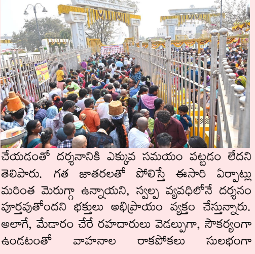
చేయడంతో దర్శనానికి ఎక్కువ సమయం పట్టడం లేదని తెలిపారు. గత జాతరలతో పోలిస్తే ఈసారి ఏర్పాట్లు మరింత మెరుగ్గా ఉన్నాయని, స్వల్ప వ్యయంతోనే దర్శనం పూర్తిచేయడం భక్తులు అభిప్రాయం వ్యక్తం చేస్తున్నారు. అలాగే, మేడారం చేరే రహదారులు వెడల్పుగా, సౌకర్యంగా ఉండటంతో వాహనాల రాకపోకలు సులభంగా

శ్రీ సమృత్త-సారలమ్మ మేడారం మహాజాతర సందర్భంగా ప్రభుత్వం, జిల్లా యంత్రాంగం చేపట్టిన ఏర్పాట్లపై భక్తులు సంతోషిస్తూ వ్యక్తం చేస్తున్నారు. ఈసారి మేడారంలో తక్కువ సమయంలో దర్శనం జరుగుతోందని, భారీ రద్దీ ఉన్నప్పటికీ ఎక్కడా తొక్కిలాటలు జరగకుండా, క్యూ లైన్స్ ఇబ్బందులు లేకుండా దర్శనం సాధ్యం సాగుతోందని భక్తులు పేర్కొంటున్నారు. క్రమపద్ధతిలో ఏర్పాటు చేసిన క్యూ లైన్స్, పోలీసులు, వాలంటీర్ల నిరంతరం మార్గనిర్దేశం