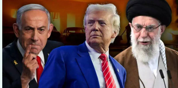
వాషింగ్టన్, మార్చి 2 (తెలుగురేఖ):

ఇరాన్తో యుద్ధం మరో నాలుగు, ఐదు వారాలు జరగొచ్చునని, ఆ యుద్ధం ముగిసేలోపు మరింత మంది ఎక్కువ అమెరికా సైనికులు మృతి చెందే అవకాశం ఉందని అగ్రదాఖ్య అధ్యక్షుడు డొనాల్డ్ ట్రంప్ పేర్కొన్నారు. పశ్చిమాసియాలో ఉద్రిక్తతలపై ట్రంప్ కీలక వ్యాఖ్యలు చేశారు. 'ఆపరేషన్ ఎపిక్ ప్యూర్' మరియు 'రోజుల పాటు పూర్తి స్థాయిలో కొనసాగుతుందన్నారు. అలాగే అమెరికా సైనికుల గురించి కీలక వ్యాఖ్యలు చేశారు. 'ఈ ఆపరేషన్లో ఇప్పటివరకు ముగ్గురు అమెరికా సైనికులు మృతి చెందారు. మా సైనికుల మృతి కచ్చితంగా ప్రకటించారు. యుద్ధం ముగిసేలోపు మరింత మంది అమెరికా సైనికులు ప్రాణాలు కోల్పోయే అవకాశముంది. అయినా ముందుకే వెళ్తాం. ఈ దాడుల వల్ల ఇరాన్లో 200 మంది మరణించినట్లు తెలిసింది. ఇరాన్ బిఆర్జిని, మిలిటరీ దళాలు ఆయుధాలు వీడితే వారికి రక్షణ కల్పించేందుకు సిద్ధం. లేదంటే వారికి తల తప్పదు. అలాగే చర్చల కోసం మా దౌత్య మార్గాలు ఇప్పటికీ తెరిచే ఉన్నాం' అని ట్రంప్ పేర్కొన్నారు. అలాగే తనపై జరిగిన హత్యాయత్నాలు గురించి కూడా ట్రంప్ స్పందించారు. 'ఖమేనీ ప్రోద్బలంతో నాపై ఇప్పటికీ రెండుసార్లు హత్యాయత్నాలు జరిగాయి. అయితే, నేను మొదటి ప్రయత్నంలోనే అతడి కథను ముగించా. నన్ను పట్టుకోకముందే, నేను అతడిని పట్టుకున్నా. ఇరాన్పై విస్తృత స్థాయిలో దాడులు జరుపుతున్నాం. ఆ ఆపరేషన్ 4-5 వారాలు కొనసాగొచ్చు. యుద్ధం తీవ్రతను ఇదే విధంగా కొనసాగించడం అమెరికా, ఇజ్రాయెల్ కు పెద్ద కష్టం కాదు' అని ట్రంప్ పేర్కొన్నారు.