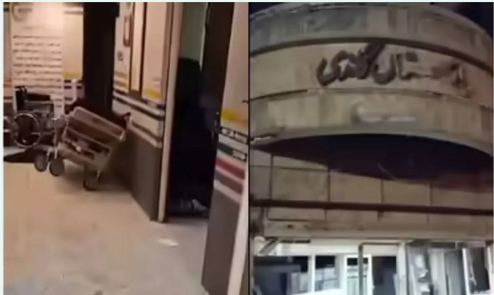
టెల్ ఆవ్, మార్చి 2 (తెలుగురేఖ):

- బాంబు దాడిలో ధ్వంసమైన గాంధీ ఆస్పత్రి - 165కు చేరుకున్న పాఠశాల దాడి మృతులు