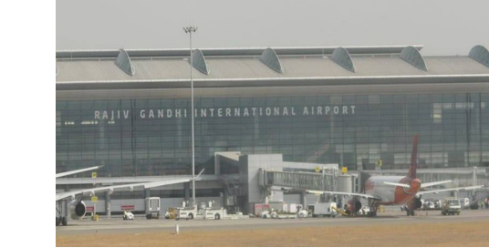
హైదరాబాద్, మార్చి 2 (తెలుగురేఖ):

రాజీవ్ గాంధీ అంతర్జాతీయ విమానాశ్రయం శంషాబాద్ నుంచి విదేశాలకు వెళ్లాలిన అనేక విమానాల రద్దయ్యాయి. ఇరాన్ - ఇజ్రాయెల్ మధ్య యుద్ధ వాతావరణం కారణంగా విమానాయన సంస్థలు ఈ మేరకు నిర్ణయం తీసుకున్నాయి. శంషాబాద్ విమానాశ్రయం నుంచి దోహా, అబుదాబి, జెడ్డా, సౌదీ అరేబియా వెళ్లాలిన విమానాలు రద్దయ్యాయి. అలాగే కువైట్, దుబాయ్, మస్కట్, మదీనా వెళ్లే సర్వీసులు కూడా తాత్కాలికంగా నిలిపివేయబడ్డాయి. శంషాబాద్ నుంచి వెళ్లాలిన సుమారు 22 విమానాలు రద్దు కాగా, వివిధ దేశాల నుంచి రావాలిన మరో 22 విమానాలు కూడా రద్దయ్యాయి. పశ్చిమాసియాలో నెలకొన్న యుద్ధ వాతావరణం దృష్ట్యా ఎయిర్ ఇండియా, ఇండిగ్, ఎమిరేట్స్, కతార్ ఎయిర్వేస్ వంటి విమానయాన సంస్థలు విమానాలను రద్దు చేశాయి. విమానాల రద్దుతో శంషాబాద్ విమానాశ్రయం పరిసరాలు ప్రయాణికుల లేక వెలవెలబోతున్నాయి. ప్రయాణికులకు డైరెక్టర్ జనరల్ ఆఫ్ సివిల్ ఏవియేషన్ కీలక సూచన జారీ చేసింది. మిడిల్ ఈస్ట్ దేశాలకు ప్రయాణాలను రద్దు చేసుకోవాలని... ++-లలో స్టేబిలైజ్ ఎయిర్లైన్ వెబ్సైట్లు, ఎయిర్పోర్ట్ అధికారుల ద్వారా తెలుసుకోవాలని డిజీసీపి సూచించింది.