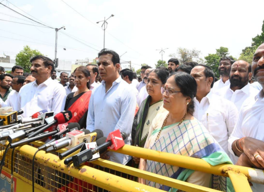
అభిప్రాయాలకే ఎక్కువ ప్రాధాన్యత ఇచ్చేలా ఈ బిల్లు రూపకల్పన జరిగింది. ఇది కచ్చితంగా దుర్వినియోగానికి దారితీస్తుందని కేటీఆర్ పేర్కొన్నారు. బిల్లులో ఉపయోగించిన 'వ్యతిరేక భావాలు క్రేరేపించుకో', 'సామాజిక సమగ్రతను దెబ్బతీయడం' వంటి పదాలకు స్పష్టమైన న్యాయ పరిమితులు లేవని కేటీఆర్ అన్నారు. ప్రభుత్వ వైఖరాలను ఎండగట్టే ప్రతిపక్ష నేతలు, జర్నలిస్టులు, సామాజిక కార్యకర్తలను లక్ష్యంగా చేసుకునేందుకే ఈ పదజలాన్ని పొందుపరిచారని ఆరోపించారు. ప్రభుత్వ నిర్ణయాలను విమర్శిస్తే వాటిని 'ఫిక్

రాష్ట్ర ప్రభుత్వం ప్రతిపాదించిన 'తెలంగాణ హేట్ స్పీచ్ అండ్ హేట్ క్రిమ్స్ (ప్రివెన్షన్) బిల్లు' పై భారత రాష్ట్ర సమితి వర్సింగ్ ప్రెసిడెంట్ కేటీఆర్ తీవ్రస్థాయిలో విరుచుకుపడ్డారు. ఈ బిల్లును పౌర స్వేచ్ఛను హరించే ఒక క్రూరమైన ఆయుధంగా కేటీఆర్ అభివర్ణించారు. సోమవారం ఈ మేరకు ఆయన ఒక ప్రకటన విడుదల చేశారు. ప్రభుత్వం తన విమర్శకుల నోళ్లు మూయించేందుకే ఇటువంటి నిరంకుశ చర్యలను తీసుకువస్తోందని కేటీఆర్ మండిపడ్డారు.ఈ బిల్లు చట్టరూపం దాటితే రాజ్యాంగం కల్పించిన భావచైతన్య స్వేచ్ఛకు, ప్రజాస్వామ్య మూలాలకే ముప్పు వాల్చుతుందని కేటీఆర్ ఆందోళన వ్యక్తం చేశారు. సామాజిక సామరస్యాన్ని కాపాడడం ప్రభుత్వ బాధ్యత అయినప్పటికీ, ఈ బిల్లులోని నిబంధనలు అత్యంత అస్పష్టంగా ఉన్నాయని ఆయన విమర్శించారు. 'అమలు అయ్యారా' అంటూ కంటే అధికారుల వ్యక్తిగత