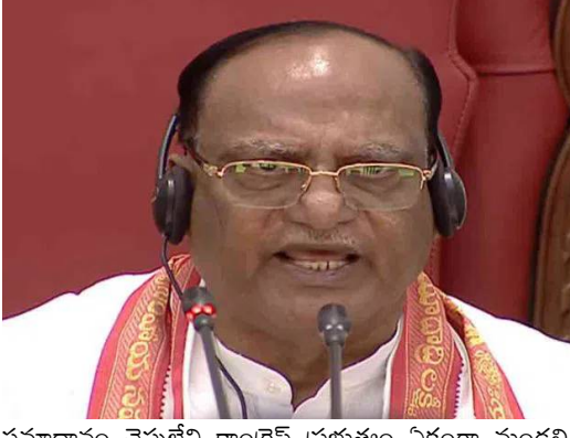
సమాధానం చెప్పలేని కాంగ్రెస్ ప్రభుత్వం ఏకంగా మండలి బీఆర్ఎస్ సభ్యులను సస్పెండ్ చేసింది. తెలంగాణ రాష్ట్ర చరిత్రలోనే ఇలా మండలి సభ్యులపై సస్పెన్షన్ వేటు పడటం ఇదే తొలిసారి కావడం గమనార్హం. కానీ, సస్పెన్షన్ కు నిరసనగా బీఆర్ఎస్ మండలి సభ్యులు చైర్మన్ పోడియం వద్ద నిరసన తెలిపారు. ఈ క్రమంలో మండలి సభ్యులను మార్చల్