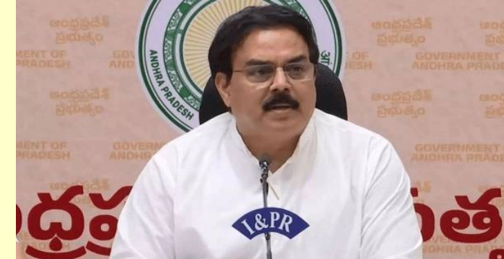
నెల్లూరు, మార్చి30 (తెలుగురేఖ):