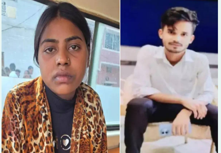
రాంపూర్, ఫిబ్రవరి 4 (తెలుగురేఖ):