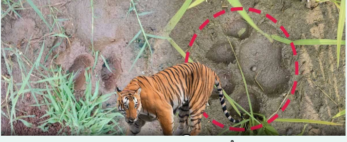
జనగామ, ఫిబ్రవరి 4 (తెలుగురేఖ):

పెద్దపులి సంచారం ఇప్పుడు మూడు జిల్లాల వాసులను భయాందోళనకు గురి చేస్తోంది. సిద్దిపేట, యాదాద్రి, జనగామ జిల్లాల సరిహద్దుల్లో తిరుగుతున్నట్లుగా గుర్తించారు. జనగామ మండలంలోని సిద్దిపేట, పెంబర్తి, పెద్దరాంచర్లలో పెద్దపులి సంచరిస్తున్నట్లు ప్రచారం జరుగుతోంది. యాదాద్రి భువనగిరి జిల్లా ఆలేరు మండలం కొలనుపాక గ్రామ మీదూగా పెద్దపులి జనగామకు ప్రవేశించినట్లు రైతులు అటవీశాఖ, పోలీసులు సమాచారం అందించారు. దీంతో అధికారులు ఆయా గ్రామాలకు వెళ్లి పులి పాదముద్రలను సేకరించారు. వ్యవసాయ బావుల ప్రాంతాల్లో సంచరిస్తూ ఉండొచ్చని కావున వ్యవసాయ పనులకు వెళ్లే రైతులు, జిల్లా ప్రజలు అప్రమత్తంగా ఉండాలని అధికారులు సూచించారు. జగదేవ్ పూర్ మండలం దౌలాపూర్ అటవీ ప్రాంతం నుంచి బయటకు వచ్చిన పెద్దపులి వరుస గ్రామాల్లో సంచరిస్తూ ప్రజలను కంటిమీద కుసుకు లోకుండా చేస్తోంది. తాజాగా ఈ పులి యాదాద్రి భువనగిరి జిల్లా రాజపేట మండలం బసంతపూర్ సమీపంలో ఓ లేగదూడపై దాడి చేసి చంపేసినట్లు అటవీ శాఖ అధికారులు నిర్ధారించారు. పులి కదలికలను నిరంతరం పర్యవేక్షిస్తున్న అధికారులు, తాజాగా జనగామ జిల్లా ఆలేరు మండలం శ్రీనివాసపురం గ్రామ పరిసరాల వైపు పులి వెళ్లిన్నట్లు పాదముద్రల ఆధారంగా గుర్తించారు. ఘటనా స్థలాల్లో అటవీ శాఖ బృందాలు విస్తృతంగా తనిఖీలు చేపట్టాయి. పులి ప్రయాణించే మార్గాల్లో ట్రాప్ కెమెరాలను ఏర్పాటు చేశారు. పులి సంచారం కారణంగా సరిహద్దు గ్రామాల ప్రజలు అప్రమత్తంగా ఉండాలని అధికారులు హెచ్చరించారు.