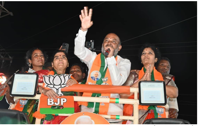
కొన్నింటికి బిల్లులు రాక ఆగినయ్. కలెక్టరేట్ నుంచి వచ్చే పెద్ద డ్రైనేజీ సమస్య... దీంతోపాటు ఈ 3 డివిజన్లపై ద్రుష్టి పెడతా...

అధునికరించినం. ఇటు వాణిజ్య రహదారి కనెక్టింగ్ రోడ్లు.. అటు ఎన్టీఆర్ చారిత్రా నుంచి ఇటు సిరిసిల్ల బైపాస్ రోడ్డు వరకు రూపాయలు 10 కోట్ల కేంద్ర నిధులతోనే సెంట్రల్ లైటింగ్ ఏర్పాటు... కేంద్ర పైసలతోనే సిగ్నలింగ్ వ్యవస్థ ఏర్పాటు చేసినం.