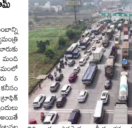
విధించారు. ఎడ్రెపాడు జాతీయ రహదారిపై వైసీపీ నేతల బహుళాను పోలీసులు నిలిపివేస్తున్నారు. గుంటూరులో జగన్ పర్యటనకు వెళ్ళేకూడా ఆంక్షలు పెట్టి, పలువురు వైసీపీ నేతలకు నోటీసులు ఇచ్చారు. మరోవైపు పల్నాడు జిల్లా నుంచి

గుంటూరుకు వైసీపీ కేడర్ తరలివెళ్ళింది. దీంతో ఎలాంటి అవాంఛనీయ ఘటన జరగకుండా పోలీసులు భారీ బందోబస్తు ఏర్పాటు చేశారు. సత్తెనపల్లి మండలం నుండిగా అడ్డరోడ్డు దగ్గర నేతలను నిర్వహించి ఎక్కడికక్కడ వైసీపీ నేతలను పోలీసులు అడ్డుకుంటున్నారు. మరోవైపు.. జగన్ గుంటూరు పర్యటనకు అనుమతి ఇవ్వాలని వైసీపీ నాయకులు పోలీసు అధికారులను కోరారు. అందుకు పోలీసులు నిరాకరించారు. గుంటూరు జిల్లా పరిధిలో పోలీస్ 30 యాక్ట్ అమల్లో ఉన్న నేపథ్యంలో ఎక్కడా బహిరంగ సభలు, సమావేశాలకు అనుమతి లేదని జిల్లా పోలీసు కంట్రాంగం ప్రకటన జారీ చేసింది. ట్రాఫిక్ అంతరాయం కలిగించినా, సాధారణ జనజీవనానికి ఇబ్బందులు కలిగించినా చర్యలు తప్పని గుంటూరు పోలీసులు హెచ్చరించారు.