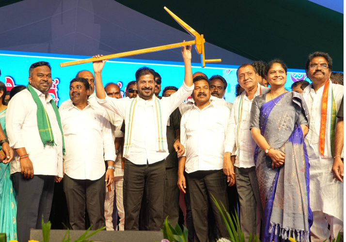
టూరిజంను అభివృద్ధి చేసే పర్యాటక కేంద్రాలగా తీర్చిదిద్దుతామన్నారు. మేడారం సమృద్ధి సారలమ్మ దర్బానానికి కేసీఆర్, కేటీఆర్, హరిశ్ రావులు రాలేదని, పేదోళ్ల దేవుళ్లను మొక్కేందుకు వాళ్లకు నామూషీ అన్నారు. బీఆర్ఎస్ ఎన్ని శాపనారాలు పెట్టినా మరో ఎనిమిదేళ్లు అధికారం మాడేనని, తెలంగాణను రాష్ట్రంలోనే నెంబర్ వన్ రాష్ట్రంగా తీర్చిదిద్దుతామన్నారు.

అధ్యక్షుడిని తీసుకువచ్చి ప్రచారం చేస్తున్నారని, బడ్జెట్లో తెలంగాణకు గాడిద గుడ్డు ఇచ్చాం.. తెలంగాణ ప్రజలకు మనకు ఓట్లు వేయరని.. ఆ నాయకునికైనా తెలియాలి కదా అని అన్నారు. ఇక్కడి కేంద్ర మంత్రులు కిషన్ రెడ్డి, బండి సంజయ్, కేసీఆర్, కేటీఆర్ లకు నేను లెక్కలు చెప్పే గుండె పగిలి చస్తారని ధ్వజమెత్తారు. ఈ రెండు పార్టీలకు చీకటి ఒప్పందం ఉందన్నారు. పదేళ్లలో రాష్ట్రానికి బీఆర్ఎస్, పన్నెండేళ్లలో బీజేపీ దేశానికి చేసినదానికంటే తాము రెండేళ్లలో ఎక్కువ చేశామని అన్నారు. 70 వేల టండ్రికి ఉద్యోగాలు ఇచ్చామని, ఇందులో ఎవరికైనా అనుమానం ఉంటే ఎట్టి స్టేడియోనికీ రావాలని అక్కడ వివరంగా చెప్పామని సవాల్ విసిరారు. ప్రజలకు సన్నుతీయ్యం ఇస్తున్నాం, విద్యార్థుల కాస్టోడిక్ చార్జీలు పెంచాం, ట్రేడ్ ఫ్యాన్ స్కీం తీసుకువచ్చాం, ఇంటిగ్రేటెడ్ స్కూల్స్ నిర్మిస్తున్నామని, రైతులకు ఉచిత కరెంట్ ప్రారంభించిన ఘనత కాంగ్రెస్ ప్రభుత్వానిదేనన్నారు. రాష్ట్రంలో మహిళలకు ఉచిత ప్రయాణంతోపాటు ఇందిరమ్మ ఇళ్లు ఇస్తున్నామని, అధికారంలో ఉన్నప్పుడు డబుల్ బెడ్రూం ఇంపు ఇవ్వని బీఆర్ఎస్ ప్రభుత్వం బతుకమ్మ చీరల్లోనూ అవినీతికి పాల్పడ్డారని అన్నారు. వారి పాలనలో భార్యభర్తలు మాట్లాడుకునే ఫోన్లు, రాజకీయ నాయకులు, జర్నలిస్టులు, సినిమా స్టార్లు ఇలా అందరి ఫోన్లు ట్యాప్ చేశారని అన్నారు. అలాంటి మనుషులకు మున్సిపల్ ఎన్నికల్లో ఓటిస్తే మన కళ్లను మన వేలితో పొడుచుకున్నట్లు అవుతుందని అన్నారు. - గోదావరి పరివాహక దేవాలయాను అభివృద్ధి చేస్తాం..