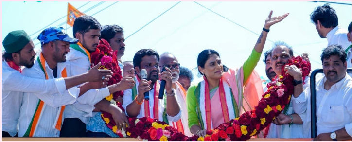
అనంతపురం, ఫిబ్రవరి 5 (తెలుగురేఖ):