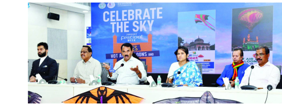
హైదరాబాద్, జనవరి 7 తెలుగురేఖ:

ఈ సంక్రాంతి పండుగను సంద్రాయం, సంస్కృతి పరిరక్షణకు అనుగుణంగా ఘనంగా జరుపుతున్నామని తెలంగాణ పర్యాటక శాఖ మంత్రి జూపల్లి కృష్ణారావు తెలిపారు. రాష్ట్ర టూరిజాన్ని ప్రమోత్ చేయడానికి ప్రత్యేక కార్యక్రమాలు ఏర్పాటు చేస్తున్నట్లు చెప్పారు. జనవరి 13 నుంచి 17 వరకు కైట్ అండ్ స్వీట్ ఫెస్టివల్ పరేడ్ గ్రౌండ్లో నిర్వహిస్తున్నట్లు వెల్లడించారు. ఈ ఫెస్టివల్లో 19 దేశాల నుంచి 40 మంది అంతర్జాతీయ కైట్ ఫ్లయర్స్, అదేవిధంగా మన దేశంలోని 15 రాష్ట్రాల కైట్ ఫ్లయర్స్ పాల్గొంటున్నారని తెలిపారు. ఈ ఉత్సవంలో వివిధ రాష్ట్రాలకు చెందిన స్వీట్ స్టాల్లల కూడా ఏర్పాటు చేస్తున్నామని వెల్లడించారు. జనవరి 16 నుంచి 18 వరకు హాట్ ఎయిర్ బెల్లాన్ షో కోసం ఏవియేషన్ అనుమతి ఇప్పటికే తీసుకున్నామన్నారు. ఈ బెల్లాన్ షో బుకింగ్ కోసం ఆన్లైన్ సౌకర్యం కూడా ఏర్పాటు