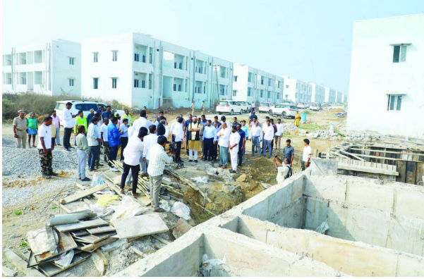
సూర్యాపేట జిల్లా జనవరి 07 తెలుగురేఖ:

ఈ ఏప్రిల్ లో మరో విడత, రానున్న 2 సంవత్సరాలలో 2 విడతల్లో రాష్ట్ర వ్యాప్తంగా అర్జులైన ప్రతి పేదవాడికి ఇందిరమ్మ ఇండ్లు మంజూరు చేస్తామని రాష్ట్ర రెవెన్యూ, గృహ నిర్మాణ, సమాచార పౌర సంబంధాల శాఖ మంత్రి పొంగులేటి శ్రీనివాస్ రెడ్డి తెలిపారు. పేదవాడికి పూర్తి భద్రత, భరోసా, ధైర్యాన్ని ఇచ్చే కార్యక్రమమే ఇందిరమ్మ ఇండ్ల కార్యక్రమమని ఆయన అన్నారు. బుధవారం ఆయన సూర్యాపేట జిల్లా, హజూర్ గర్ నియోజకవర్గ కేంద్రం సమీపంలో రామస్వామి గుట్ట వద్ద నిర్మిస్తున్న 2160 ఇందిరమ్మ ఇళ్ల కాలనీలో గృహ నిర్మాణాలను తనిఖీ చేశారు. అనంతరం ఏర్పాటుచేసిన