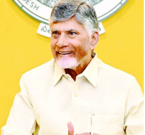
రాజకీయాలు చేయవద్దని తెలంగాణను కోరుతున్నట్లు వెల్లడించారు. రాజకీయ నేతలు పోటీపడి మాట్లాడటం సరికాదు. అక్కడి ప్రజలు కూడా ఆలోచించాలి.

తెలుగు జాతి ఒక్కటే.. ఇచ్చిపుచ్చుకునే ధోరణి ఉండాలి. ఇద్దరి మధ్య విరోధాలు పెరిగి అనందించే పరిస్థితి రాకూడదన్నారు. భావోద్వేగాలతో ఆటలు ఆడటం మంచిది కాదు. ప్రజల కోసం రాజకీయాలు చేస్తే మంచిదే. ఆర్టీఎస్లో నీళ్లు రాకుంటే జూరాల నుంచి నీళ్లు తెచ్చి మహబూబ్ నగర్ కు ఇచ్చాం. దేవదుల, కల్వకుర్తి నేనే ప్రారంభించా. దేవదులను మరింత ముందుకు తీసుకెళ్లండి.. ఎవరు వద్దన్నారని సూచించారు. ఈ మధ్య కొందరి మాటలు చూస్తే.. రాజకీయాలు నాకే అర్థం కాలేదు. గోదావరి నదికి ఎగువన దేవదుల ప్రాజెక్టు ఉంది. దేవదుల నుంచి నీళ్లు వస్తే పోలవరానికి వస్తాయి. కిందకు ఉండా అని ప్రశ్నించారు. అరోజు మంజూరు చేసిన నీళ్లు తీసుకెళ్లారు.. అప్పుడు