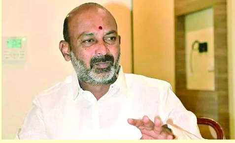
హైదరాబాద్, జనవరి 7 తెలుగురేఖ : బిజెపి తోనే రాష్ట్రంలో అభివృద్ధి సాధ్యమని, డబుల్ ఇంజన్ సర్కార్ వల్లనే రాష్ట్రం పురోగమని స్పందని కేంద్రమంత్రి బండి సంజయ్ అన్నారు.

నాయకత్వంలో భారత్ ఉజ్వలంగా ఉందన్నారు. తెలంగాణలో కూడా భవిష్యత్ బాగుండాలని కోరుకుంటున్నామని అన్నారు. జమ్మికుంట, హుజూరాబాద్ మున్సిపల్ ఎన్నికల్లో భాజపాకు అవకాశం ఇవ్వాలని, అభివృద్ధి చేసి చూపిస్తానని ఆయన హామీ ఇచ్చారు. ఇటీవలి పంచాయతీ ఎన్నికల్లో పలుచోట్ల బిజెపి బలం చాటిందన్నారు. మున్సిపల్ ఎన్నికల్లోనూ బిజెపిని ఆశీర్వదించాలన్నారు. కరీంనగర్ జిల్లా జమ్మికుంటలోని ప్రభుత్వ డిగ్రీ, బీజీ కళాశాల మైదానంలో నిర్మించనున్న సింగిల్ ట్రాక్ స్టలాస్ కేంద్రమంత్రి బండి సంజయ్ పరిశీలించారు. స్టల పనులు ప్రభుత్వ కొత్తగా చూడాల ప్రణాళిక అభివృద్ధి కమిటీలో సమావేశించారు. అనంతరం ఆయన విలేజ్ లుతో మాట్లాడుతూ కేంద్ర మంత్రిగా జమ్మికుంట, హుజూరాబాద్ ప్రభుత్వ ఆసుపత్రులకు రూ.కోటి వ్యయంతో ఆధునిక పరికరాలను సమకూర్చానని చెప్పారు. ప్రభుత్వ స్టలాలను కట్టా చేస్తే కరీంనగర్ పర్యటన పర్యటన తీసుకుంటామన్నారు. జమ్మికుంటలోని అబ్బేద్దార్ కాలనీ, హౌసింగ్ బోర్డ్ కాలనీలను మంత్రి ప్రాంతాలను కాపాడతానని, చరకాలను నిర్మాణాన్ని చేపడతామన్నారు.