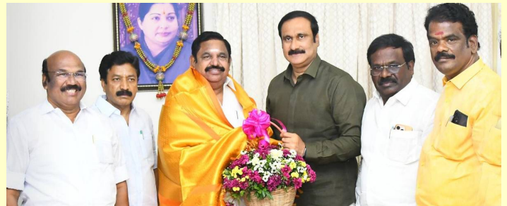
చెన్నై, జనవరి 7 ( తెలుగురేఖ):

తమిళనాడు అసెంబ్లీ ఎన్నికలు దగ్గరపడుతున్న తరుణంలో కీలక పరిణామం చోటుచేసుకుంది. అన్నాడీఎంకె, బీజేపీ కూటమి తో పట్టి మక్కల్ కట్టి పిఎంకె చేతులు కలిపింది. పీఎంకె అధ్యక్షుడు అంబుమణి రామదాస్ తమిళనాడు మాజీ సీఎం, అన్నాడీఎంకె చీఫ్ పళనిస్సామిని కలుసుకుని ఎన్డీయే కూటమిలో చేరుతున్నట్లు ప్రకటించారు. అంబుమణి రామదాస్ తో కలిసి పళనిస్సామి మీడియాతో మాట్లాడుతూ, పీఎంకె చేరితే తమ కూటమి మరింత బలపడిందని, మరి కొన్ని పార్టీలు కూడా తమతో చేరేందుకు సిద్ధంగా ఉన్నాయని చెప్పారు. తమది 'విక్టరీ అలయన్స్' అని ప్రకటించారు. అన్నాడీఎంకె నాయకత్వంలో ఎన్డీయేలో చేరేందుకు పీఎంకె చేతులు కలిపినట్లు అంబుమణి రామదాస్ తెలిపారు. మహిళల భద్రత, రైతులు, నిరుద్యోగం వంటి అంశాల్లో అధికార డిఎంకెపై ప్రజలు ఆగ్రహంతో ఉన్నారని, డిఎంకెను గృహ దిండంపై లక్ష్యంగా తాము పనిచేస్తామని చెప్పారు. భారీ మెజారిటీతో గెలిచి అన్నాడీఎంకె నాయకత్వంలో ప్రభుత్వాన్ని ఏర్పాటు చేస్తామని ధీమా వ్యక్తం చేశారు. కాగా, ఈ ఏడాది ప్రధమార్థంలో తమిళనాడు అసెంబ్లీ ఎన్నికలు జరగనున్నాయి.