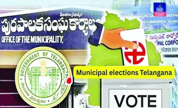
హైదరాబాద్, జనవరి 7 తెలుగురేఖ :

తెలంగాణలో ఇటీవలే గ్రామ పంచాయతీ ఎన్నికలు సమమర్థంగా నిర్వహించిన రాష్ట్ర ఎన్నికల సంఘం.. తాజాగా మున్సిపల్ ఎన్నికలపై దృష్టి సారించింది. ఈ ఎన్నికల సన్నద్ధతపై రాష్ట్ర ఎన్నికల సంఘం(ఎస్ఈసీ) కనరత్న చేస్తోంది. తెలంగాణలో మున్సిపల్ ఎన్నికల నిర్వహణ కోసం రాష్ట్ర ఎన్నికల కమిషన్ (ఈసీ) పూర్తి స్థాయిలో సన్నద్ధమవుతోంది. ఈ మేరకు జిల్లా కలెక్టర్లు,