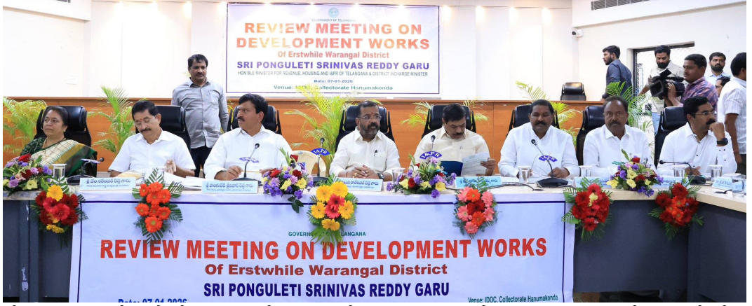
చేశారు. దశల వారీగా చేపట్టే కార్యక్రమాల్లో భాగంగా కోర్

చరిత్ర కలిగిన సముక్త సారము గద్దెల ఆధునీకరణ పనుల