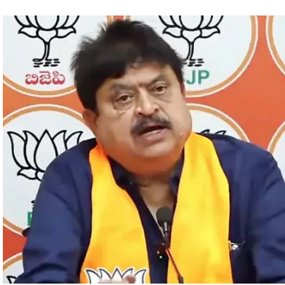
ఒకటి చొప్పున ఐదు భారీ బహిరంగ సభలకు ప్లాన్ చేస్తున్నారని, జేపీ నడ్డా, రాజీనాథ్ సింగ్ లాంటి వారి సభల కోసం బీఎల్ సంతోషికి ప్రతిపాదనలు పంపాం అని అన్నారు.

హైదరాబాద్: తెలంగాణలో బీఆర్ఎస్, కాంగ్రెస్ కావాలని బీజేపీ తప్పుడు ప్రచారాలు చేస్తున్నాయని ఆరోపించారు రాష్ట్ర బీజేపీ చీఫ్ రామచందర్ రావు. సింగరేణి నైసీ కోల్ టెండర్ల అవకతవకలపై విచారణ జరగాల్సిందేనని డిమాండ్ చేశారు. కాంగ్రెస్ నేతలు దావోస్ వెళ్లి ఏం చేస్తున్నారని ప్రశ్నించారు. బీజేపీ రాష్ట్ర కార్యాలయంలో పార్టీ పదాధికారుల సమావేశం జరిగింది. ఈ సమావేశంలో పార్టీ రాష్ట్ర కమిటీ తీరుపై ప్రధానంగా చర్చించారు. రాష్ట్ర కమిటీ సభ్యులకు బాధ్యతలు అప్పగించి నాలుగు నెలలు పూర్తి అనుబంధ విభాగాల పనితీరుపై ఆయన సమీక్ష చేశారు. ఈ క్రమంలో రాష్ట్ర కమిటీ పనితీరుపై రామచందర్ రావు అసంతృప్తి వ్యక్తం చేశారు. అనంతరం, రామచందర్ రావు మాట్లాడుతూ.. బీజేపీ అగ్రనేతలతో రెండు ఉమ్మడి జిల్లాలకు