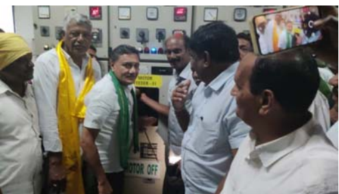
ముచ్చుమర్రి, మల్కాపా అతిపోతల నుండి నీటి విడుదల నీటిని విడుదల చేసిన మాండ్ల శివానందరెడ్డి ఎమ్మెల్యే జయసూర్యకు రైతుల ప్రత్యేక ధన్యవాదాలు కూటమి ప్రభుత్వానికి కేసీ రైతుల ధన్యవాదాలు