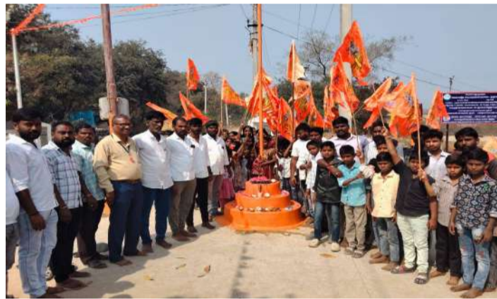
వేద న్యూస్, టేక్సాస్ :

మెడల్ జిల్లా టేక్సాస్ మండలం ఎల్లుపేట గ్రామంలో ఛత్రపతి శివాజీ మహారాజ్ 396వ జయంతి వేడుకలను బహుజన విద్యార్థి సంఘం ఆధ్వర్యంలో ఘనంగా నిర్వహించారు. ఈ సందర్భంగా శివాజీ మహారాజ్