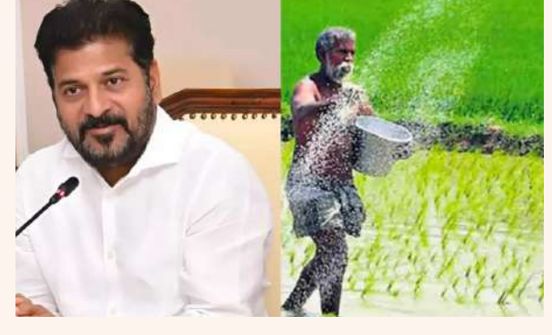
వేద న్యూస్, హైదరాబాద్ ప్రతినిధి

త్వరగా నిధులు విడుదల చేయాలని కోరుతున్న రైతులు.