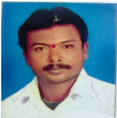
వేద న్యూస్, ఇబ్రహీంపట్నం: