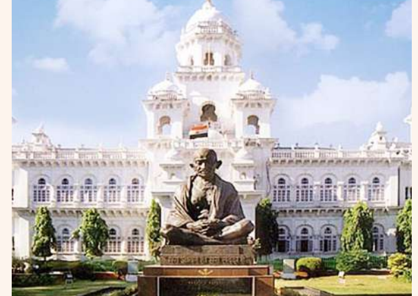
వేద న్యూస్, హైదరాబాద్ ప్రతినిధి

తెలంగాణ రాష్ట్ర అసెంబ్లీ బడ్జెట్ సమావేశాలకు ముహూర్తం ఖరారైంది. మార్చి 16 నుంచి 30వ తేదీ వరకు సమావేశాలు నిర్వహించాలని రాష్ట్ర మంత్రివర్గం నిర్ణయించింది. ముఖ్యమంత్రి వినయ్ ముల రేపంత్ రెడ్డి ఆధ్వర్య క్షతన సచివాలయంలో జరిగిన కేబినెట్ సమావేశంలో ఈ షెడ్యూల్ను ఖరారు చేసినట్లు సమాచారం. సమావేశాల తొలి రోజైన మార్చి 16న గవర్నర్ జిమ్మ దేవ్ వర్మ ఉభయ సభలను ఉద్ఘాటించి ప్రసంగించనున్నారు. రాష్ట్ర ప్రభుత్వ విధానాలు, ప్రాధాన్యతలు, రాబోయే ఏడాదికి సంబంధించిన కార్యాచరణపై గవర్నర్ తన ప్రసంగంలో ప్రస్తావించనున్నట్లు తెలుస్తోంది. అనంతరం మార్చి 17, 18 తేదీల్లో గవర్నర్ ప్రసంగానికి దసవవాదాలు తెలిపే తీర్మానంపై సభలో చర్చ జరుగుతుంది. మార్చి 20వ తేదీన రాష్ట్ర ఉప ముఖ్యమంత్రి, ఆర్థిక శాఖ మంత్రి మల్లు భట్టి విక్రమార్క 2026-27 ఆర్థిక సంవత్సరానికి సంబంధించిన బడ్జెట్ను సభలో ప్రవేశపెట్టనున్నారు. రాష్ట్ర ఆర్థిక పరిస్థితి, ఆదాయం-వ్యయ అంచనాలు, సంక్షేమ-అభివృద్ధి కార్యక్రమాలకు కేటాయింపులు బడ్జెట్లో ప్రాధాన్యం పొందనున్నాయి. మార్చి 30 వరకు జరిగే ఈ సమావేశాల్లో బడ్జెట్పై విస్తృత చర్చలు, శాఖల వారీగా డిమాండ్లపై చర్చ, ఆమోద ప్రక్రియ జరుగుతుంది. రాష్ట్ర రాజకీయాల్లో బడ్జెట్ సమావేశాలు కీలకంగా మారనున్నాయి.