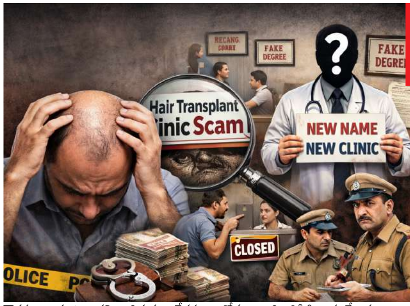
దౌర్జన్యంగా మాట్లాడారని బాధితుడు ఆవేదన వ్యక్తం చేశాడు.

తనకు జరగాల్సిన ట్రీట్మెంట్ గురించి అడిగిన బాధితుడిపై క్లినిక్ సిబ్బంది దురుసుగా ప్రవర్తించారు. తమకు 300 మంది క్లయింట్ల చరిత్ర ఉందని డాక్టర్ చెప్పగా, కనీసం పది మంది సర్కెస్ డేటా చూపమని అడిగినందుకు బాధితుడిపై దుర్భాషలాడారు. తాజాగా ఈ క్లినిక్ పేరును మార్చినట్లు చెబితూ, పాత క్లయింట్లకు ఒక్క రూపాయి కూడా రిఫండ్ ఇవ్వబోమని వైదరాబాద్ ట్రాన్స్ జనరల్ మేనేజర్ ను చలకన చేస్తూ మాట్లాడటం వారి అపరాధానికి నిదర్శనం. 'మేము రిఫండ్ ఇవ్వం, ఏం చేసుకుంటారో' చేసుకోండి' అంటూ ఆమె