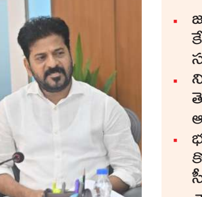
నారాచంద్రబాబునాయుడు నిర్ణయంపై హారీశ్ హార్షం

హైదరాబాద్ కోకాపేటలో శారదా పీఠానికి కేటాయించిన భూమిని పీఠానికి కొనసాగించాలని ముఖ్యమంత్రి ఎ. రేవంత్ రెడ్డి అధికారులను ఆదేశించారు. పీఠానికి కేటాయించిన భూములను జల మండలికి కేటాయించిన నేపథ్యంలో అక్కడ కొనసాగుతున్న నిర్మాణ పనులపై పీఠం ప్రతినిధులు ముఖ్యమంత్రి దృష్టికి తీసుకువచ్చారు. ఈ అంశంపై రాష్ట్ర సచివాలయంలో ముఖ్యమంత్రి ఉన్నతాధికారులతో సమీక్షా సమావేశం నిర్వహించారు. కోకాపేట భూముల్లో పీఠం ఆధ్వర్యంలో పనిచేస్తున్న నిర్మాణాల తాజా పరిస్థితిని నిర్వాహణ స్థితిని తెలియజేయకపోవడంపై ముఖ్యమంత్రి ఆగ్రహం వ్యక్తం చేశారు. జల మండలికి చేసిన కేటాయింపులను రద్దు చేసి, భూములను శారదా పీఠానికి కొనసాగించాలని స్పష్టమైన నిర్మాణాలు, ఇతర పరిస్థితులపై మంత్రి రాజశాస్త్రి శ్రీధర్ బాబును కలిసి వివరించాలని పీఠం ప్రతినిధులకు సూచించారు. అలాగే, అధికారులు జారీ చేశారు. అలాగే, అధికారులు జారీ చేశారు. అలాగే, అధికారులు జారీ చేశారు.