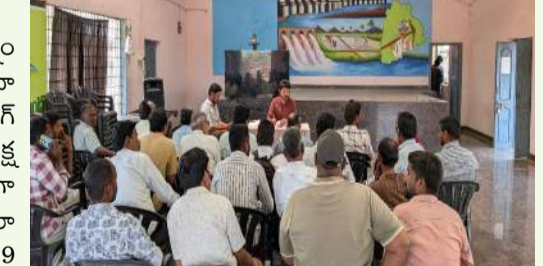
వేద న్యూస్, శంకరపట్నం: