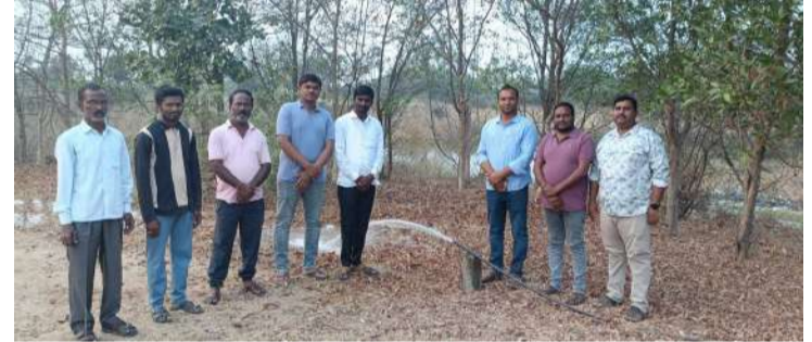
వేద న్యూస్, ఇల్లంతకుంట్ల: