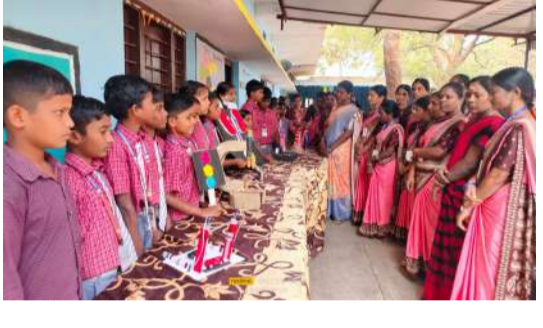
వేద న్యూస్, ఇల్లంతకుంట్ల: