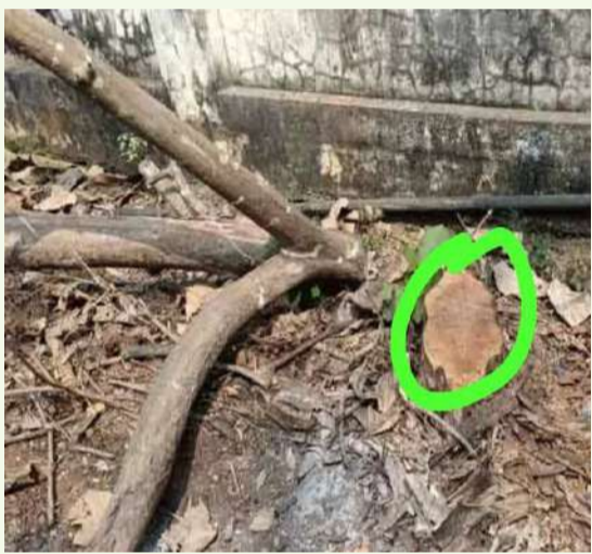
ఉన్నతాధికారులు తక్షణమే స్పందించి సమగ్ర విచారణ జరపాలన్నారు. నరికిన టేకు కలవ నిల్వలు ఎక్కడున్నాయో వెల్లడించాలని, బాధ్యులైన హెచ్ఎం మరియు సిబ్బందిపై చట్టపరమైన చర్యలు తీసుకోవాలని డిమాండ్ చేశారు.

నరికిన చెట్ల దుంగలు ఎక్కడికి తరలించారన్న అంశంపై స్పష్టత లేకపోవడంతో అనుమానాలు మరింత పెరుగుతున్నాయి. చెట్ల ఆసవాళ్లు కనిపించకుండా చేసేందుకు పాఠశాల యంత్రాంగం ప్రయత్నిస్తున్నట్లు స్థానికులు చర్చించుకుంటున్నారు. పచ్చదనం, పరిశుభ్రతకు ప్రాధాన్యం ఇస్తున్న విద్యాశాఖ విధానాలకు ఇది పూర్తిగా విరుద్ధమని పలువురు వ్యాఖ్యానిస్తున్నారు. విచారణకు విద్యార్థి సంఘాల డిమాండ్ ఈ ఘటనపై విద్యార్థి సంఘాల నాయకులు తీవ్ర ఆగ్రహం వ్యక్తం చేశారు. విలువైన ప్రభుత్వ ఆస్తిని దుర్వినియోగం చేసిన బాధ్యులపై కఠిన చర్యలు తీసుకోవాలని డిమాండ్ చేశారు. ముఖ్యంగా.. ఐటీడీఏ