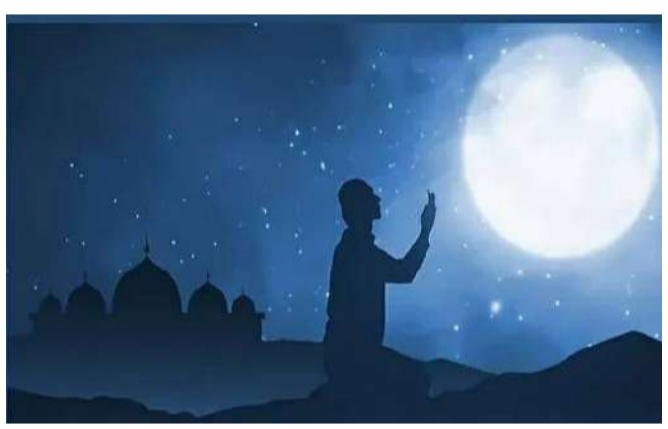
వేద న్యూస్, రుద్రూర్:

షబ్-ఎ-బరాత్ ముస్లిం సమాజం అత్యంత భక్తి శ్రద్ధలతో జరుపుకునే ముఖ్యమైన పండుగలలో ఒకటి. నేటి రాత్రి దేశవ్యాప్తంగా షబ్-ఎ-బరాత్ పండుగను ఘనంగా జరుపుకోనున్నారు. ఇస్లామిక్ క్యాలెండర్ ప్రకారం షాబాన్ నెల 15వ రాత్రి పండుగను నిర్వహిస్తారు. రంజాన్ నెలకు సుమారు 15 రోజుల ముందుగా షబ్-ఎ-బరాత్ వస్తుంది. ఇస్లాంలో షాబాన్ నెలను అత్యంత పవిత్రమైనదిగా పరిగణిస్తారు. షబ్-ఎ-బరాత్ రోజున భక్తులు తమ పాపాలు క్షమించబడతాయని విశ్వసిస్తూ రాత్రంతా జాగారం చేస్తారు. మసీదుల్లో ప్రత్యేక సమాజాలు ఆచరిస్తూ అల్లాహ్ ను ఆరాధించి మన్నించునకు ప్రార్థనలు చేస్తారు. అనంతరం ఖబర్ సైన్ (శ్మశానవాటిక)లను సందర్శించి పూర్వీకుల సమాధుల వద్ద మగ్గిరత్ (మన్నింపు) కోసం దువాలు చేస్తారు. ఈ పండుగ సందర్భంగా శుభాలు, క్షేమం కలగాలని ప్రార్థిస్తూ, రాబోయే పవిత్ర రంజాన్ నెలకు ఆధ్యాత్మికంగా సిద్ధమవుతారు. వీలైనన్ని ఎక్కువ ప్రార్థనలు చేసి దైవ సాన్నిధ్యాన్ని పొందేందుకు భక్తులు ప్రయత్నిస్తారు.