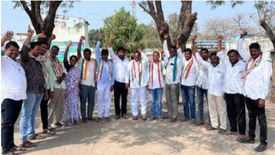
యూనివర్సిటీ కూడా రాకపోవడం దురదృష్టకరం అని వ్యాఖ్యానించారు. ఆర్కయర్-ఆదిలాబాద్ రైల్వే లైన్ విషయంలో ఎంపీకి చిత్తశుద్ధి లేదని ఆరోపించారు. కేంద్ర