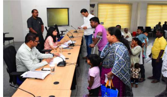
వేద న్యూస్, రాజన్లనిలెల్ల:

జిల్లా సమీకృత కార్యాలయాల సమదాయంలో సోమవారం నిర్వహించిన ప్రజావాణి కార్యక్రమంలో మొత్తం 164 దరఖాస్తులు అందినట్లు అధికారులు తెలిపారు. కలెక్టర్ గరిమ అగ్రవాల్ ప్రజల నుంచి నేరుగా అర్జీలు స్వీకరించి,