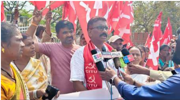
వేద న్యూస్, కరీంనగర్: