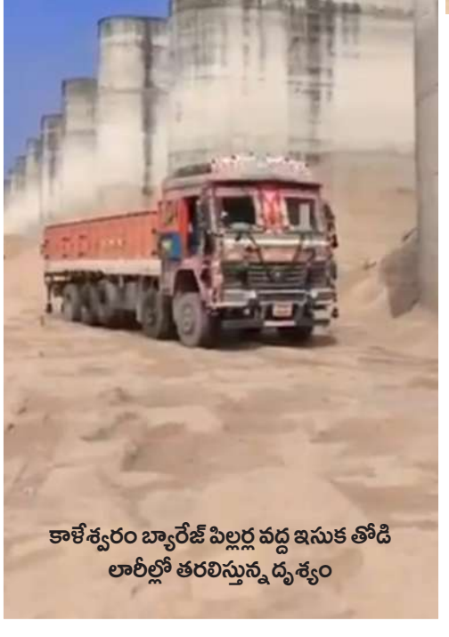
కాళేశ్వరం బ్యారేజ్ పిల్లర్ల వద్ద ఇసుక తోడి లారీల్లో తరలిస్తున్న దృశ్యం

కాళేశ్వరం ప్రాజెక్టు పునాదులను పెకిలిస్తూ, స్వార్థపరులైన ఇసుక మాఫియా సాగిస్తున్న అరాచకాలు ఇప్పుడు రాష్ట్రవ్యాప్తంగా కలకలం రేపుతున్నాయి. బ్యారేజ్ పిల్లర్ల పక్కనే జేసీబీల జాతర జరుగుతోంది. క్యూ కట్టిన వందలాది లారీలు.. పగలు, రాత్రి అనే తేడా లేకుండా నిరాటంకంగా సాగుతున్న ఈ ఇసుక తవ్వకాలు చూస్తుంటే, అసలు ఇక్కడ అధికారులే ఉన్నారా? లేక ఇసుక మాఫియా రాజ్యమేలుతోందా? అనే అనుమానం కలగుతోంది. ఈ తవ్వకాల వల్ల ప్రాజెక్టు పిల్లర్ల స్థిరతపై దెబ్బతిన, భవిష్యత్తులో భారీ విపత్తుకు దారితీసే అవకాశం ఉందని తెలిసినా, అధికారుల కనుసన్నల్లోనే ఈ దందా సాగుతుండటం అత్యంత విపాదకరం. వ్యవస్థకు వెన్నుముకగా ఉండాల్సిన అధికారులే.. మాఫియాకు అండ దండలు అందిస్తుంటే, ఈ విధ్వంసాన్ని ఆపేదెవరు? కొంత మంది అధికారుల ప్రోత్సాహంతో జరుగుతున్న ఈ దందా వెనుక ఉన్న అసలు కుట్ర ఏమిటి? కాళేశ్వరం పునాదులను పెకిలిస్తూ, ఇసుకాసురుల అరాచకాలపై 'వేద న్యూస్' అందిస్తున్న ప్రత్యేక కథనం..