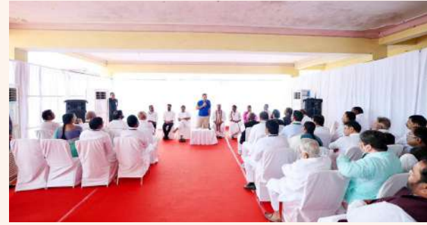
వేద న్యూస్, వికారాబాద్

లోక్ సభలో ప్రధాన ప్రతిపక్ష నాయకుడు రాహుల్ గాంధీని దేశ ప్రధాని పీఠంపై చూడడమే తమ లక్ష్యమని తెలంగాణ ముఖ్యమంత్రి రేవంత్ రెడ్డి స్పష్టం చేశారు. వికారాబాద్ లో నిర్వహించిన తెలుగు రాష్ట్రాల డీసీసీ అధ్యక్షుల శిక్షణా ముగింపు సమావేశం రాజకీయంగా ప్రాధాన్యం సంత రించుకుంది. ఈ సమావేశంలో రాహుల్ గాంధీతో పాటు సీఎం రేవంత్ రెడ్డి పాల్గొని పార్టీ శ్రేణులకు దిశానిర్దేశం చేశారు. దేశం ప్రస్తుతం అనేక సవాళ్లను ఎదుర్కొంటోందని, వాటిని సమర్థంగా ఎదుర్కొనే నాయకత్వం అవసరమని రేవంత్ పేర్కొన్నారు. ఆ బాధ్యతను నిర్వహించగల సామర్థ్యం రాహుల్ గాంధీకి ఉందని ఆయన అభిప్రాయపడ్డారు. దేశ ప్రయోజనాల కోసం, రాజ్యాంగ పరిరక్షణ కోసం కాంగ్రెస్ పార్టీ బలపడాలి అవసరం ఉందని పిలుపునిచ్చారు. డీసీసీ అధ్యక్షులు గ్రామ స్థాయి నుంచి పార్టీని బలోపేతం చేసి, ప్రజల సమస్యలను ఎత్తిచూపాలని సూచించారు. ప్రజా జీవితంలో తాను ఎప్పుడూ పైరవీలు చేయలేదని రేవంత్ స్పష్టం చేశారు. ప్రజాసమస్యలపై గళం విప్పినందుకు తనపై అనేక కేసులు సమోదయా యని గుర్తుచేసుకున్నారు. ఆదివాసం కూడా కొర్రుకు వెళ్లాలి వచ్చిందని తెలిపారు. గత 19 ఏళ్ల రాజకీయ ప్రస్థానంలో జడ్పీటీసీ స్థాయి నుంచి ముఖ్యమంత్రి స్థాయికి ఎదిగానని పేర్కొన్నారు. పార్టీ పదవులు నిర్వహిస్తూ, ఎమ్మెల్యేగా అనుభవం సంతరించుకున్నానని వివరించారు. తనపై పరువు నష్టం దావాలు, కేసులు పెట్టినా వెనక్కి తగలేదని రేవంత్ అన్నారు. దేశ సమస్యలపై రాహుల్ గాంధీ నిరంతరం పోరాటం చేస్తు న్నారని కొనియాడారు. బిజెపి కృష్టి ఫలితంగానే రాహుల్ గాంధీ ప్రధాన ప్రతిపక్ష నాయకుడిగా నిలిచారని చెప్పారు. దేశ ప్రజల ఆశలు, ఆకాంక్ష లను నెరవేర్చాలంటే రాహుల్ గాంధీని ప్రధాని చేయడమే లక్ష్యంగా పని చేయాలని డీసీసీ అధ్యక్షులకు స్పష్టమైన సందేశం ఇచ్చారు.