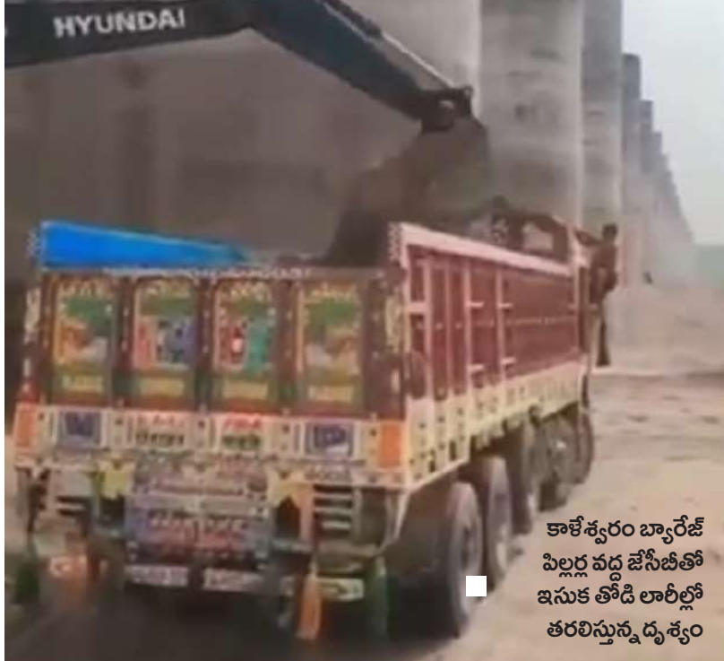
కాళేశ్వరం బ్యారేజ్ పిల్లర్ల వద్ద జేసీబీలతో ఇసుక తోడి లారీలో తరలిస్తున్న దృశ్యం

ఈ అక్రమ తవ్వకాలను చూస్తుంటే, ప్రభుత్వం నిజంగానే ఇసుక మాఫియాపై కఠినంగా ఉందా? లేదా మౌనంగా ఈ విధ్వంసానికి సహకరిస్తోందా? అనే అనుమానాలు వ్యక్తమవుతున్నాయి. కాళేశ్వరం ప్రాజెక్టును ఎలాగైనా కాపా