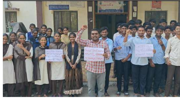
వేద న్యూస్, వరకాల :