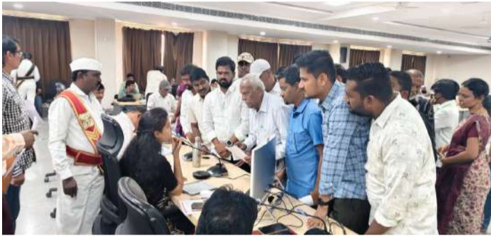
వేద న్యూస్, మడికొండ :