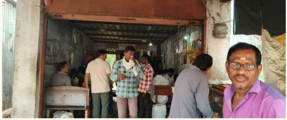
వేద న్యూస్, జమ్మికుంట:

జమ్మికుంట పట్టణవాసులు, పుర ప్రముఖులతో పాటు రాజకీయాలకు ఉదయాన్నే హాయిగా.. టిఫిన్ చేస్తూ.. ఛాయ్ తాగుతూ.. నలుగురితో ముచ్చటించేందుకు చక్కటి వేదికగా మున్సిపల్ పరిధిలోని కొత్తపల్లి 'సారంగం హోటల్' నిలుస్తోంది. సుమారు మూడు దశాబ్దాలకు పైనే చరిత్ర కలిగిన ఈ హోటల్ పట్టణ ప్రజలకు ఫేవరేట్ స్పాట్ గా ఉంటోందని పలువురు అభిప్రాయపడుతున్నారు. 1995లో ఈ హోటల్ ను ప్రారంభించినట్లు నిర్వాహకులు చెబుతున్నారు. అందరి అడ్డా.. ఉదయాన్నే ఏదైనా పని నిమిత్తం వెళ్లే వాళ్లు, ఉద్యోగులు, పుర ప్రముఖులు, రాజకీయ నాయకులు హాయిగా సారంగం హోటల్ వద్దకు వచ్చి.. టిఫిన్ చేస్తూ.. పిచ్చాపాటి ముచ్చట్లు