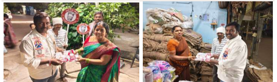
వేద న్యూస్, జమ్మికుంట: