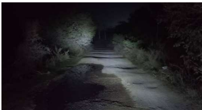
వేద న్యూస్, బోయినిపల్లి:

- ఇప్పటికీ మారని బోయినిపల్లి-మర్లపేట-విలాసాగర్ రోడ్డు