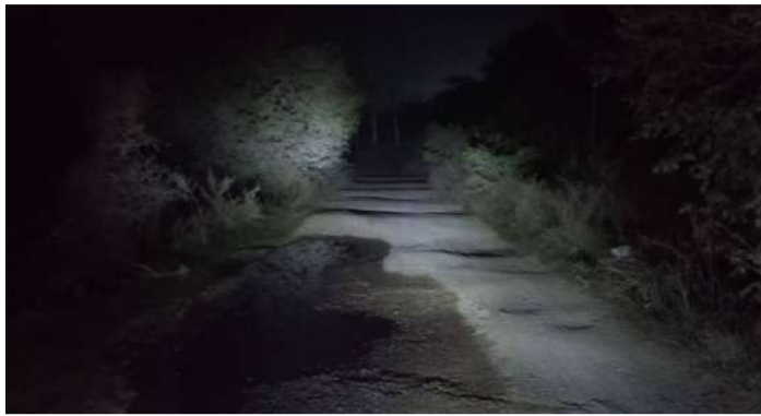
వేద న్యూస్, బోయినిపల్లి:

- ఇప్పటికీ మారని బోయినిపల్లి-మర్లపేట-విలాసాగర్ రోడ్డు