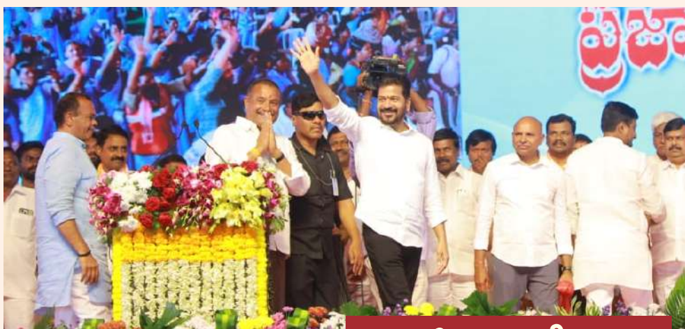
వేద న్యూస్, దామరచర్ల

ఎప్రిల్ లో ప్రవేశపెట్టనున్న నూతన బడ్జెట్ లో లక్షలాది ఇందిరమ్మ ఇండ్లను పేదలకు మంజూరు చేసి వారి ఆత్మగౌరవాన్ని పెంచే బాధ్యతను ప్రభుత్వం తీసుకుంటుందని రాష్ట్ర ముఖ్యమంత్రి వినయమూల రేవంత్ రెడ్డి తెలిపారు. నల్గొండ జిల్లా మిర్యాలగూడ సమీపంలోని గూడూరులో బుద్ధవారం నిర్వహించిన బహిరంగ సభలో సీఎం మాట్లాడారు. అంతకుముందు