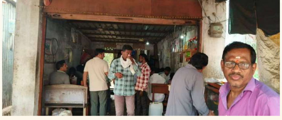
వేద న్యూస్, జమ్మికుంట:

జమ్మికుంట పట్టణవాసులు, పుర ప్రముఖులతో పాటు రాజకీయాలకు ఉదయాన్నే హాయిగా.. టిఫిన్ చేస్తూ.. ఛాయ్ తాగుతూ.. నలుగురితో ముచ్చటించేందుకు చక్కటి వేదికగా మున్సిపల్ పరిధిలోని కొత్తపల్లి 'సారంగం హోటల్' నిలుస్తోంది. సుమారు మూడు దశాబ్దాలకు పైనే చరిత్ర కలిగిన ఈ హోటల్ పట్టణ ప్రజలకు ఫేవరేట్ స్పాట్ గా ఉంటోందిని పలువురు అభిప్రాయపడుతున్నారు. 1995లో ఈ హోటల్ ను ప్రారంభించినట్లు నిర్వాహకులు చెబుతున్నారు. అందరి అడ్డా.. ఉదయాన్నే ఏదైనా పని నిమిత్తం వెళ్లే వాళ్లు, ఉద్యోగులు, పుర ప్రముఖులు, రాజకీయ నాయకులు హాయిగా సారంగం హోటల్ వద్దకు వచ్చి.. టిఫిన్ చేస్తూ.. పిచ్చాపాటి ముచ్చట్లు